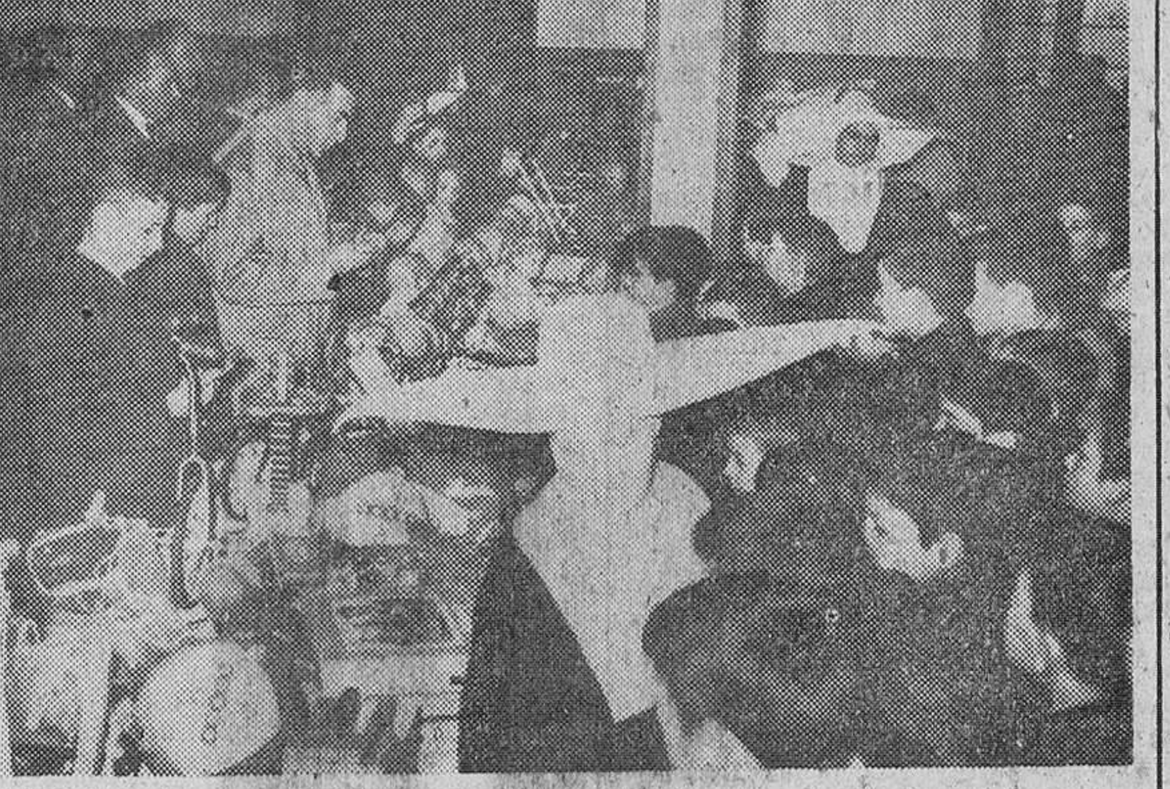
«He aquí un momento de la cautivadora fiesta celebrada en los Establecimientos provinciales de Beneficencia, con motivo del reparto de juguetes, llevados por los Reyes Mayos a dicho Centro.»

La «Caritas» organizó una cabalgata que recorrió varios pueblos