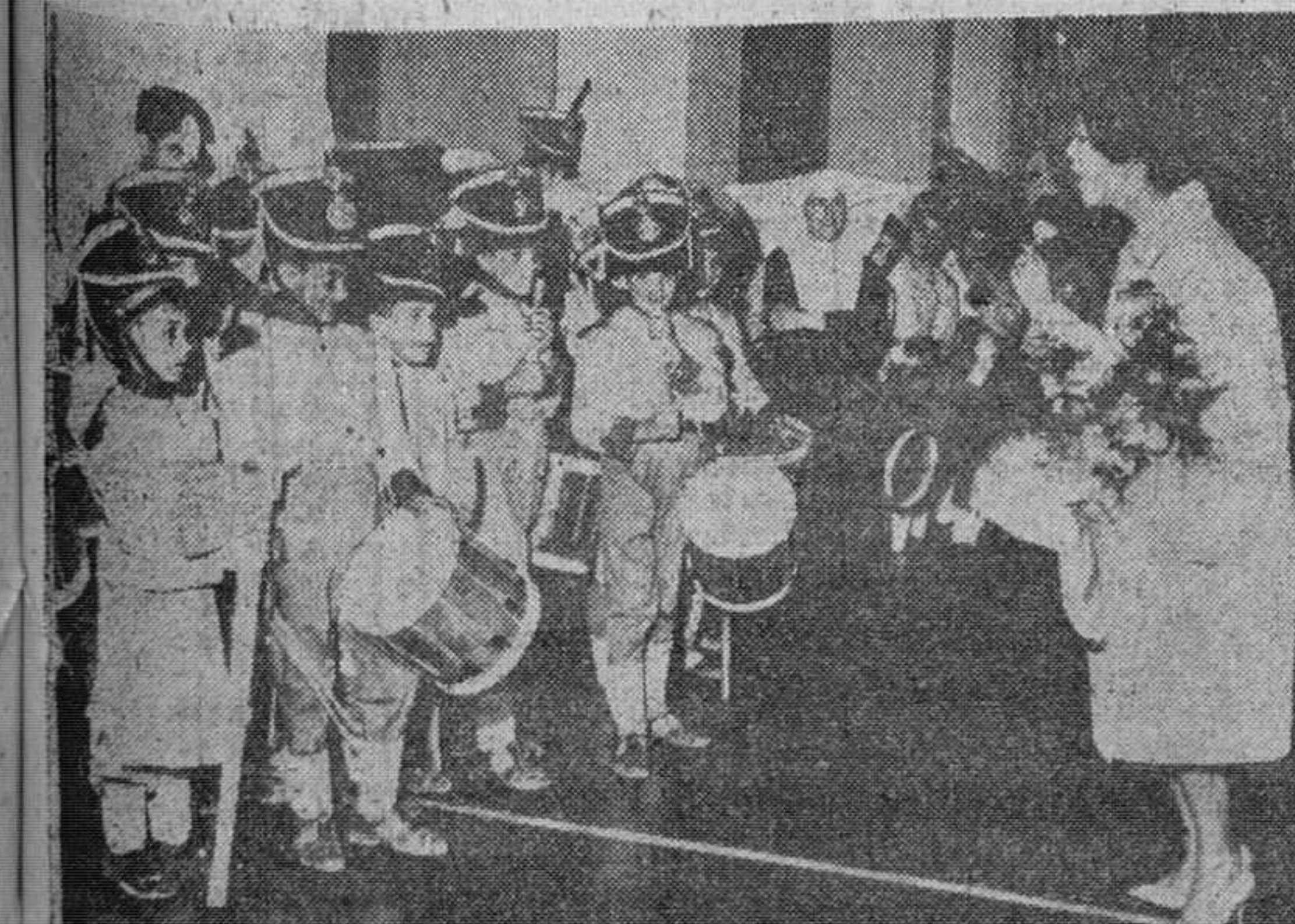
Sara Montiel canta para los niños de la Misericordia. La actriz Sara Montiel ha visitado la Santa Casa de la Misericordia. Interpretó para los niños, que vistían uniforme para la "tamborrada infantil" una de las canciones que tan popular la han hecho.

El senador Keating ha añadido que, en definitiva, diez buques más, algunos con bandera de ciertos países occidentales, entre los que se incluyen las de la Alemania occidental, Italia y Noruega, están en ruta hacia Cuba con más hombres y material procedentes del bloque comunista.