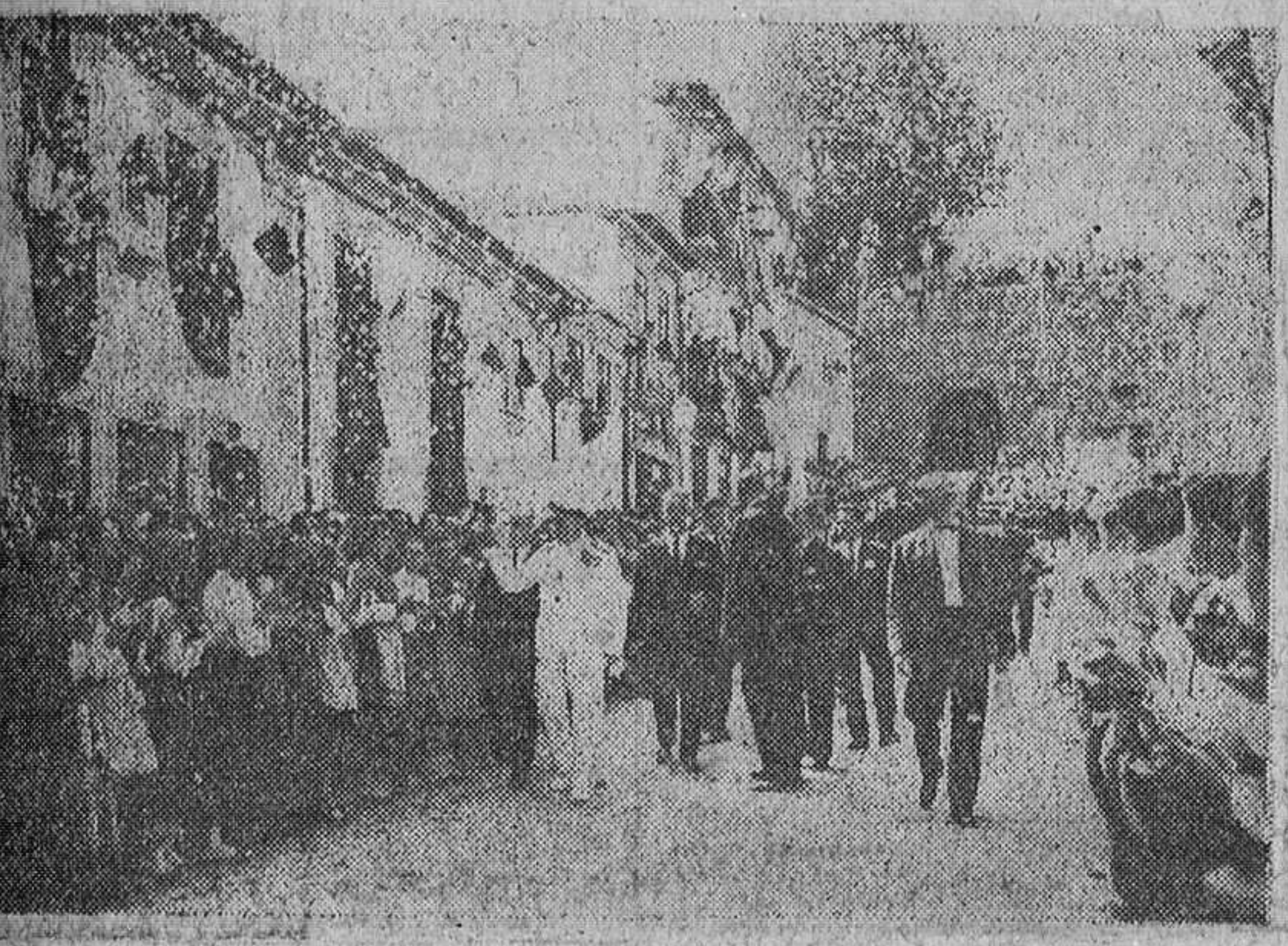
El presidente de Portugal visita una ciudad fronteriza con España. Valenciano de Miño. — El almirante Tomás ha sido el primer presidente de la República portuguesa que ha visitado Valencia de Miño, la ciudad fronteriza con España, por la villa de Tuy. El motivo de la visita ha sido la inauguración de un magnífico parador de Turismo a dos kilómetros del puente internacional y de un nuevo edificio para la aduana. Un enorme gentío tributó al presidente un caluroso recibimiento.