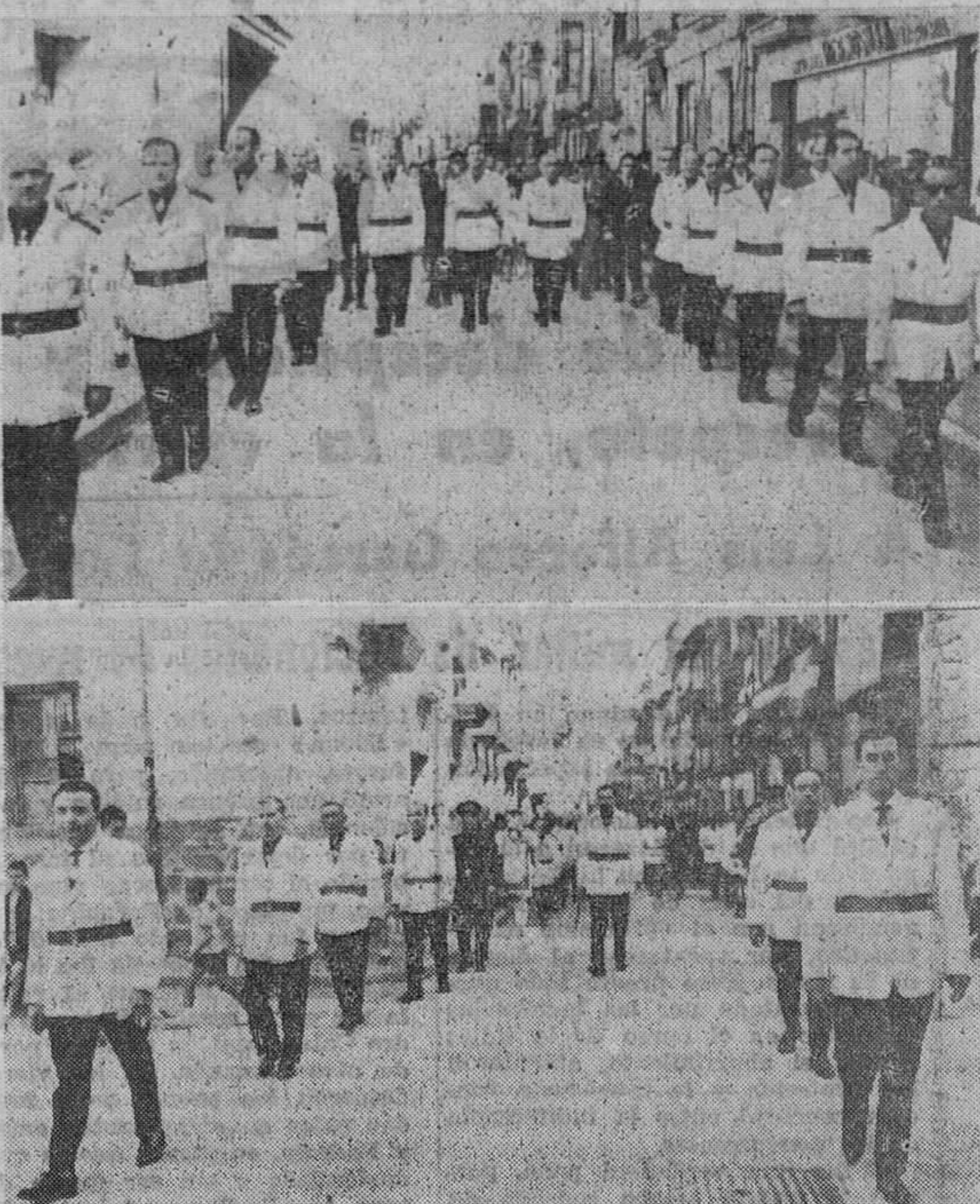
La Diputación provincial y el Ayuntamiento de Brivesca, dirigiéndose en cuerpo de comunidad, a la ex-colegiata de Santa María para asistir a la misa en que se iniciaron los brillantísimos actos del domingo.

Al mismo tiempo, en la calle, hubo animados bailes.