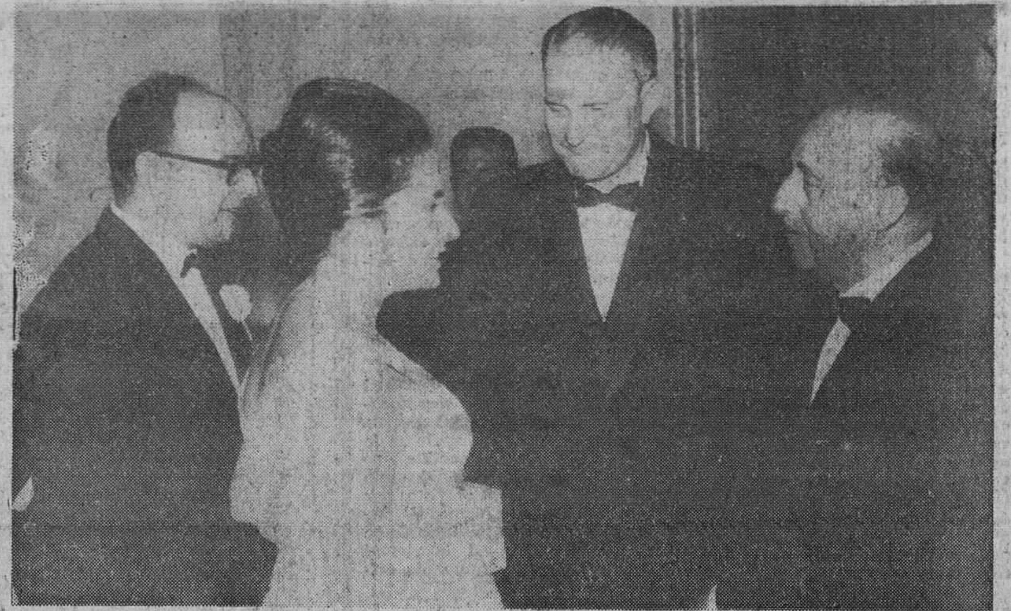
El Caudillo asistió al estreno de la «Atlántida» del ministro de Asuntos Exteriores, Sr. Castiella, conversando con la sobrina de Falla en el entretanto del estreno de la «Atlántida», obra postuma del ilustre compositor gaditano, en esta capital.

Otros fenómenos de este tipo se produjeron en la zona de Shahrud, en el mes de Febrero de 1953, murieron en él 1.000 personas; otro en el Sur del país en Abril de 1960, el cual costó la muerte o causó heridas a 3.500 personas.