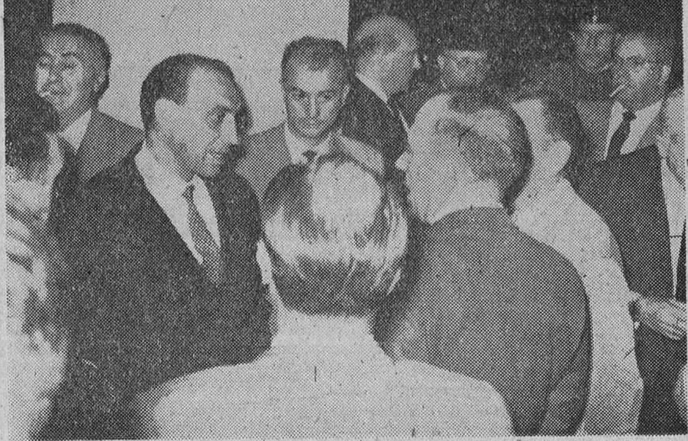
En nuestro grabado: arriba, el señor Perlado, a su llegada, aparece acompañado por el gobernador civil interino, el alcalde de la ciudad y el subjefe provincial del Movimiento. — En la segunda placa, el nuevo gobernador civil conversando con un grupo de personalidades burgalesas y turlesenses.