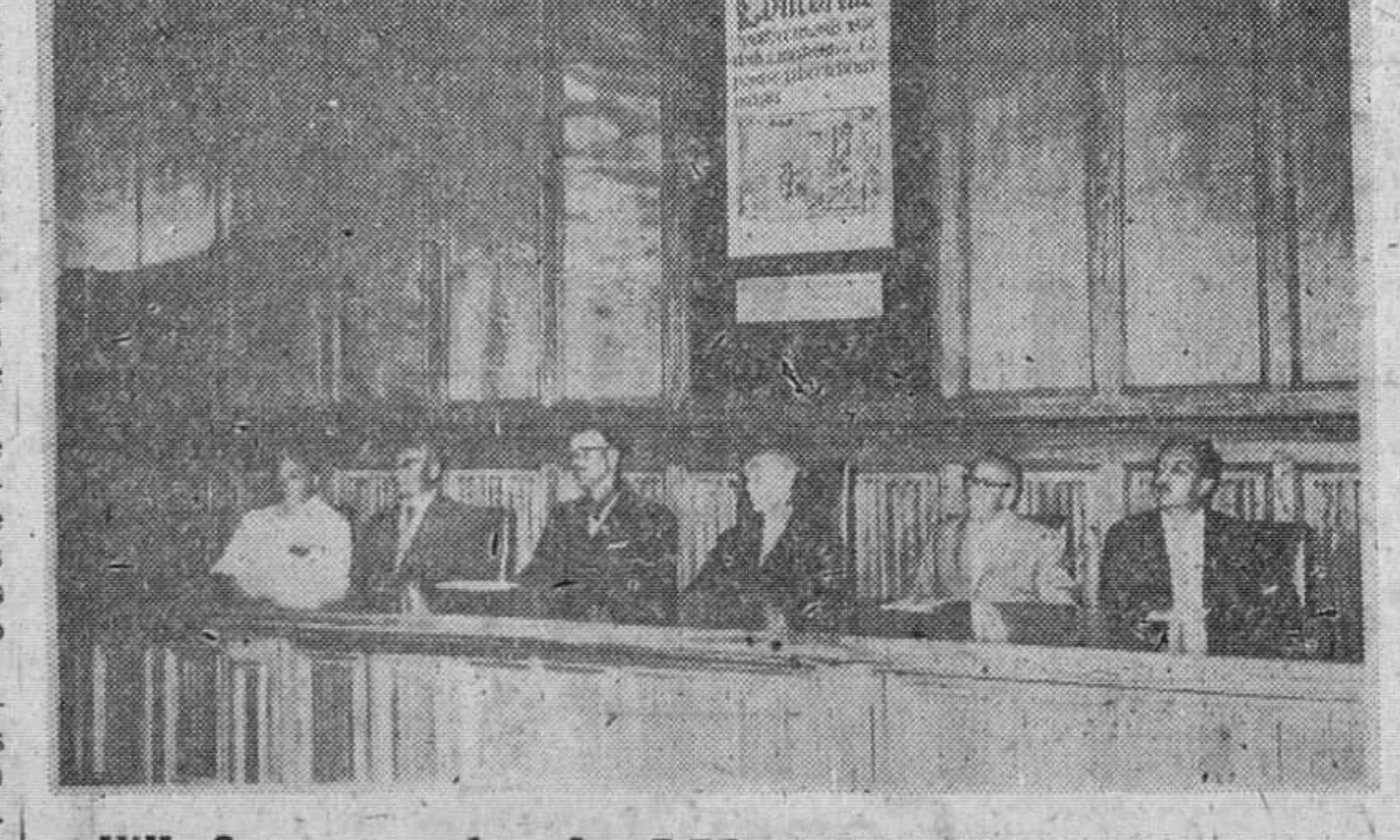
VIII Congreso de la FIEF

Dior, Gardin y Nina Ricci anuncian una serie de abrigos medio ajustados, lo cual nos hace pensar en tejidos muy lanudos y grandes cuellos, practiquemos para los meses de crudo invierno; Balmain añade que los hombros están montados de una forma nueva, tal que cambia las proporciones del busto como dije antes, muy puesto en valer y más bien alto, lo cual se presta a que la cintura también se señale algo más