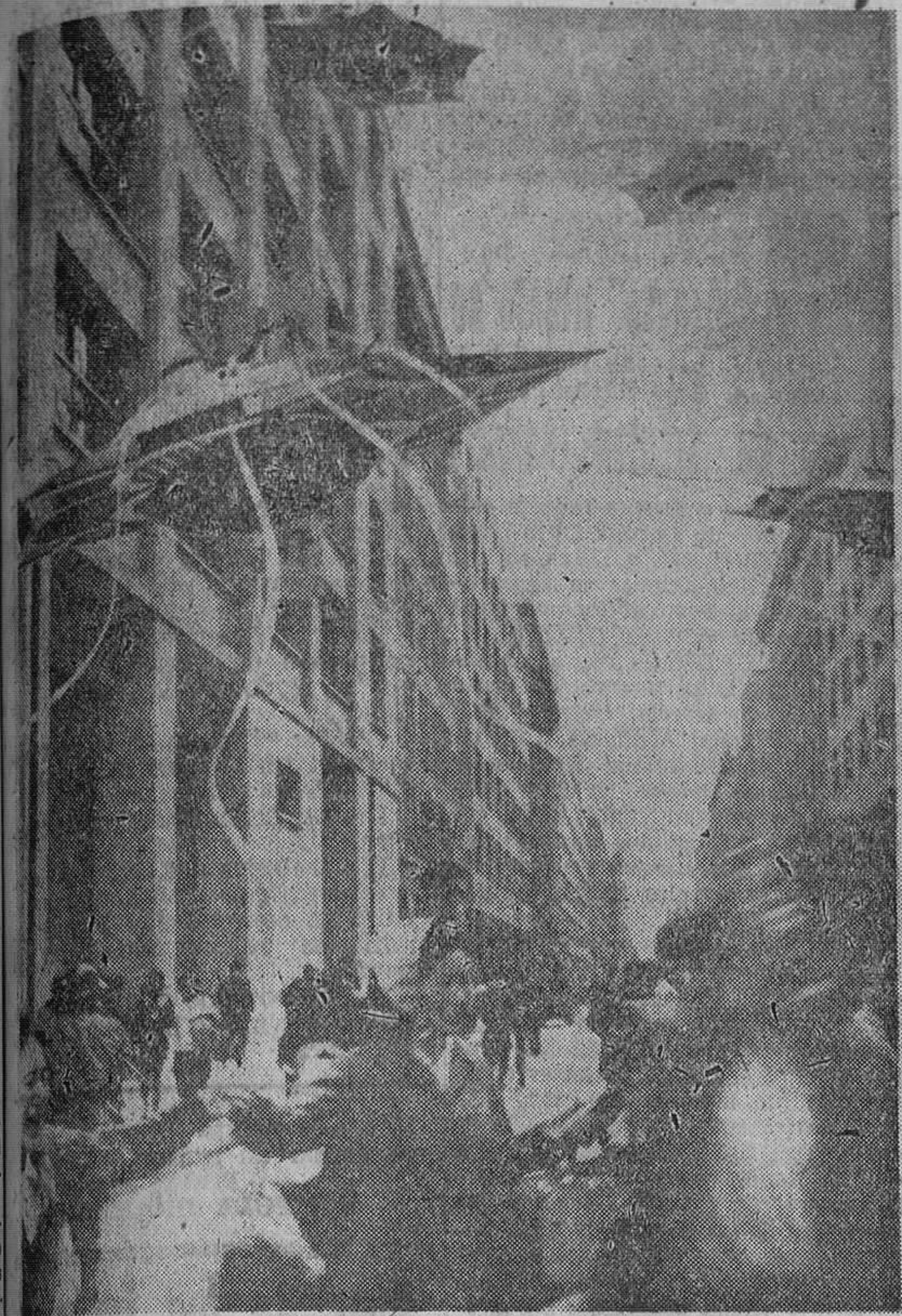
ESCENA DE MIEDO EN UNA PELICULA JAPONESA

El truco de los "muertos de miedo" fue un gran éxito publicitario Hollywood va a la cabeza en la creación de fantasmas y vampiros Guionistas y maquilladores, al servicio de un arte siniestro