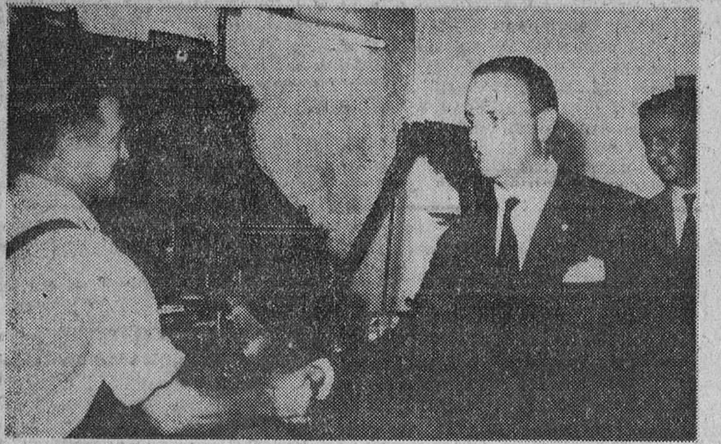
Lugo.—El señor Fraga Iribarne durante su visita a los periódicos de esta capital «El Progreso» y «La Hoja del Lunes», estrecha la mano de un linotipista de «El Progreso».

El ministro de Información y Turismo visita en Lugo las redacciones de los periódicos