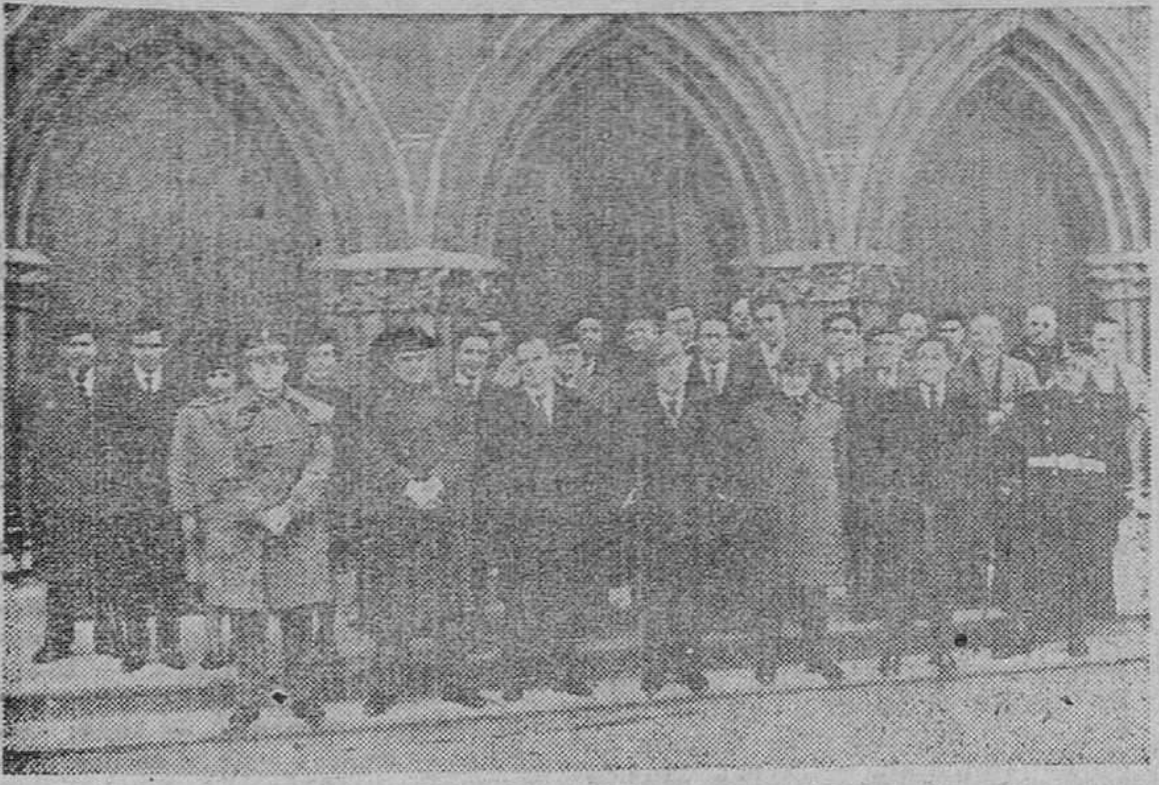
AUTORIDADES Y PERSONAL DE LA EMISORA A LA SALIDA DE MISA.