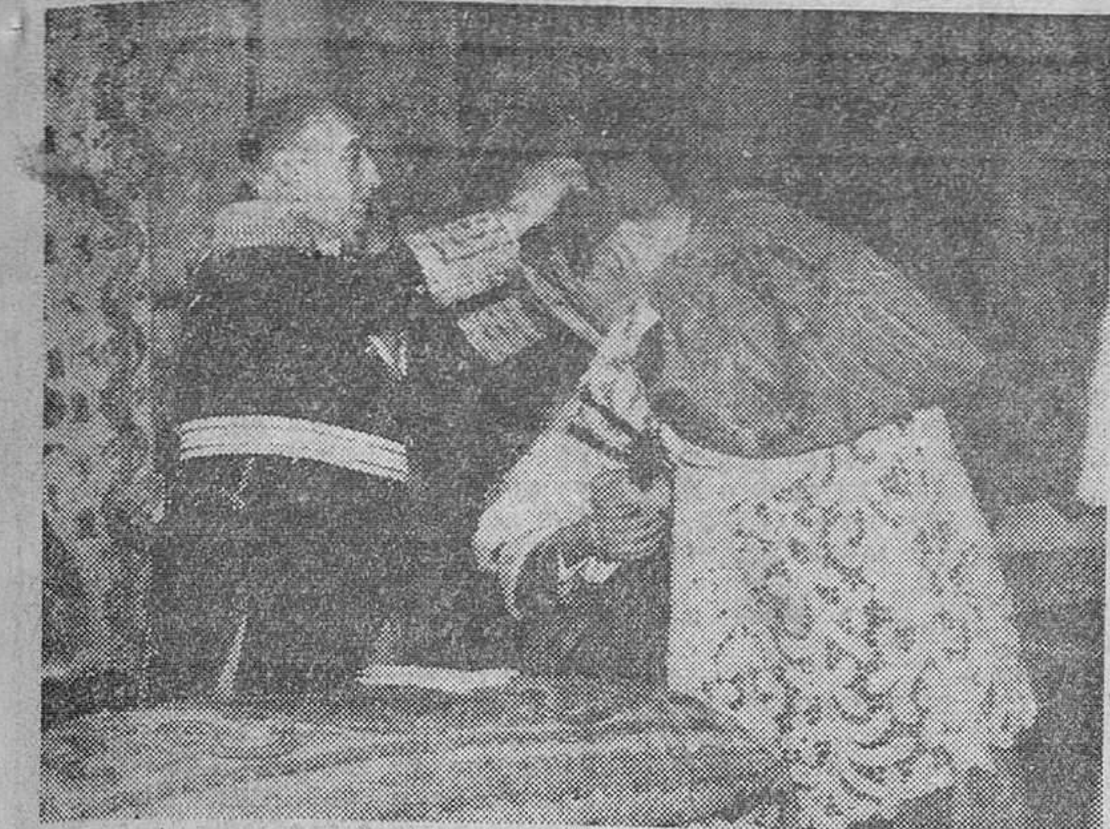
Madrid. — S. E. el Jefe del Estado ha impuesto, en la Capilla del Palacio de Oriente, la birreta cardenalicia a Monseñor Antoniutti. La fotografía ofrece un momento de la solemne ceremonia.