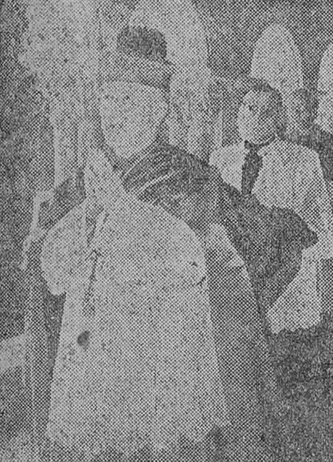
Un momento de la solemnisima procesion que, desde la celda abacial, se dirigió a la iglesia conventual, para la ceremonia celebrada ayer en el histórico Monasterio de Santo Domingo de Silos.

ciudad durante la cual puso las manos sobre el electo y a ella siguieron otras varias oraciones. ENTREGA DE LA REGLA, BACULO Y ANILLO