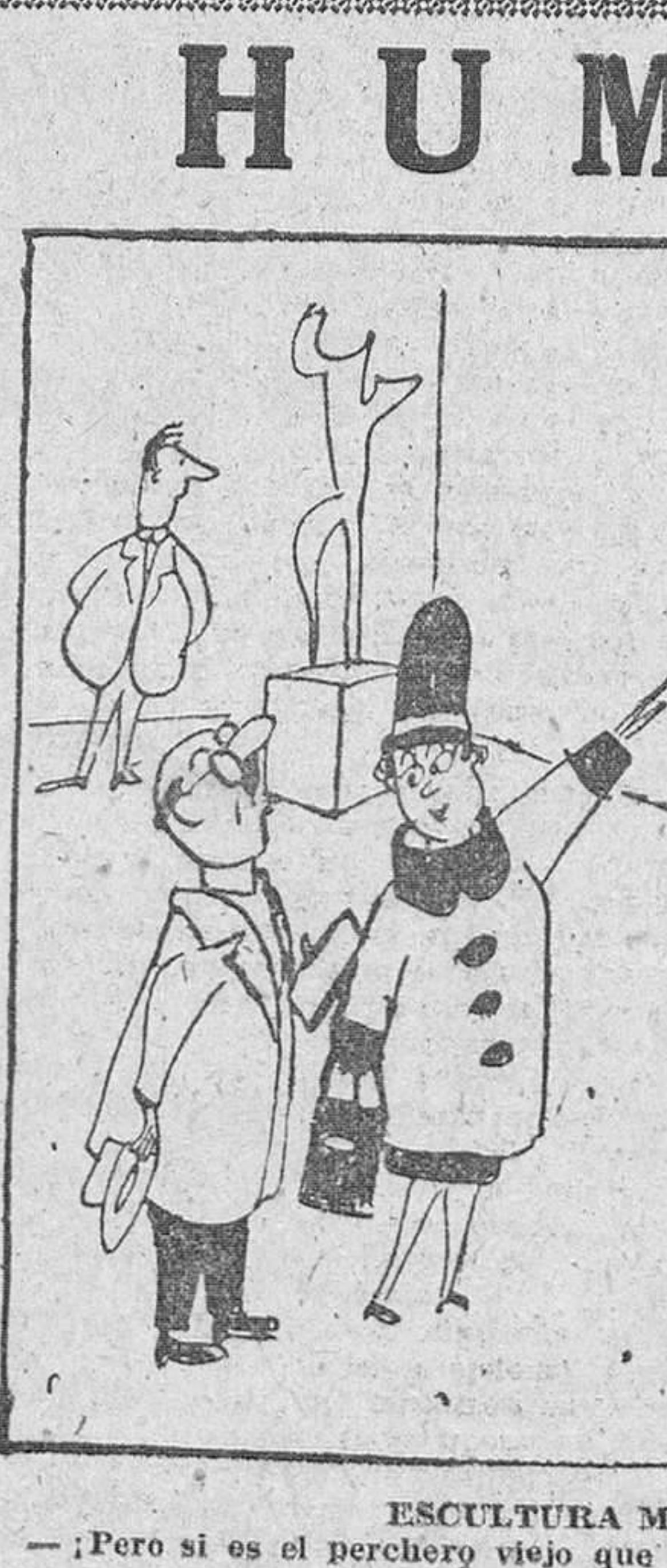
ESCULTURA MODERNA — Pero si es el perchero viejo que vendimos el más pasado!