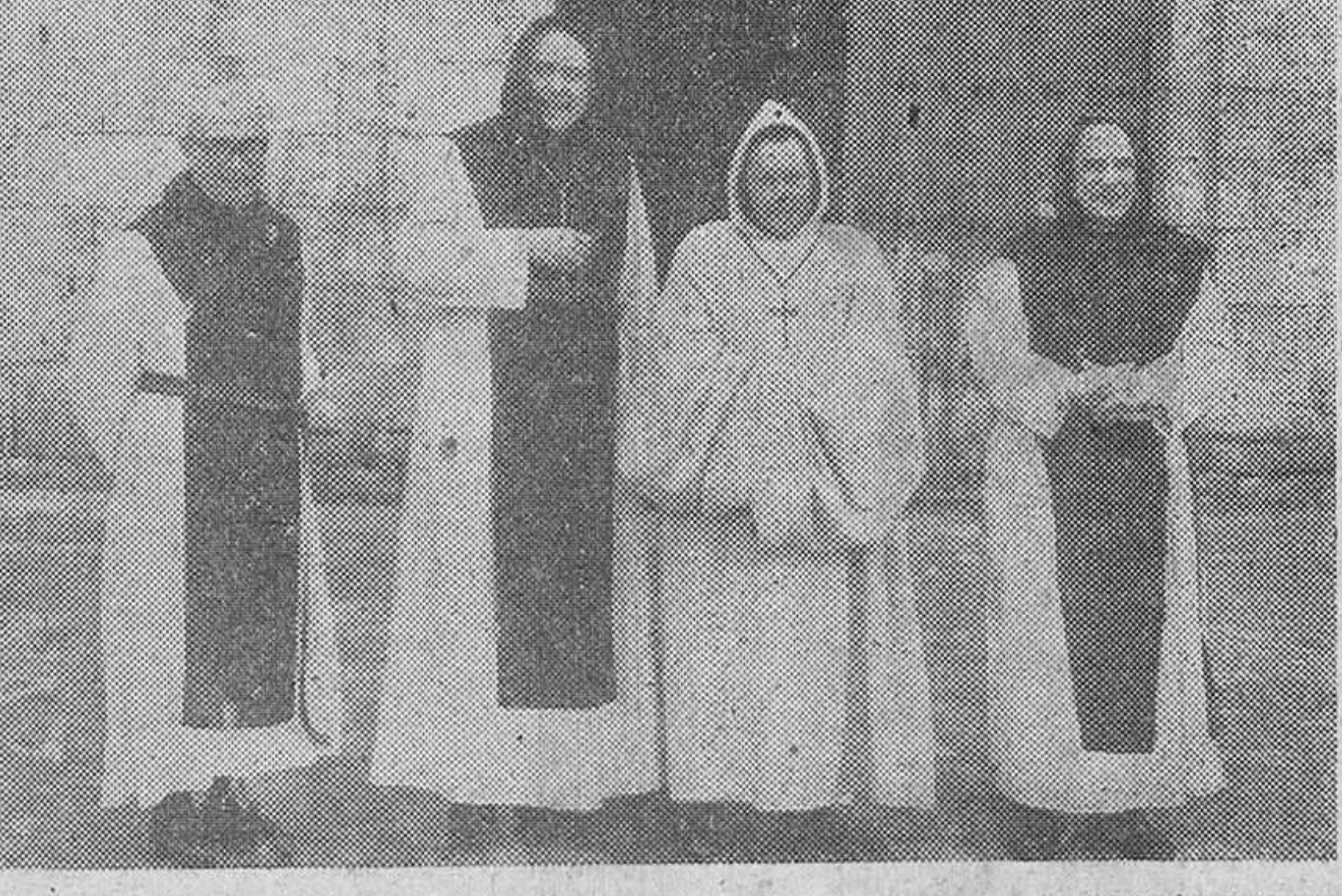
Se encuentra en San Pedro de Cardena el M. R. P. abad general del Cister, a quien efectuaron, a mediados de ayer, una visita, las primeras autoridades de la ciudad, con sus respectivas esposas. Dichas personalidades, con el superior general y el abad del histórico monasterio, figuran en la primera de nuestras placas fotográficas. En la segunda, el ilustre huésped de Cardena con el abad del cenobio y otros dos monjes.