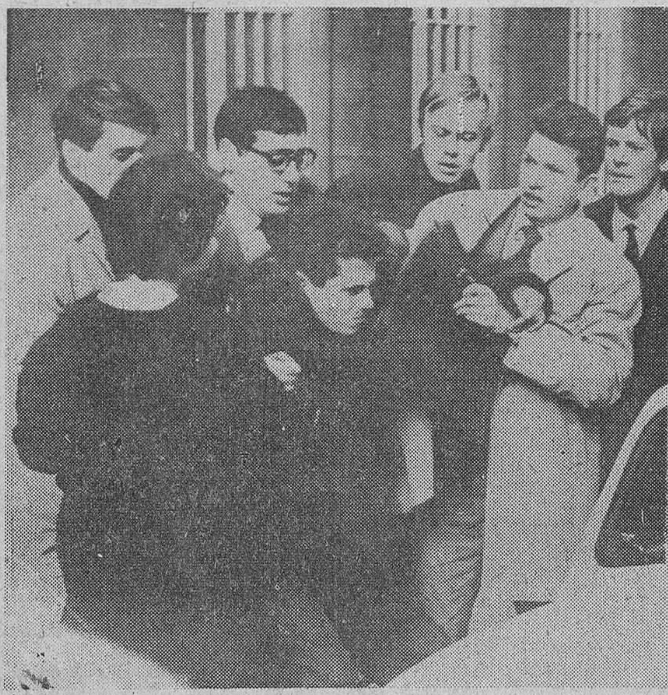
Manifestación anti OAS

Existe, como hemos dicho, una divergencia fundamental acerca de los franceses de Argelia: para París todos los habitantes del país deberían ser franceses hasta la proclamación de la independencia argelina; sólo entonces se convertirían automáticamente en argelinos,