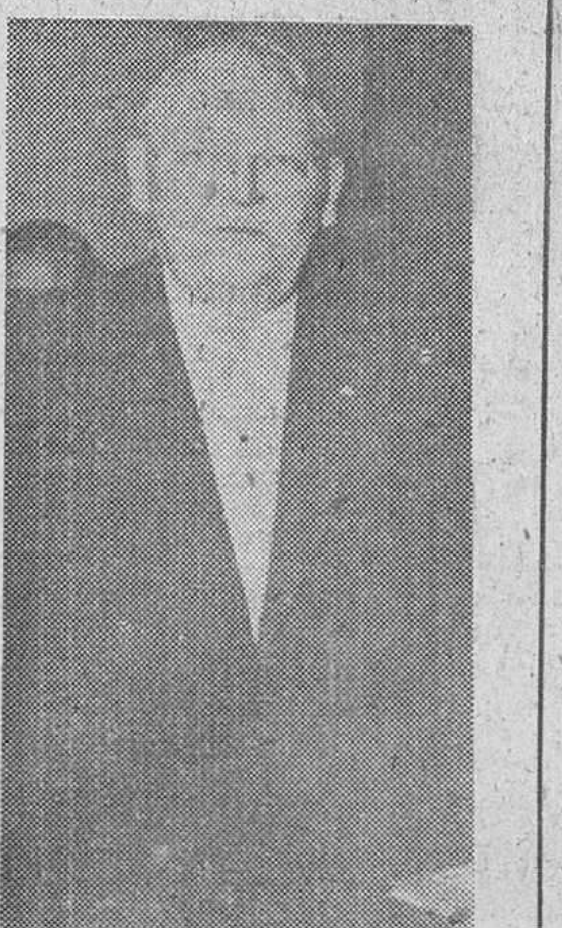
mica alemana» proclamo que un solo artículo continuaba racional en Alemania: el nuevo marco. Erhard considera decisivo aquel 20 de Julio de 1948, ya que entonces intento dar por primera vez un realización práctica a sus teorías de economista.

Hace 16 años los manifestantes de Nuremberg pegaban carteles contra Erhard, mientras en Múnich le llamaban «el desorganizador». Años lejanos de una difícil entrada en la escena política, a los cuales siguieron éxitos fabulosos. Ha pasado mucho tiempo desde el día en que el «director de la Administración Econo-