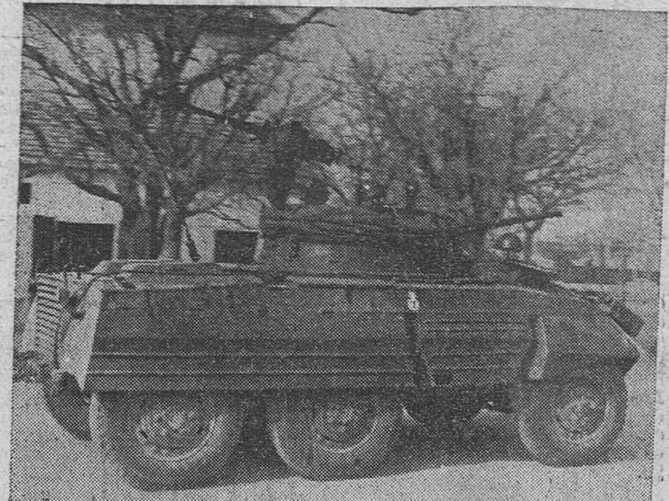
Argel.— Carros blindados patrullan por las calles de la ciudad, tras el levantamiento de las unidades del Ejército francés contra el poder central de la metrópoli.

LA SITUACION SEGUN PARIS París.—El verdadero alcance del control que los generales rebeldes afirman tener sobre el territorio argelino parece ser menor de lo que ellos aseguran, según se dice en memorias. (Pasa a quinta página)