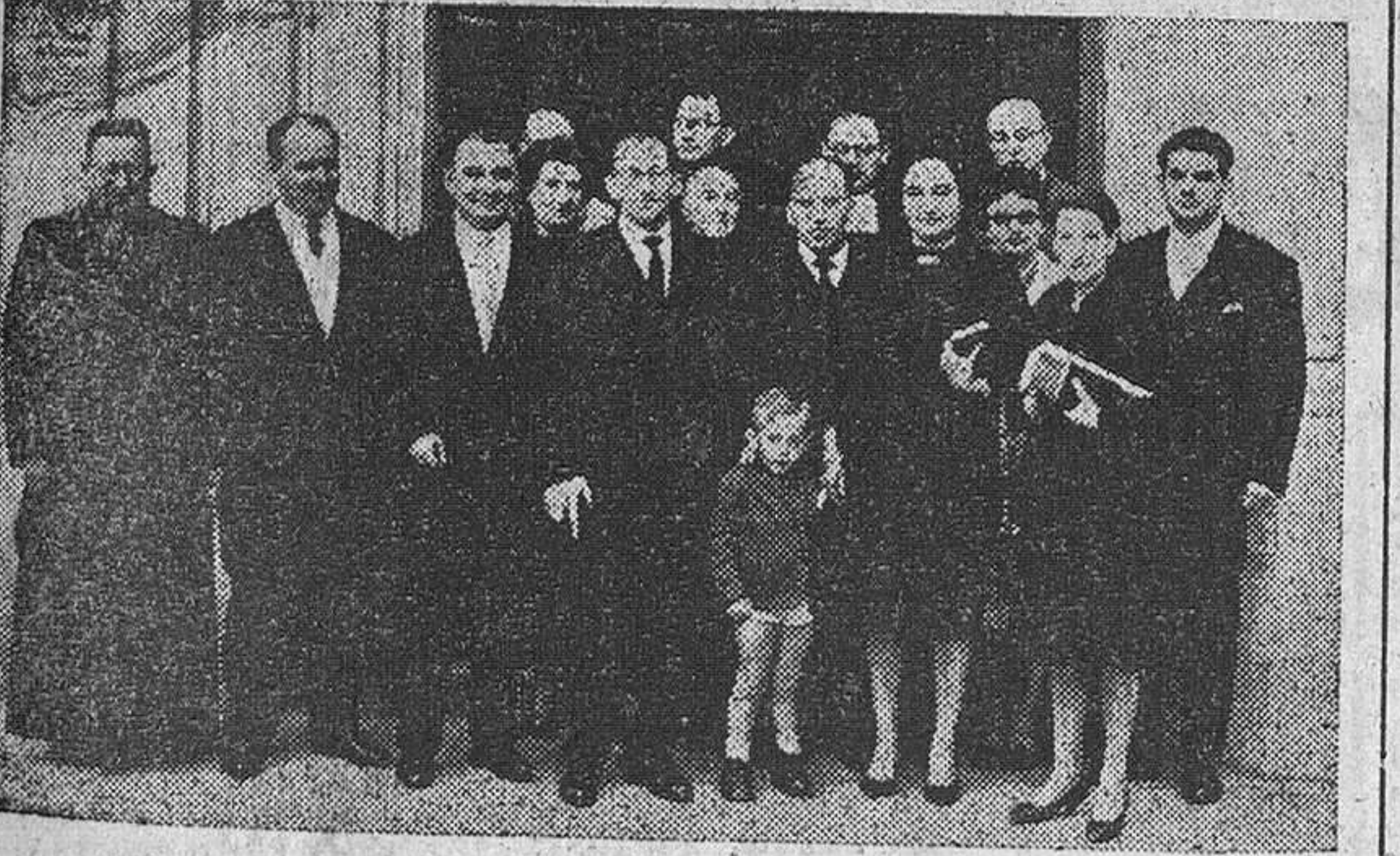
Fiesta patronal de los doctores y licenciados en Filosofía y Letras y Ciencias. Grupo de asistentes a la misa celebrada en la mañana del domingo, en la capilla de las Religiosas Franciscanas Misioneras de María, con motivo de la fiesta patronal de los doctores y licenciados en Filosofía y Letras y Ciencias. — (F. Fedé)

Antes de dar cuenta del resultado de la votación, el ministro secretario general del movimiento, señor SOLÍS, que presidió la mesa, pronunció unas palabras. CONVERSACIONES ECONOMICAS Madrid.— En la mañana de (Pasa a quinta página)