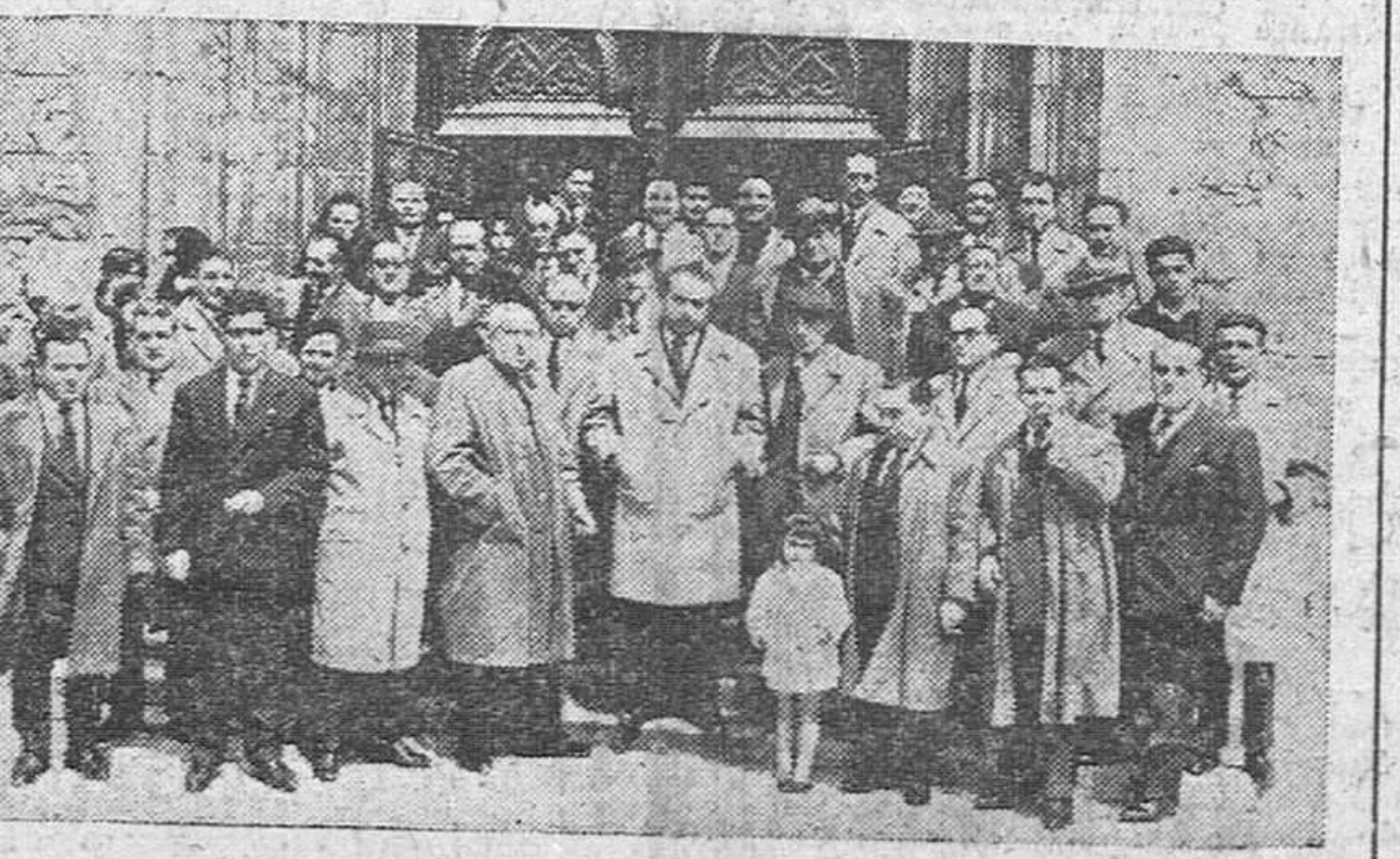
Aniversario de la "Peña Taurina" Autoridades, invitados y miembros de la "Peña Taurina" que asistieron el domingo a una misa celebrada en la iglesia de San Gil, en conmemoración del VIII aniversario de la fundación de la entidad tauromaca burgalesa.

INAUGURACION Sevilla.— Su Excelencia el Jefe del Estado—que en la mañana de hoy recibió en audiencia a todas las autoridades y representaciones oficiales de Sevilla—, visitó esta tarde el suburbio del Vacio, la nueva barriada de Torreblanca de los Caños, donde entregó 1.608 viviendas de tipo social y, en el Museo provincial de Bellas Artes, una exposición de ordenación urbana de la ciudad. El Caudillo salió a las cinco de la tarde de Sevilla, y, seguido en otros coches, por los ministros de la Gobernación, Obras Públicas, Vivienda y Agricultura. Atravesando la ciudad, se dirigió al suburbio del Vacio, donde de cuatro mil personas habitan 800 chovalos. El Caudillo fue recibido por las autoridades sevillanas y otras personalidades. Su Excelencia fue objeto de un cariñoso recibimiento. Poco más tarde, se dirigió a la nueva barriada de Torreblanca de los Caños, donde fue recibido por el Cardenal-arzobispo de Sevilla, ex-ministro don Luis Alarcón de la Lastra; los miem- (Pasa a cuarta página)