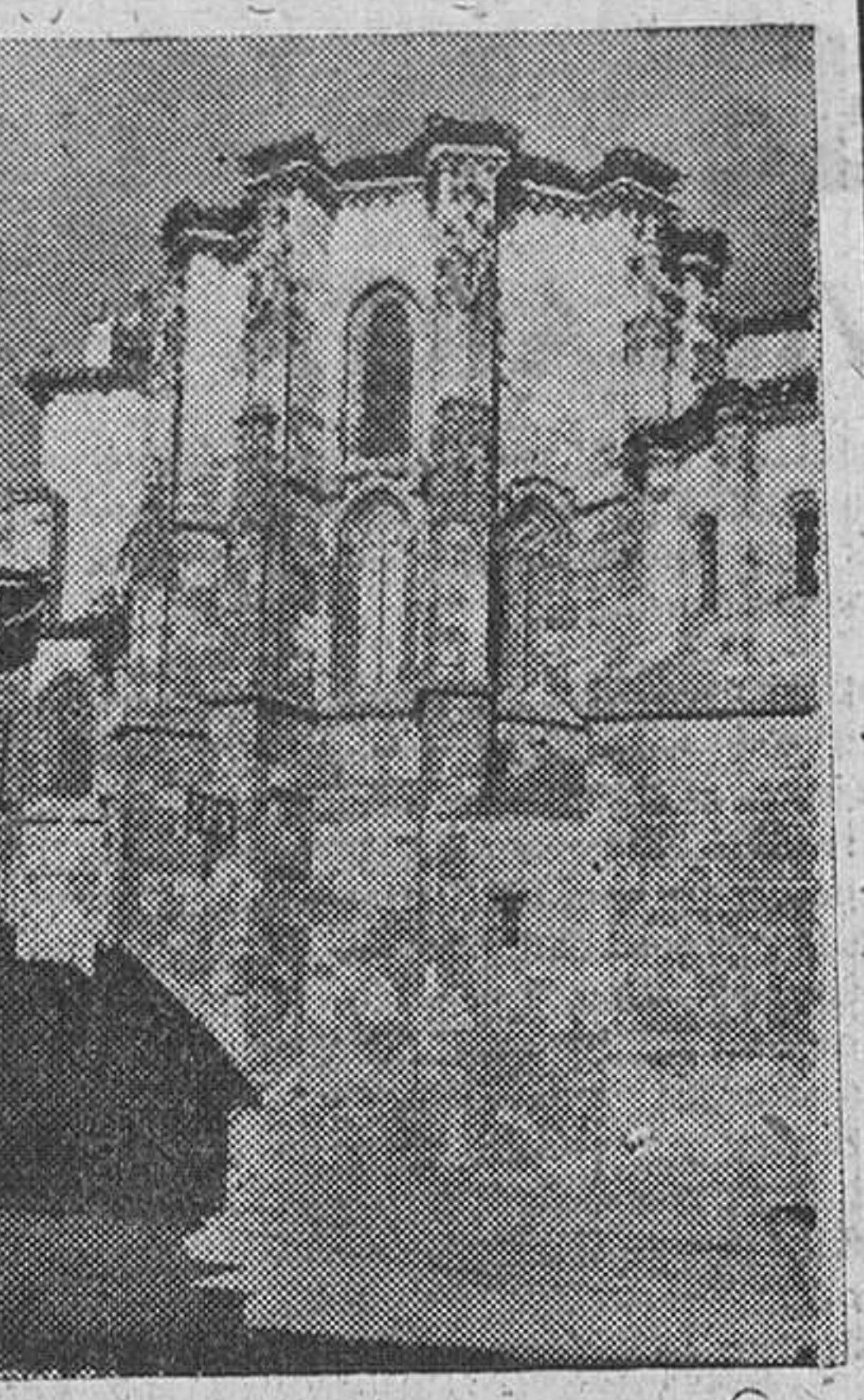
Detalle de un lateral del ábside de la histórica iglesia de Santa María de Aranda de Duero, declarada monumento nacional y en donde se cree que están enterrados antepasados del jefe del Gobierno portugués, Dr. Oliveira Salazar.

En la histórica iglesia de Santa María de Aranda se han descubierto unos sepulcros que parecen pertenecer a antepasados del ilustre jefe del Gobierno portugués