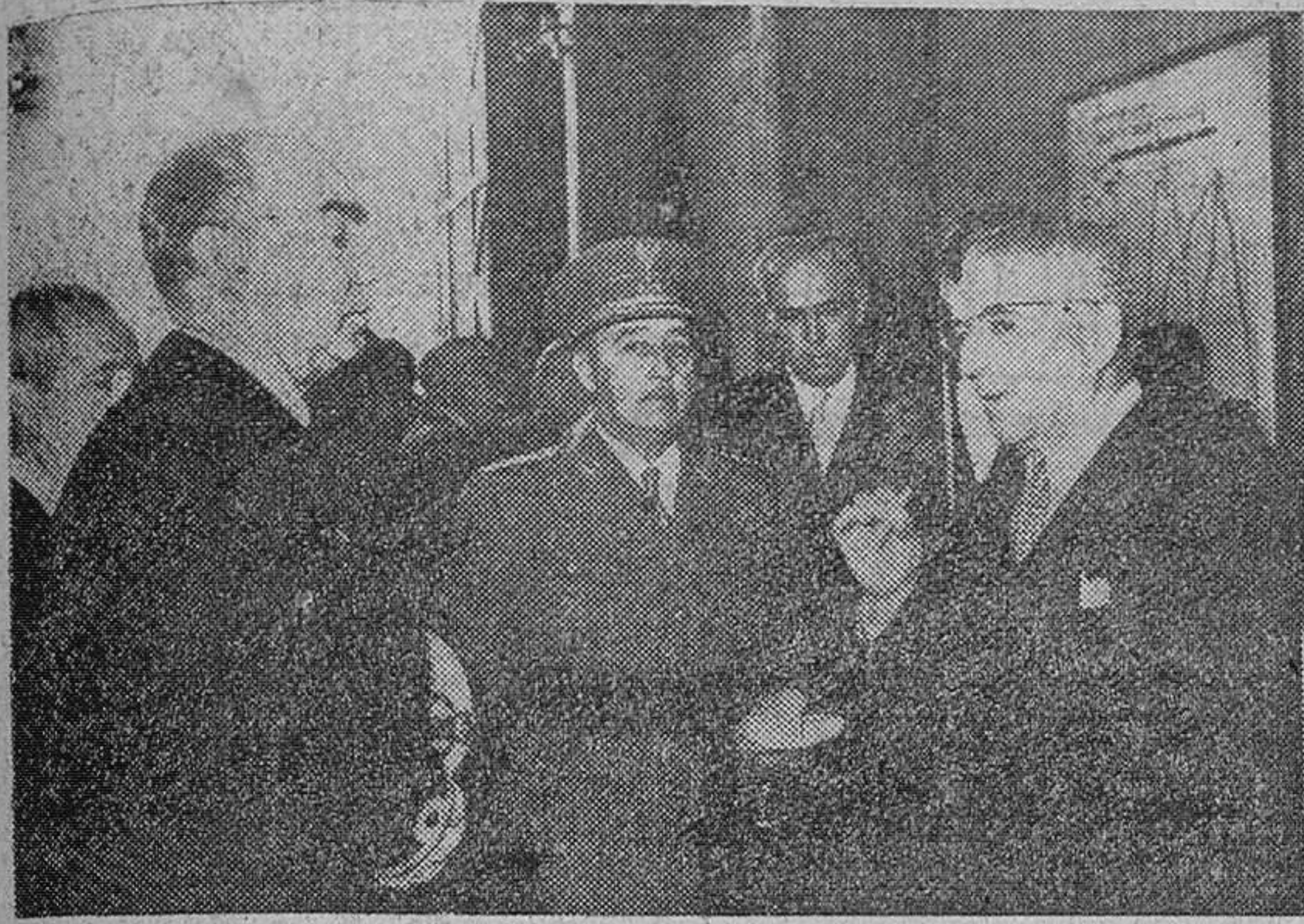
Palma de Mallorca.—Su Excelencia el Jefe del Estado, acompañado de ministros y autoridades y el presidente del I. N. I. señor Suñeces, durante su visita inaugural a la central térmica de Alcudia, construida por el Instituto Nacional de Industria para resolver el problema de la escasez de energía eléctrica en la isla.

El Ayuntamiento de la Ciudad Condal entrega al Caudillo la medalla del Centenario del "plan Cerdá" de ensanche