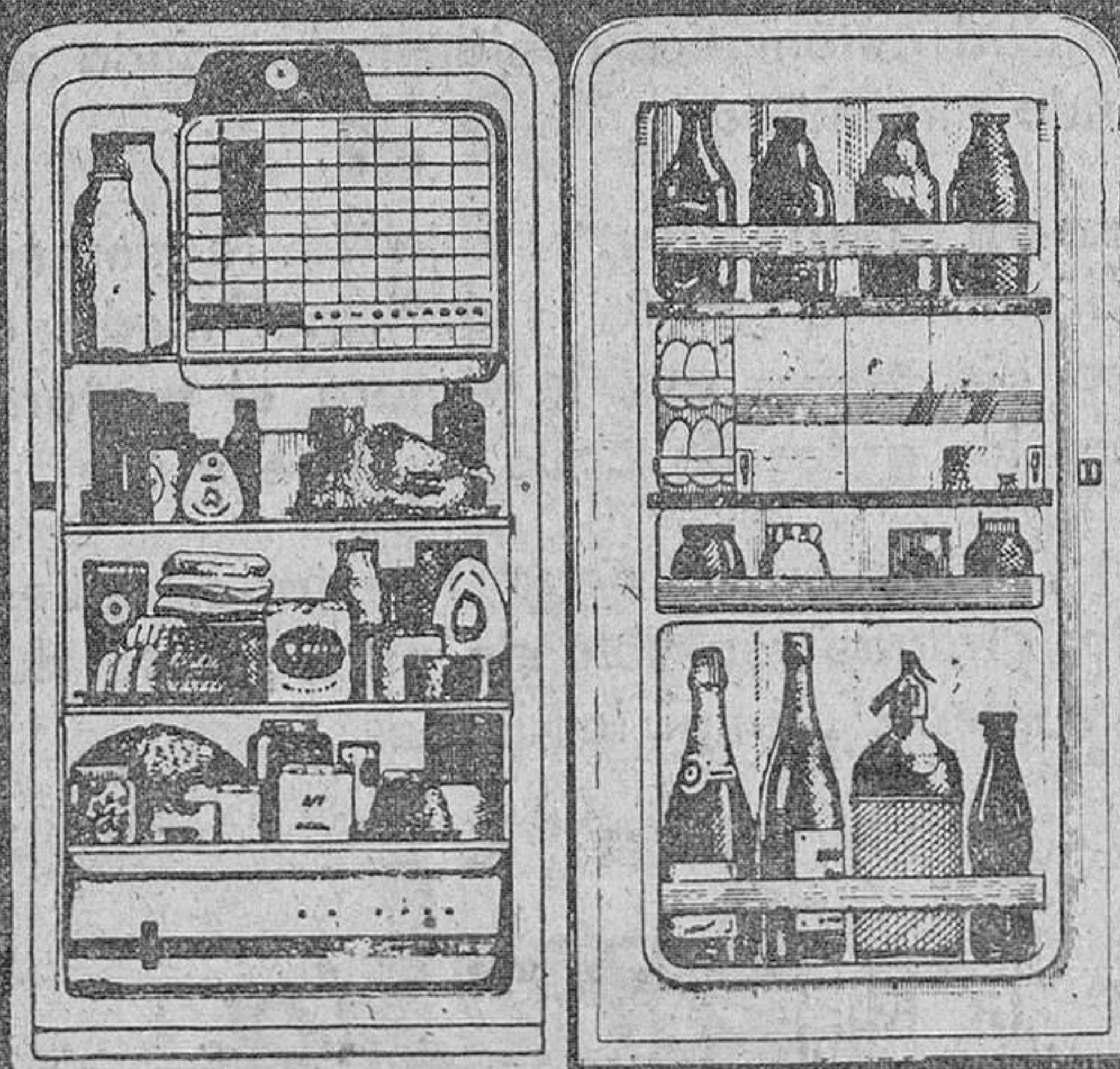
Modelo 177 litros de capacidad útil de almacenaje

Ud. podrá conservar los alimentos con toda su frescura y valor nutritivo.