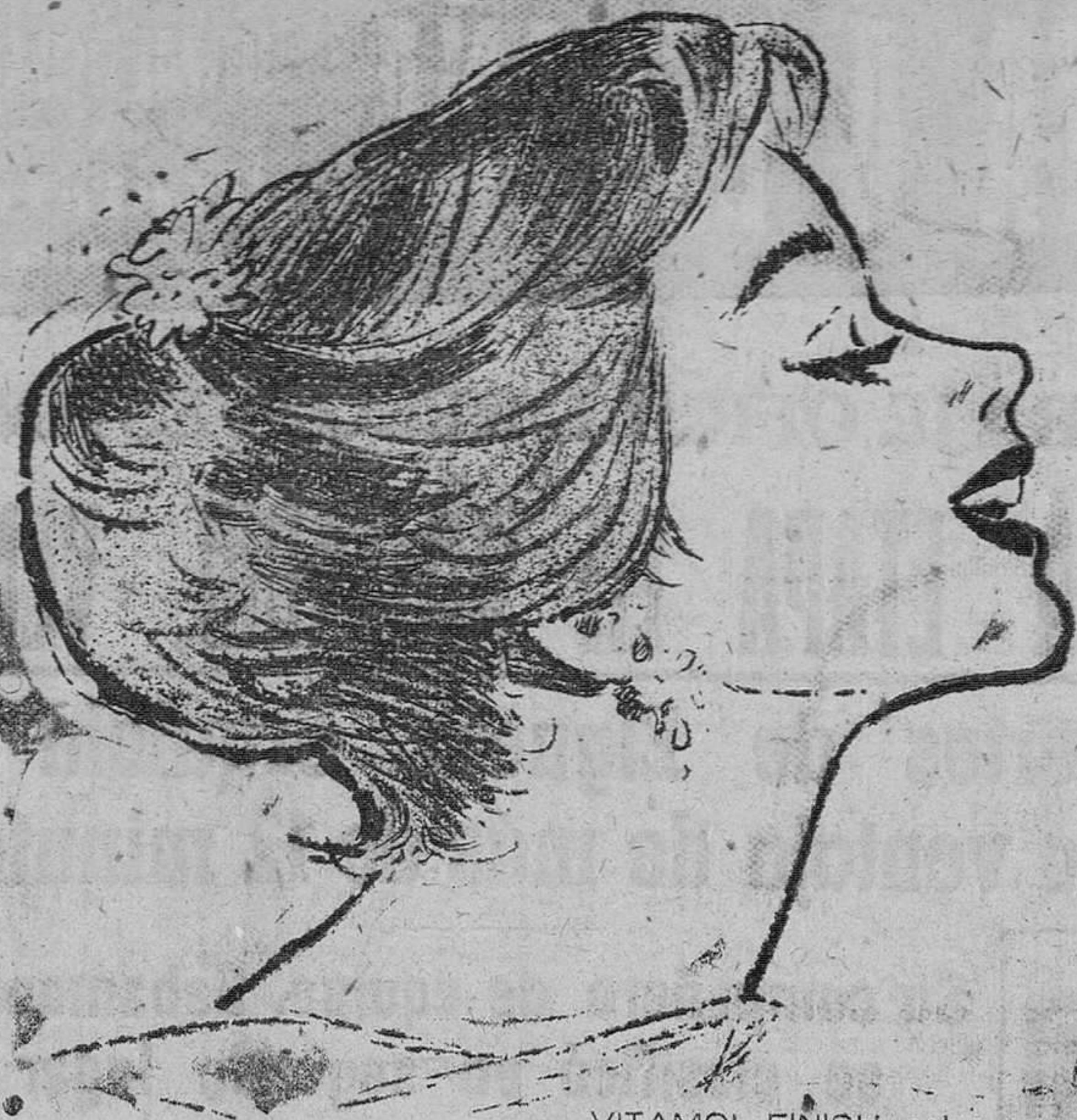
VITAMOL FINISH, polvo cremoso de finura y adherencia inigualables, forma sobre la piel una capa tenue y ligerísima, pero de gran poder cubriente, que tapa todas las pequeñas imperfecciones y da a la tez una tonalidad uniforme, deliciosamente mate y aterciopelada.

Selecto y modernísimo surtido TALLERES GRAFICOS «Diario de Burgos» Vitoria, 13 - Teléfono 2852