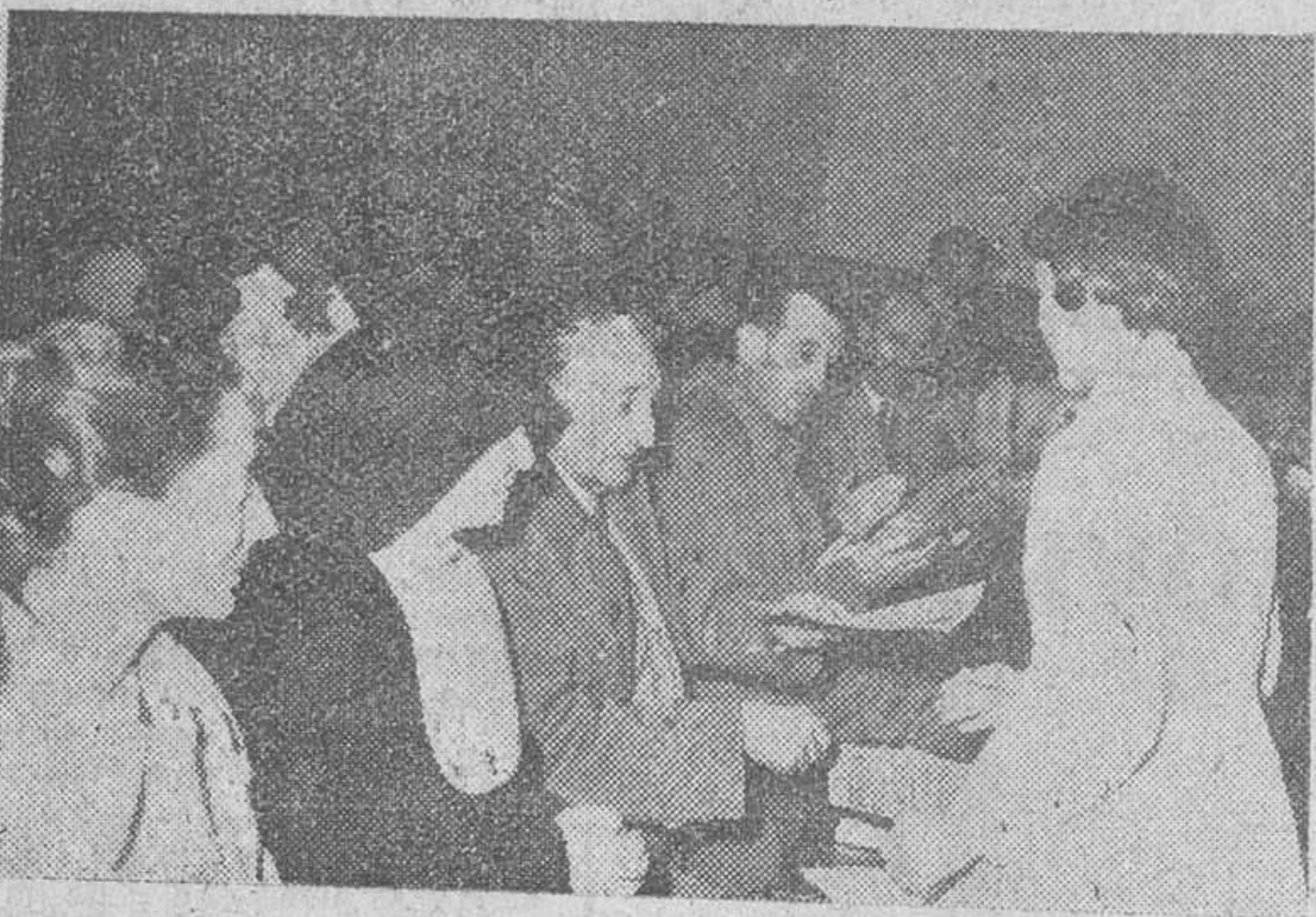
Un momento de la entrega de certificados de Estudios Primarios a las alumnas de las Escuelas Profesionales Femeninas de la Caja de Ahorros Municipal, que han terminado sus estudios.

Su Consejo de Gobierno giró una detenida visita oficial a las Escuelas Profesionales Femeninas de la barriada «Yaguë» donde tuvo lugar una gratisima velada inaugural del curso