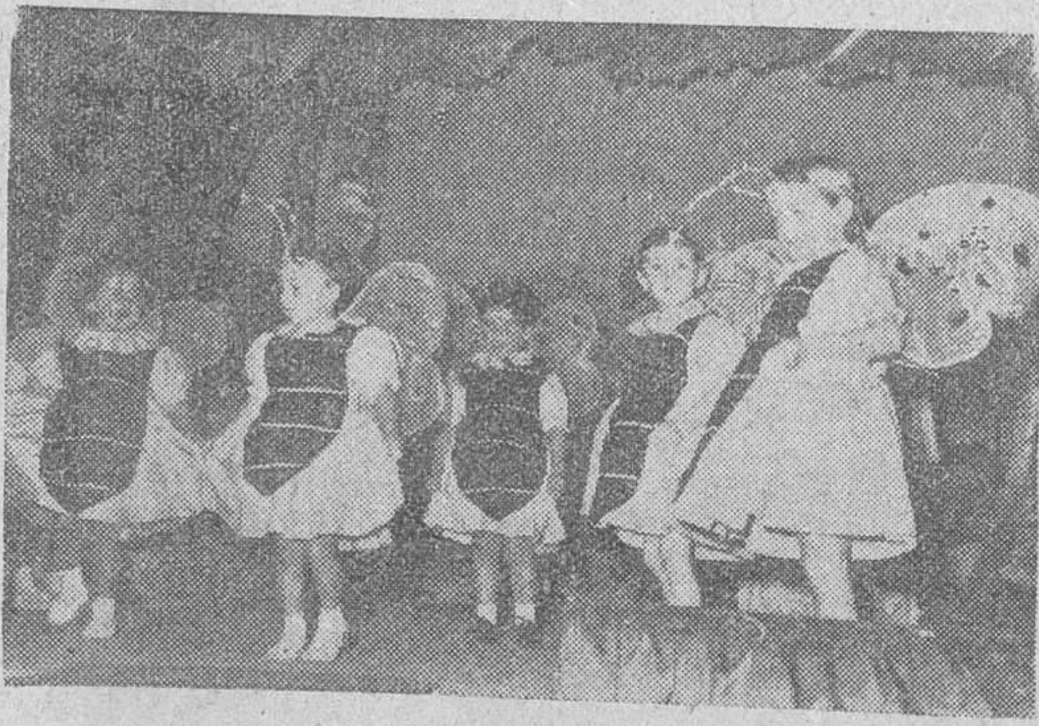
Grupo de niñas que intervinieron en la velada, interpretando una de sus simpáticas danzas.

giendo a una sólida vida espiritual, cultural y física, adquiriendo una excelente formación que las pone en las mejores condiciones para obtener el certificado de Estudios Primarios, o abrirles el camino para una cultura superior, a tal punto que muchas de ellas han podido realizar el ingreso en el Bachillerato con inmejorables calificaciones. De otro lado, las niñas, y jóvenes que acuden a las clases de bordado y punto, se capacitan magníficamente para el ejercicio de labores muy remuneradoras, como lo prueba el hecho de que entre estas jóvenes se ha repartido este año la cifra de 97.143 pesetas, por los trabajos realizados. Asimismo, las clases nocturnas se han visto muy concurridas du-