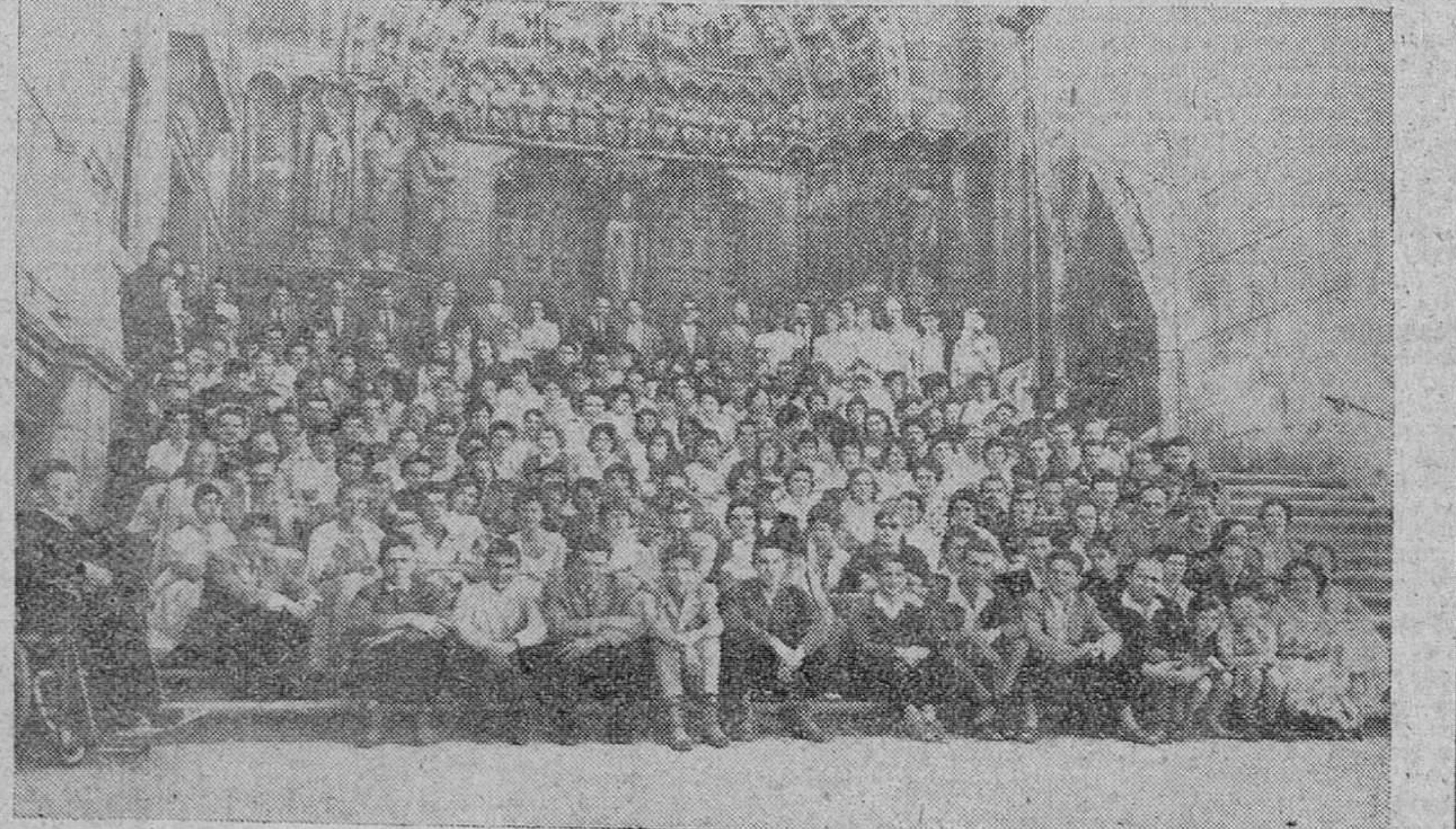
Como todos los años, en el actual han efectuado una visita a nuestro Templo catedralicio, los alumnos de los Cursos de Verano para Extranjeros. A la salida de la Catedral, posaron para DIARIO DE BURGOS.