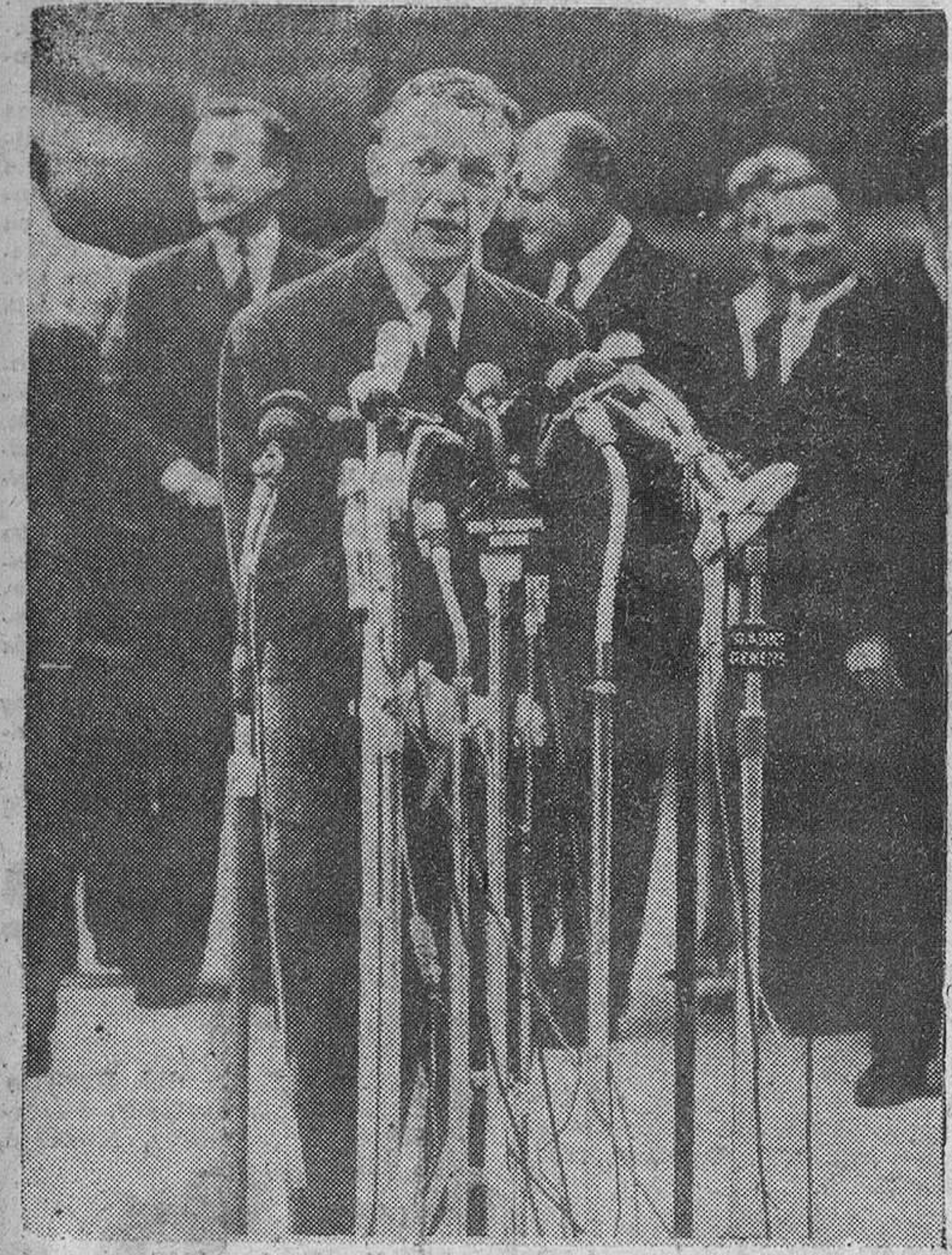
Ginebra.— El ministro de Asuntos Exteriores de Francia, Couve de Murville, a su llegada al aeropuerto de esta ciudad para asistir a la Conferencia de ministros de Asuntos Exteriores que dará comienzo hoy.

Se oponen los occidentales alegando idénticos derechos para otros países y Alemania occidental insinúa un recuerdo a la agresión soviética a Polonia