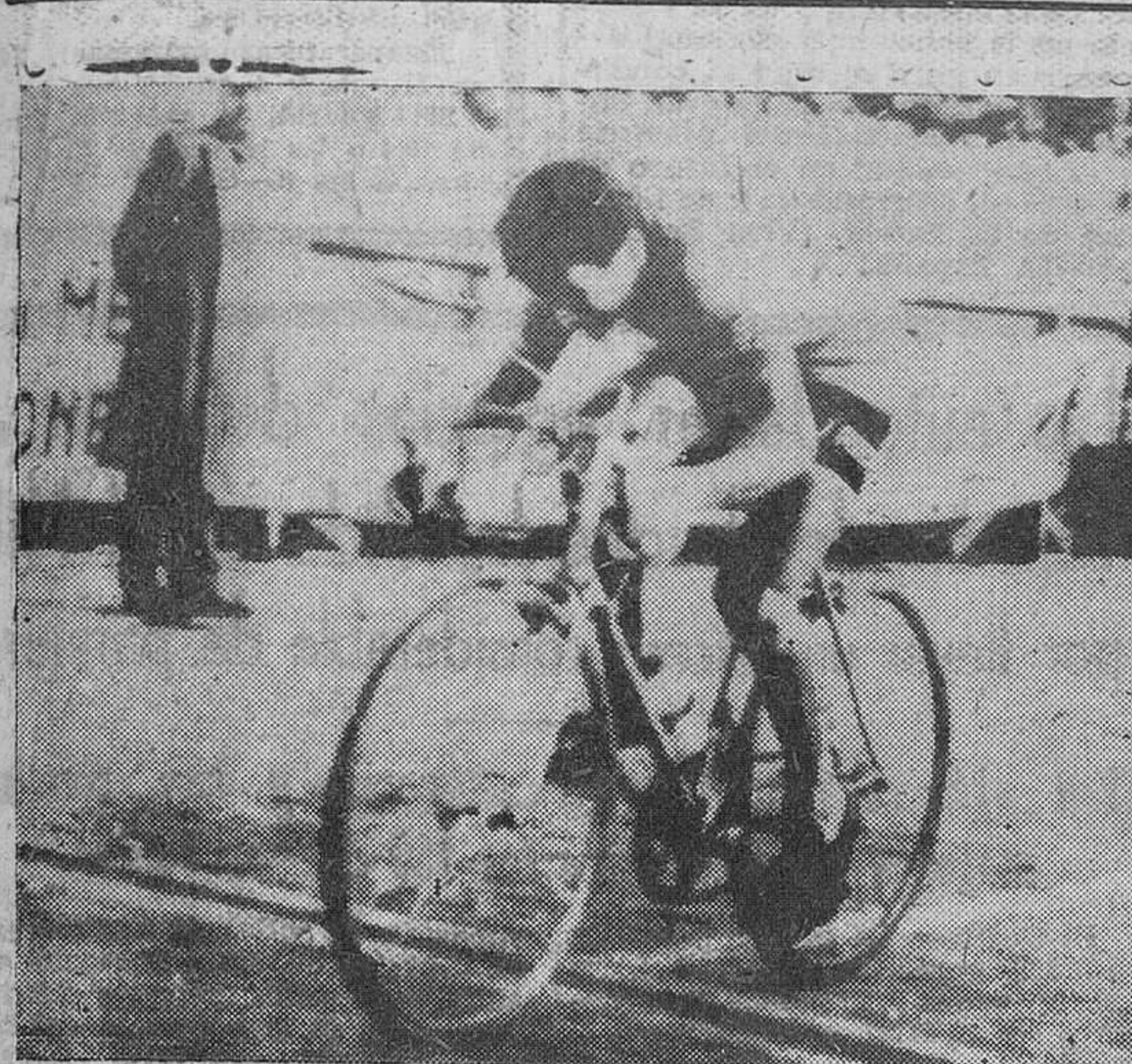
Santander. — El español San Emeterio cruza victorioso la meta en la decimoquinta etapa de la Vuelta Ciclista a España.

En el mismo tiempo que él se clasificaron Everaert, Galdeano y Busto, con los que escapó al pasar por Villasana de Mena, en nuestra provincia