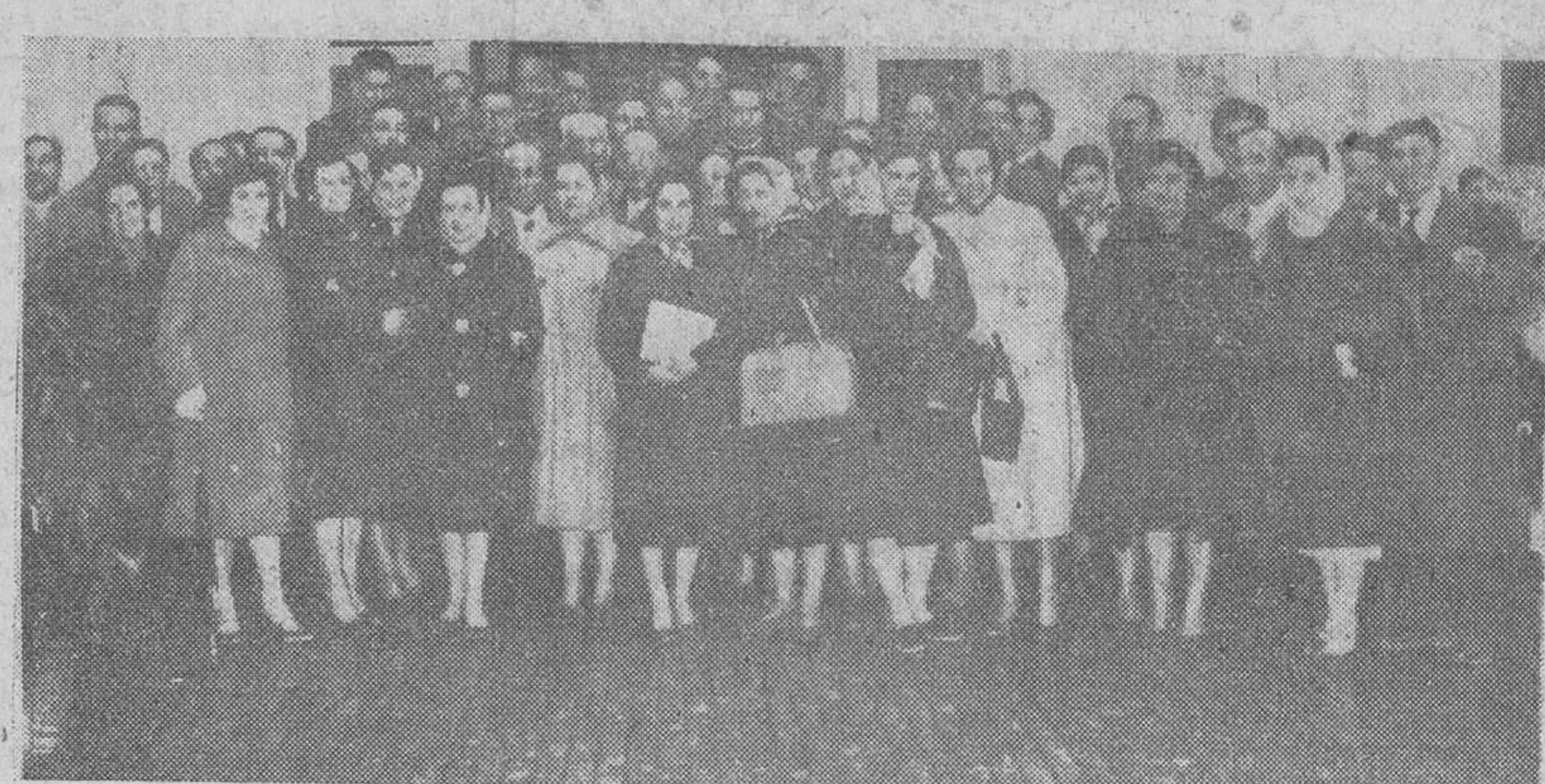
Grupo de Sacerdotes y Maestros del partido judicial de Miranda de Ebro, que ayer visitaron la Escuela de Agricultura establecida en Saldañuela. Ellos, dirigentes sociales de primer orden, pregonarán el esfuerzo de la CAJA DE AHORROS MUNICIPAL por mejorar el agro y la ganadería burgaleses.