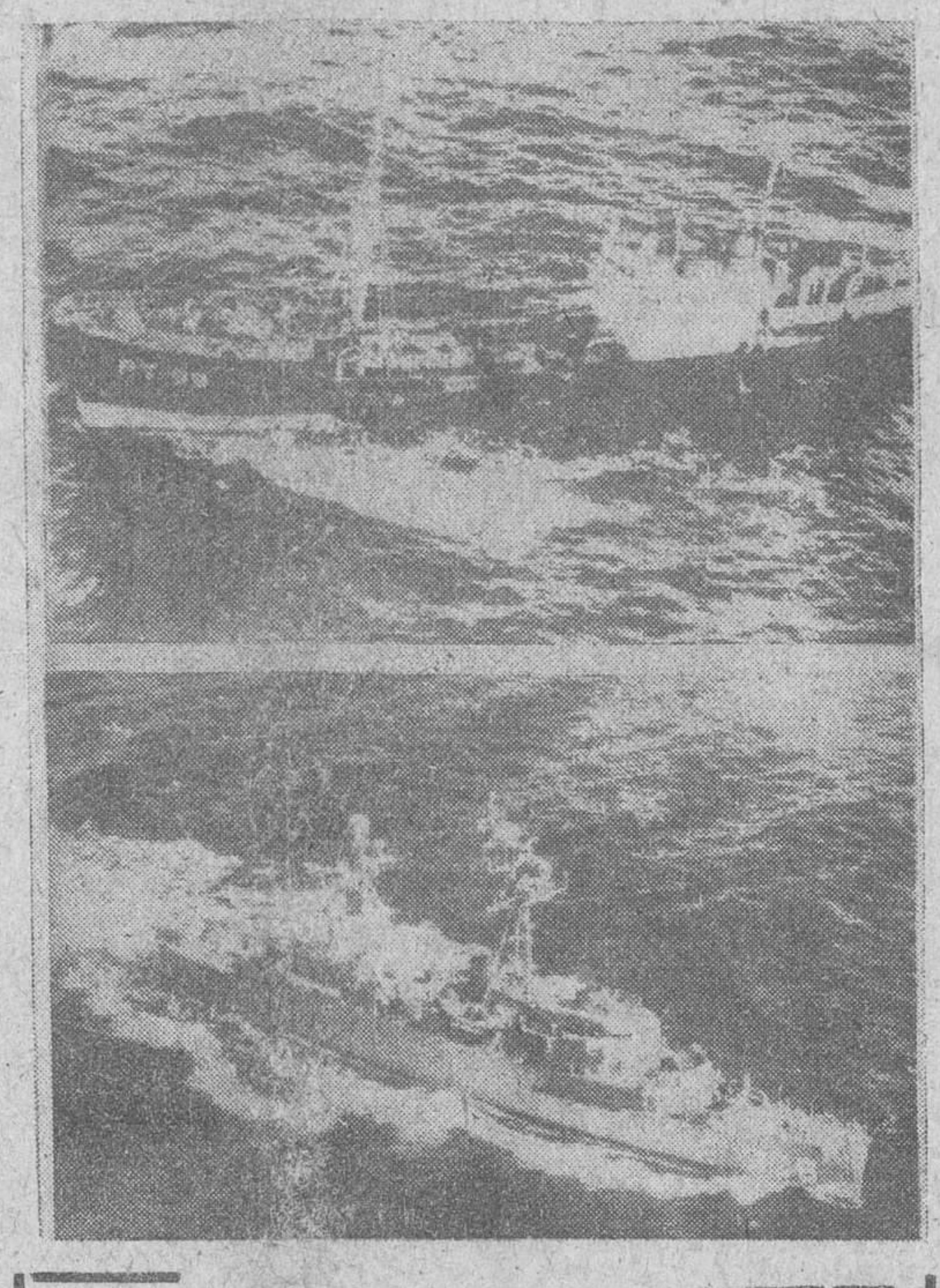
En la parte superior, el barco pesquero soviético «Hovrossirak», detenido en alta mar a 120 millas de San Juan de Terranova por el destructor norteamericano «Roy Hale», cuya ruta era la misma que la de los lugares donde aparecieron destruidos cinco cables del servicio transatlántico.