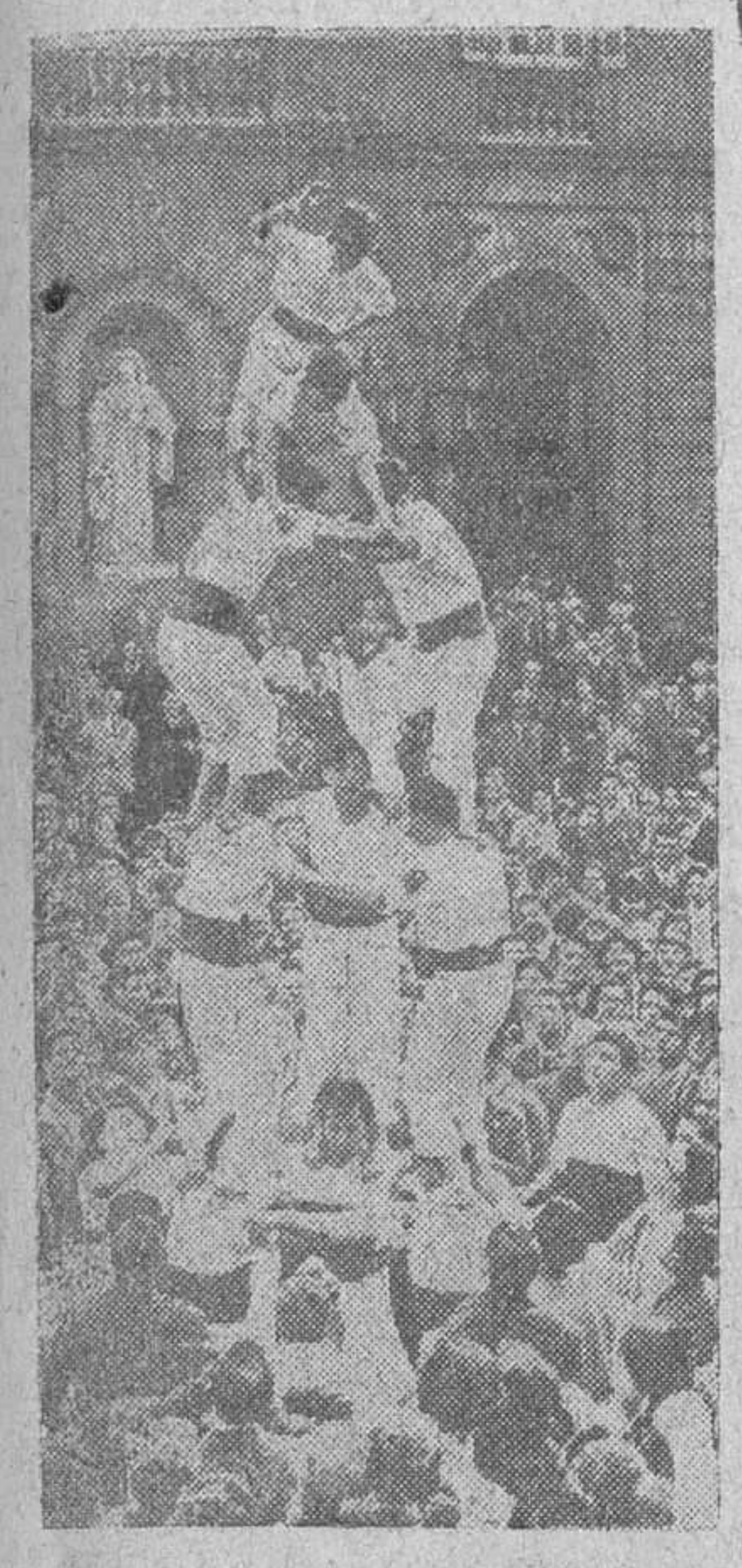
Barcelona. — En la plaza de San Jaime, frente a los palacios del Ayuntamiento y la Diputación, han actuado por vez primera en público el Cuerpo de «Castellers» de esta ciudad, quienes levantaron arriesgadas torres humanas muy celebradas por la multitud que llenaba la plaza.

Fiesta folklórica en la Plaza de San Jaime de Barcelona