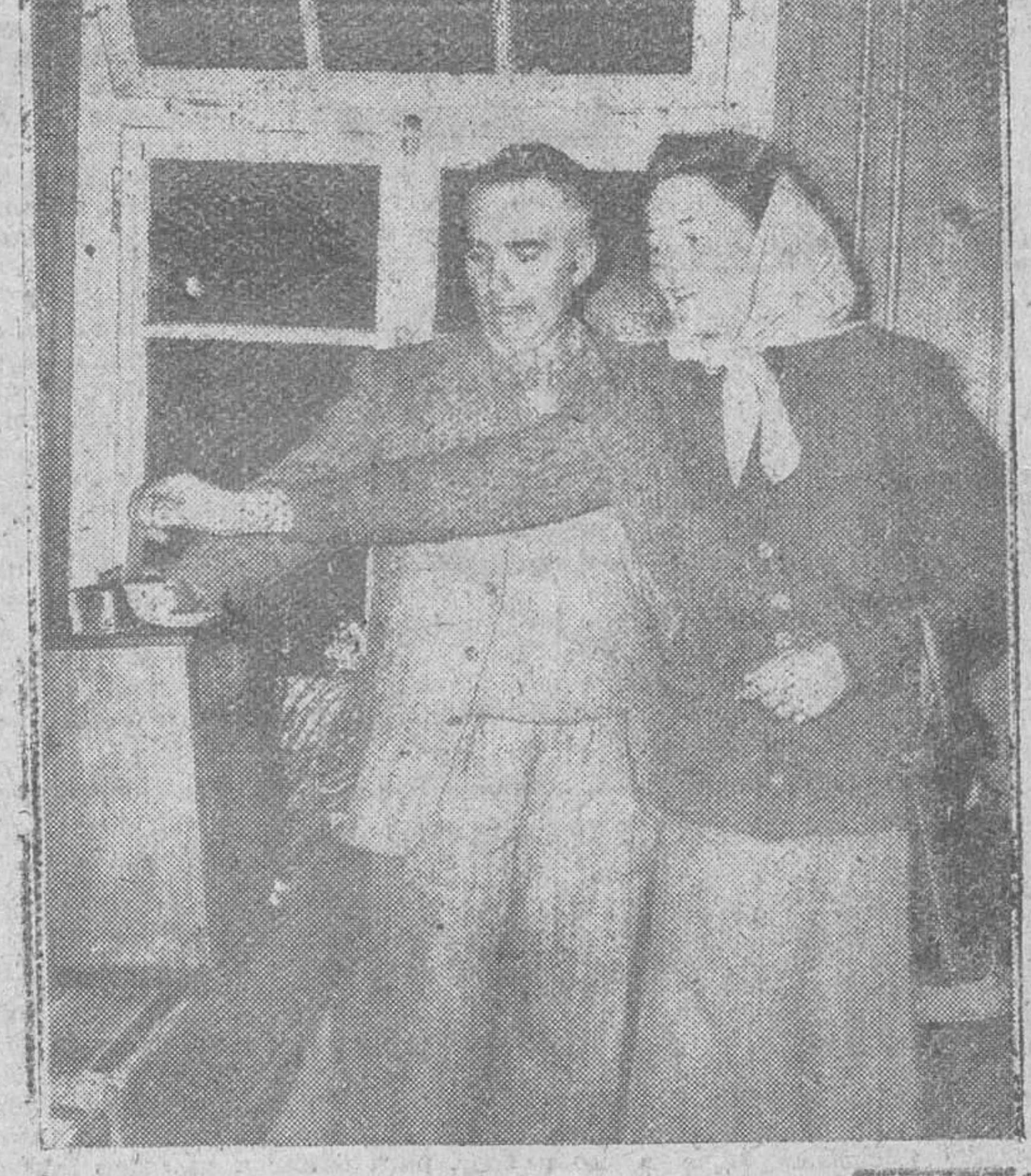
Lausana. — Por una considerable mayoría los electores suizos han denegado el derecho de voto a las mujeres del país. La presente foto se refiere a las elecciones en el cantón de Unterwalden, hace dos años, cuando dicha comunidad había organizado a título consultivo una votación femenina.