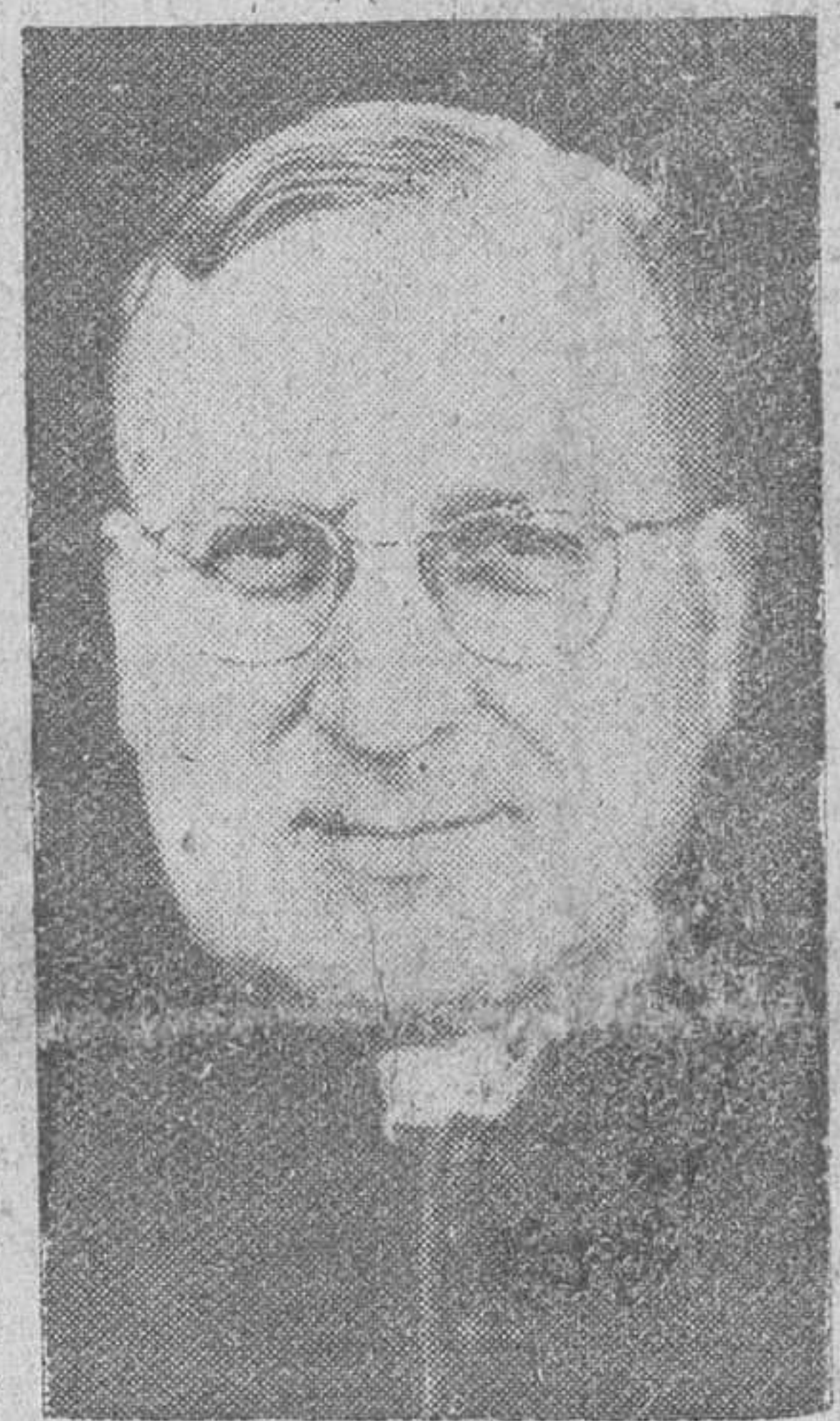
El Excmo. Sr. Don Manuel Fernández Conde, adscrito a la Secretaría de Estado del Vaticano, que ha sido nombrado para ocupar la sede obispal de Córdoba.