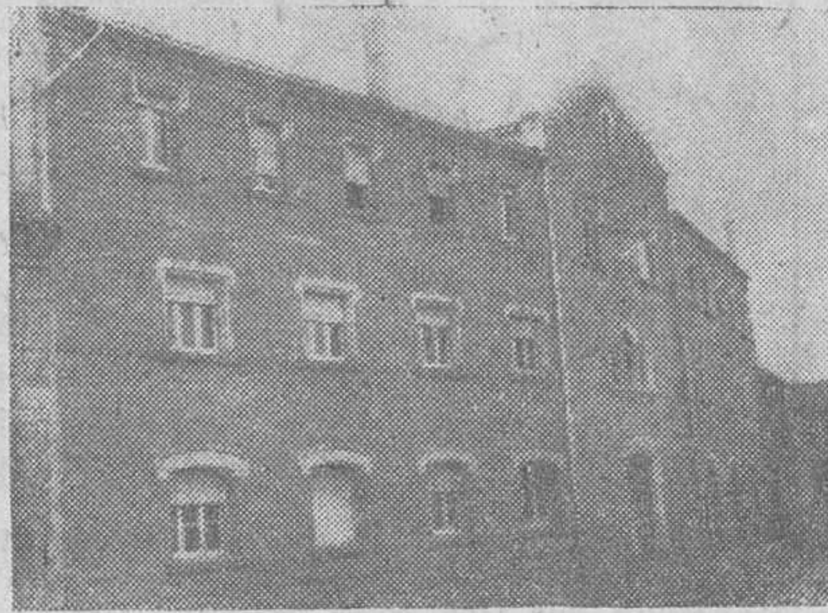
PARTE NUEVA DEL COLEGIO DE LA INMACULADA