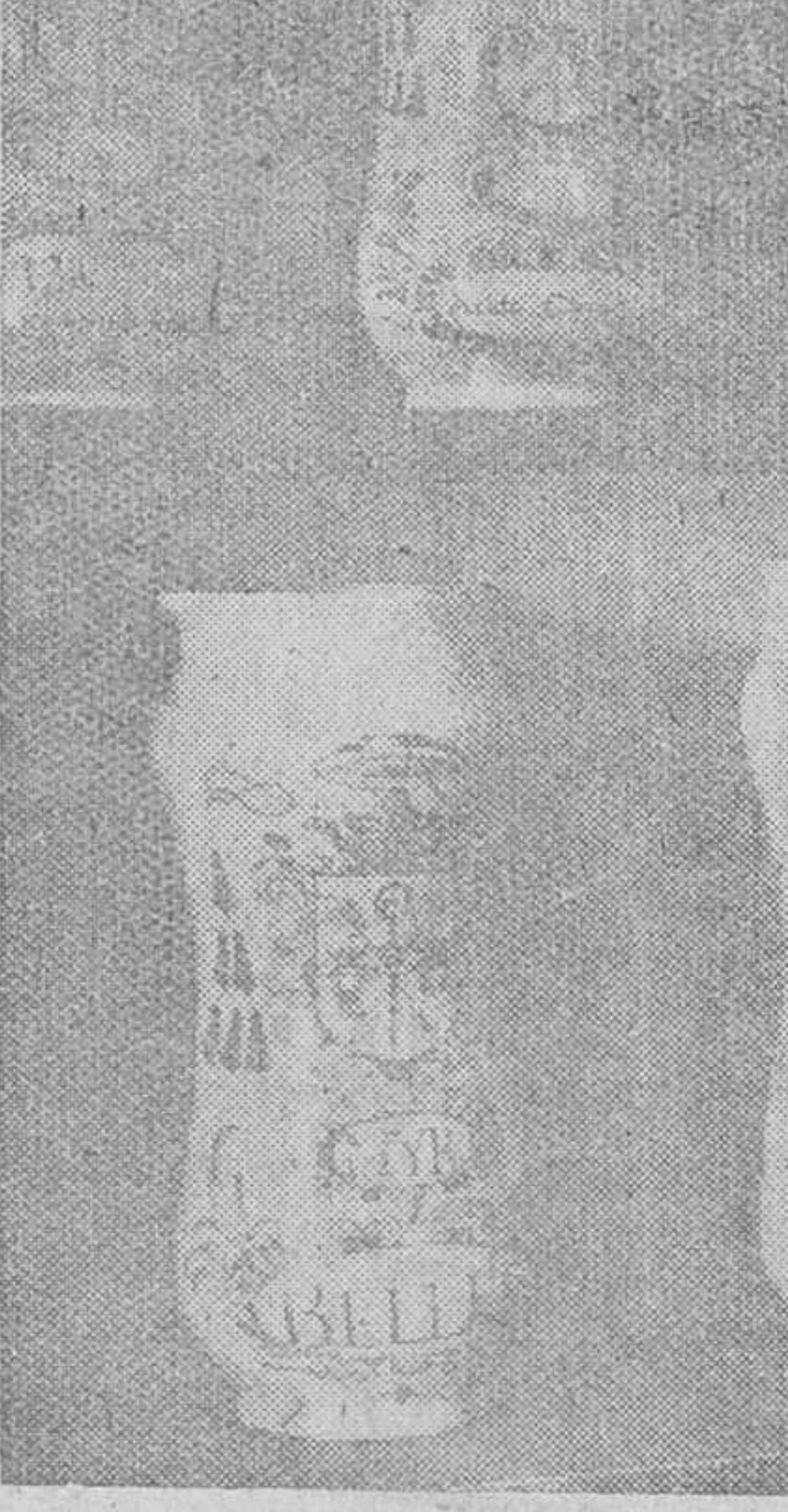
Los viejos tarros talaveranos, de venerable antigüedad, prestigiados por haber cumplido su noble misión, son ahora en la Botica de Silos, piezas de Museo cerámico de indudable valor. Los albarelos aún conservan, como puede verse en la presente fotografía, los rótulos primitivos, colocados debajo del escudo monástico.