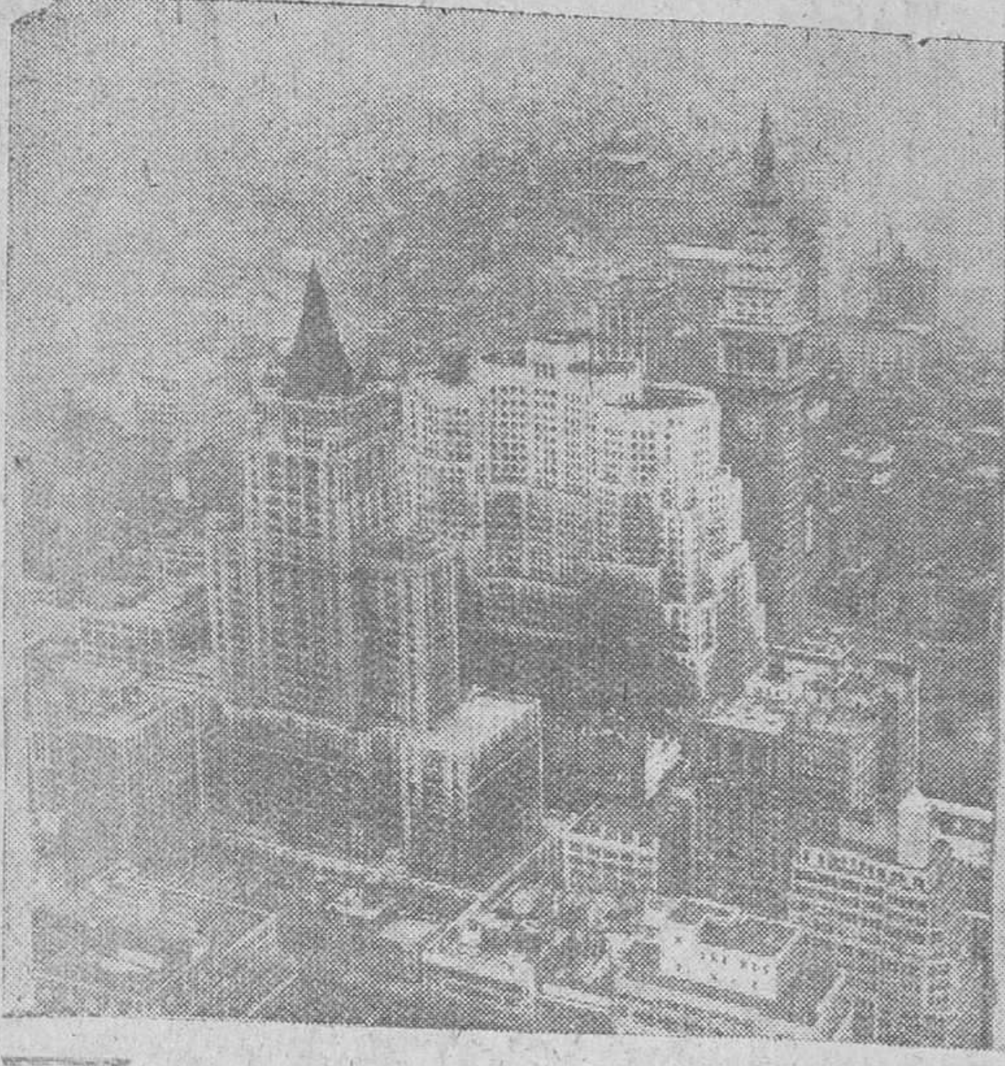
Lo que nuestra foto les ofrece es un aspecto del barrio neoyorquino de Manhattan, tomado no desde un avión, como a primera vista pudiera suponerse, sino desde la torre del Empire State Building, el edificio más alto del Mundo.