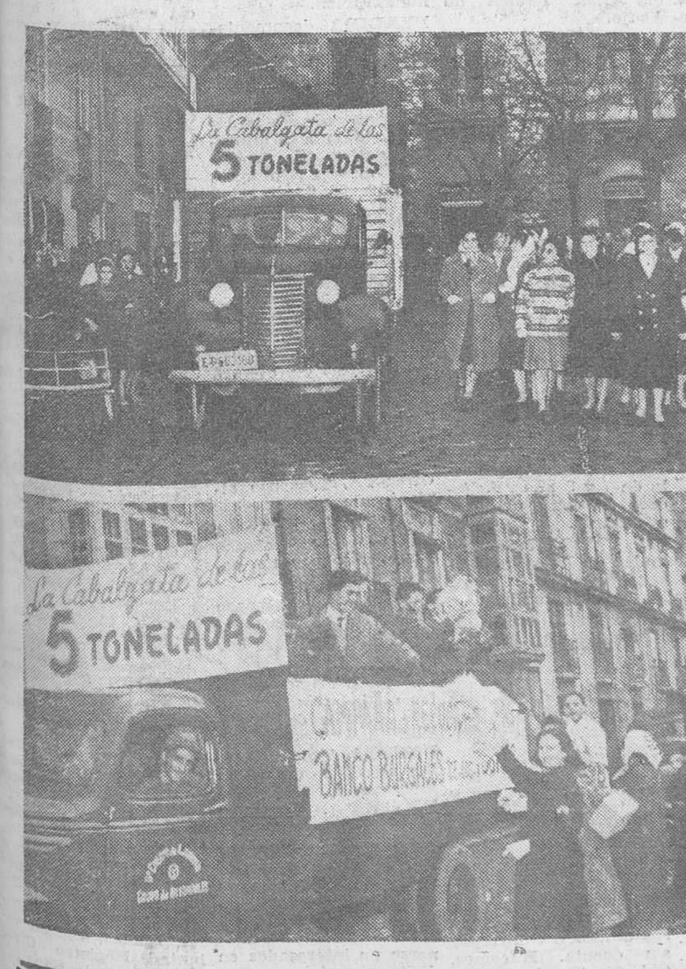
Dos momentos de la recogida popular de ropas y donativos que ayer tarde se hizo por diversas calles de nuestra ciudad, organizada por el "Banco Burgales de los Pobres" bajo el nombre de "La Cabalgata de las cinco toneladas" y que obtuvo un rotundo éxito.

Ya en el nuevo edificio, el Prelado de la diócesis, Dr. D. Abilio del Campo, revestido de pontifical, bendijo las instalaciones. Luego, el ministro y séquito se trasladaron a la estación de autobuses, para proceder a su inauguración. Después de bendecida por el obispo, el general Vigón recorrió las instalaciones del nuevo edificio.