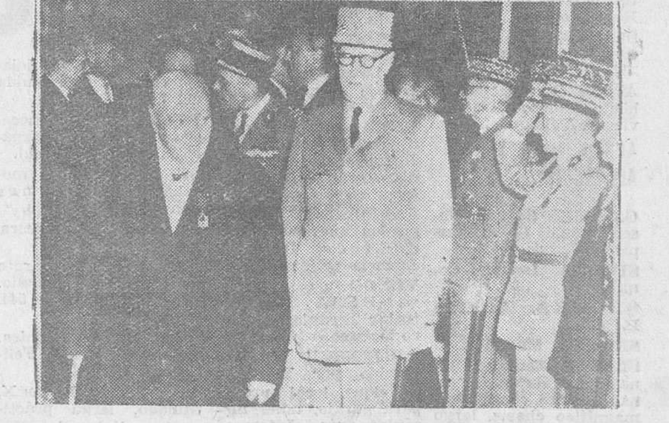
Paris. — El ex-premier británico, Winston Churchill, acompañado del general De Gaulle, momentos después de haber sido impuesta la Cruz de la Orden de la Liberación, en la solemne ceremonia celebrada en el Hotel Matignon por el primer ministro francés.