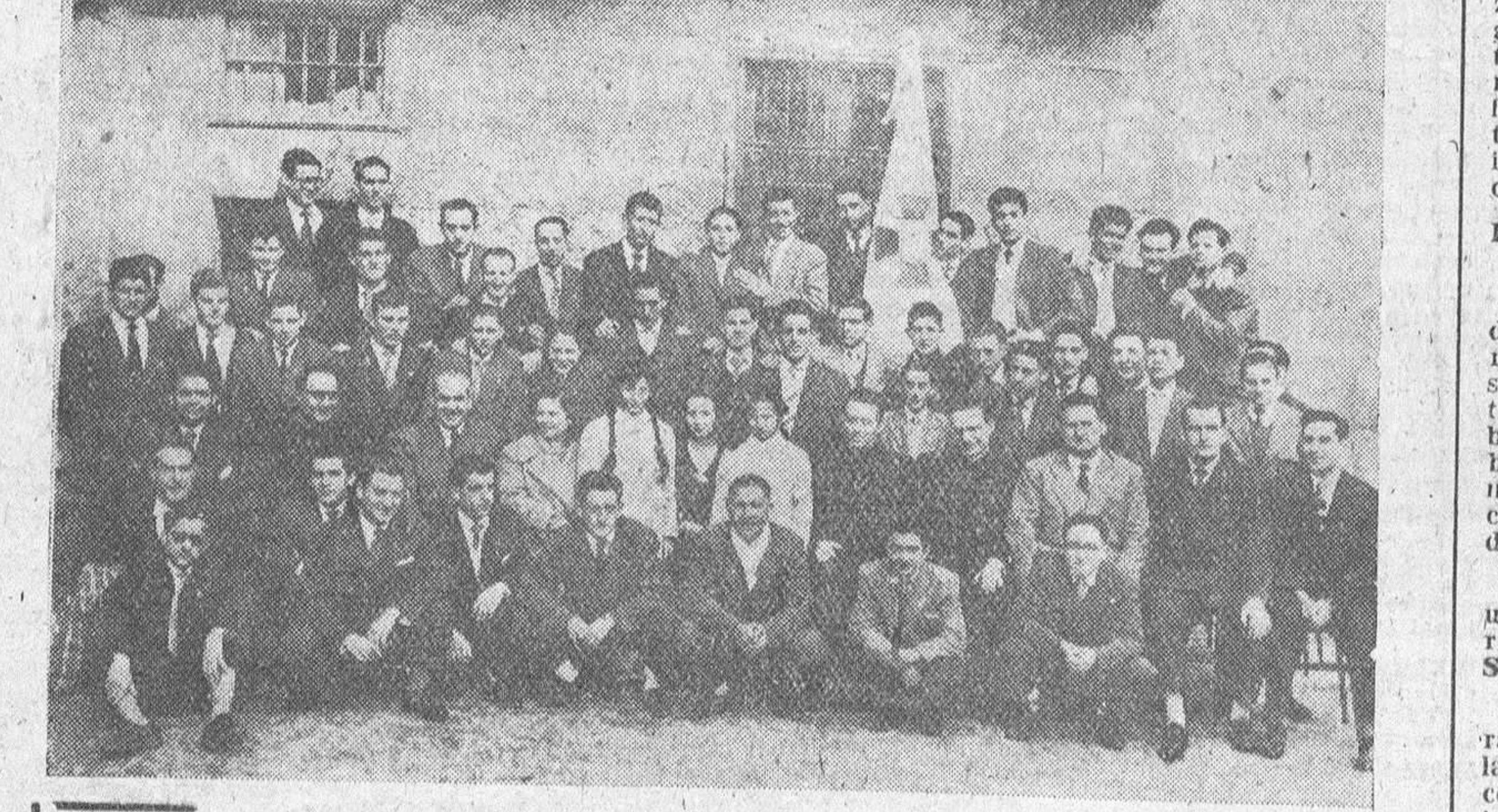
Solemnemente tuvo lugar el domingo en Burgos la ceremonia de bendición de la bandera de los Jóvenes de Acción Católica pertenecientes al Centro parroquial de San Lesmes, Abadesanos, presidiendo el grupo de jóvenes miembros de dicho Centro.

Un agricultor de 150 años vive en la Unión Soviética