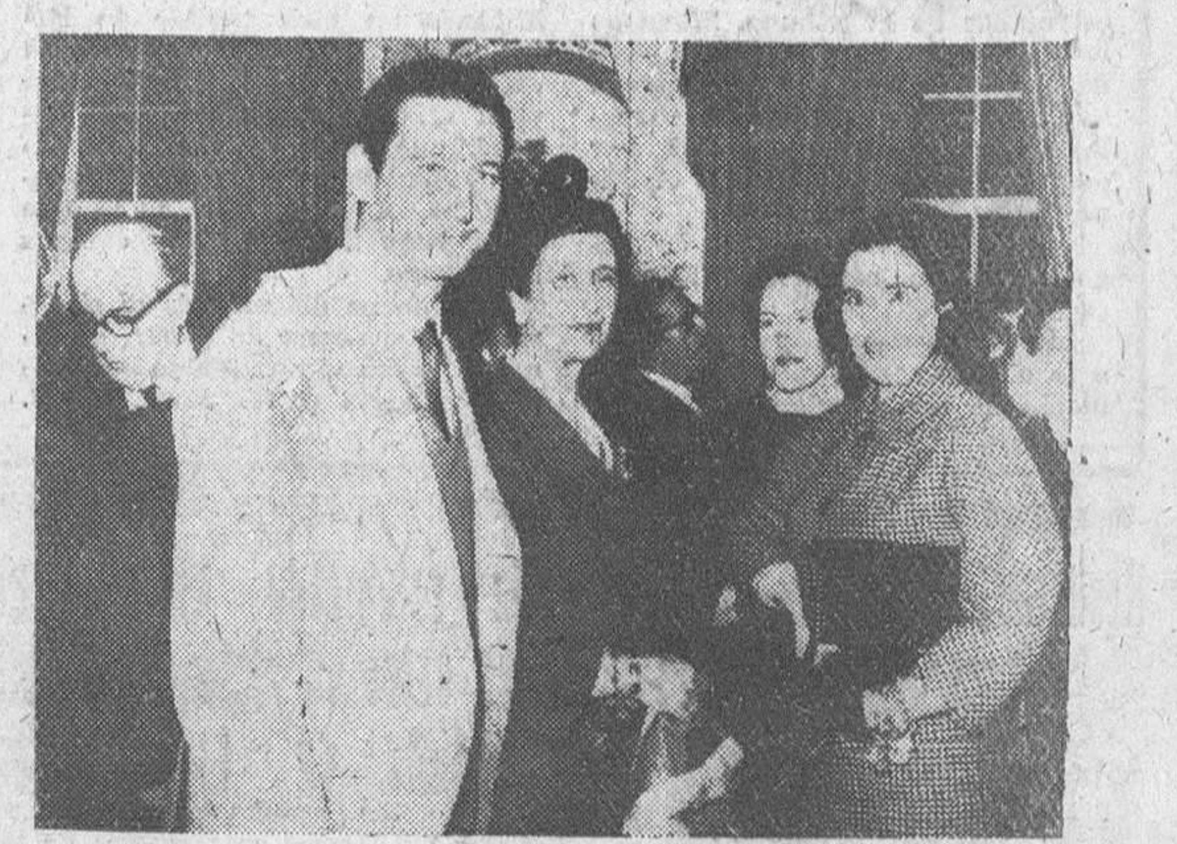
Lisboa.—La esposa de Su Excelencia el Jefe del Estado español, doña Carmen Polo de Franco y sus hijos, los marqueses de Villaverde, durante la recepción celebrada en su honor en el Palacio de Setais, a su llegada en viaje privado, invitada por el Gobierno portugués para pasar una temporada en la isla de Madeira.

Hace diecinueve años que Portugal y España firmaron el "Pacto Ibérico"