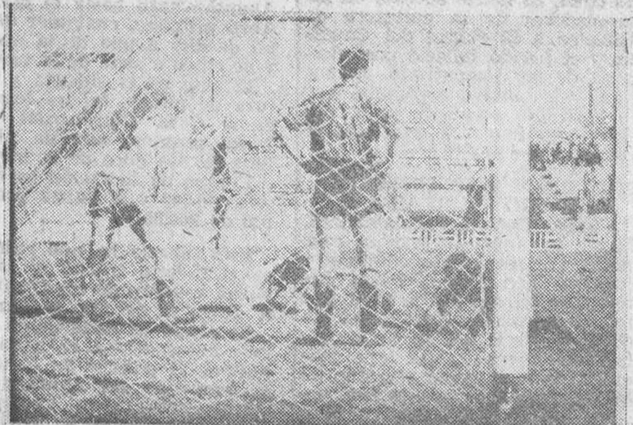
En la parte superior, el equipo del Burgos que formó el dominio en el estadio municipal de Valladolid, frente al Europa-Delicias. En el grabado inferior, los instantes que sucedieron a la consecución del primer gol del equipo vallisoletano.