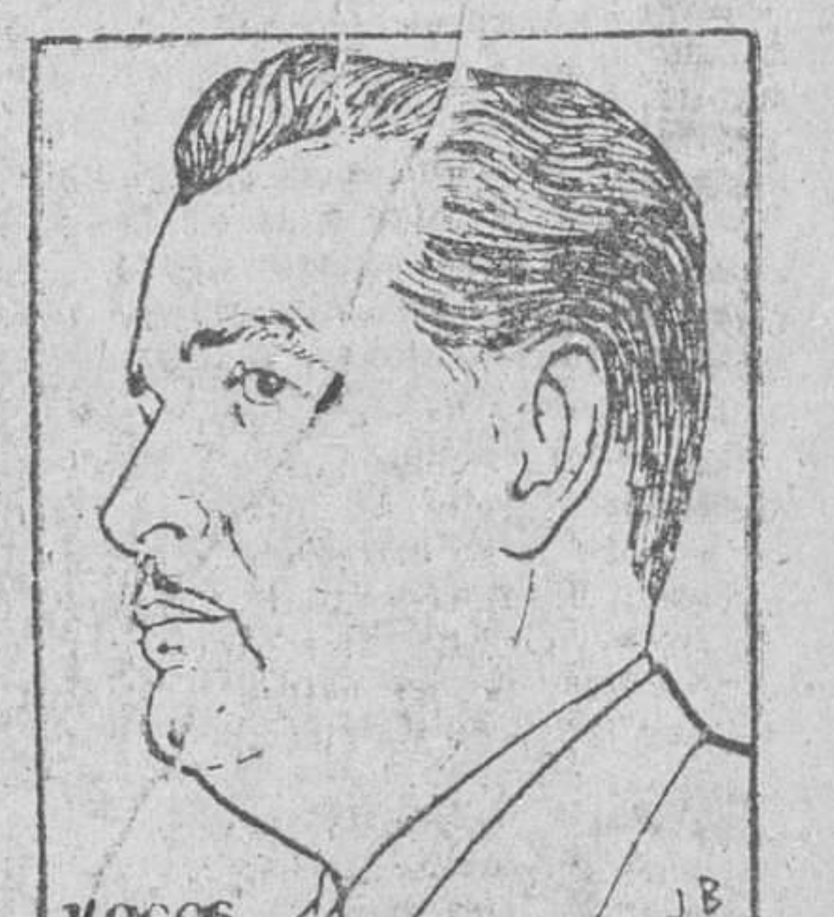
RANIERO III DE MONACO