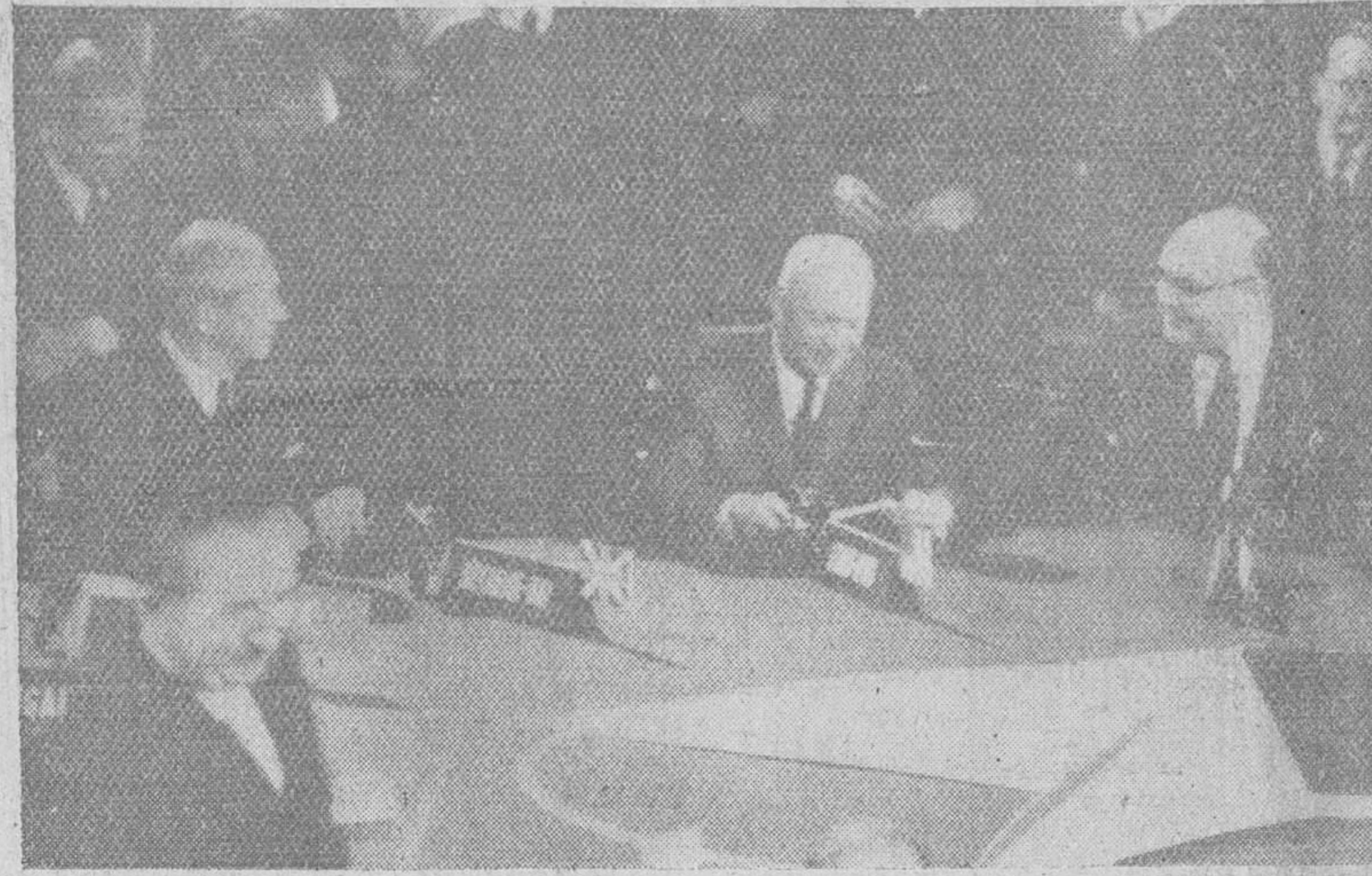
Paris.—Una vista del salón de sesiones del Palacio Chaillot, durante la reunión inaugural de la Conferencia de la O.T.A.N. De izquierda a derecha el primer ministro británico Mac Millan; el presidente Eisenhower de los Estados Unidos; y Paul Henri Spaak, secretario general de la O.T.A.N.