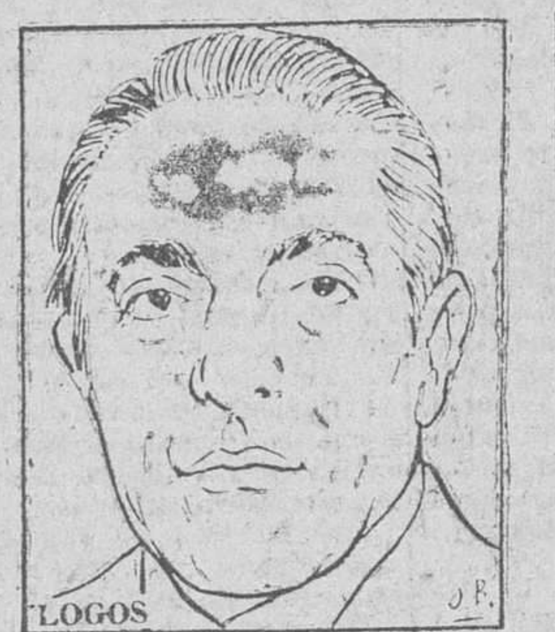
ARISTOTELES S. ONASSIS

El fabuloso multimillonario griego amenaza con abrir un gran casino internacional en Corfú, a fin de acabar la hegemonía de Montecarlo