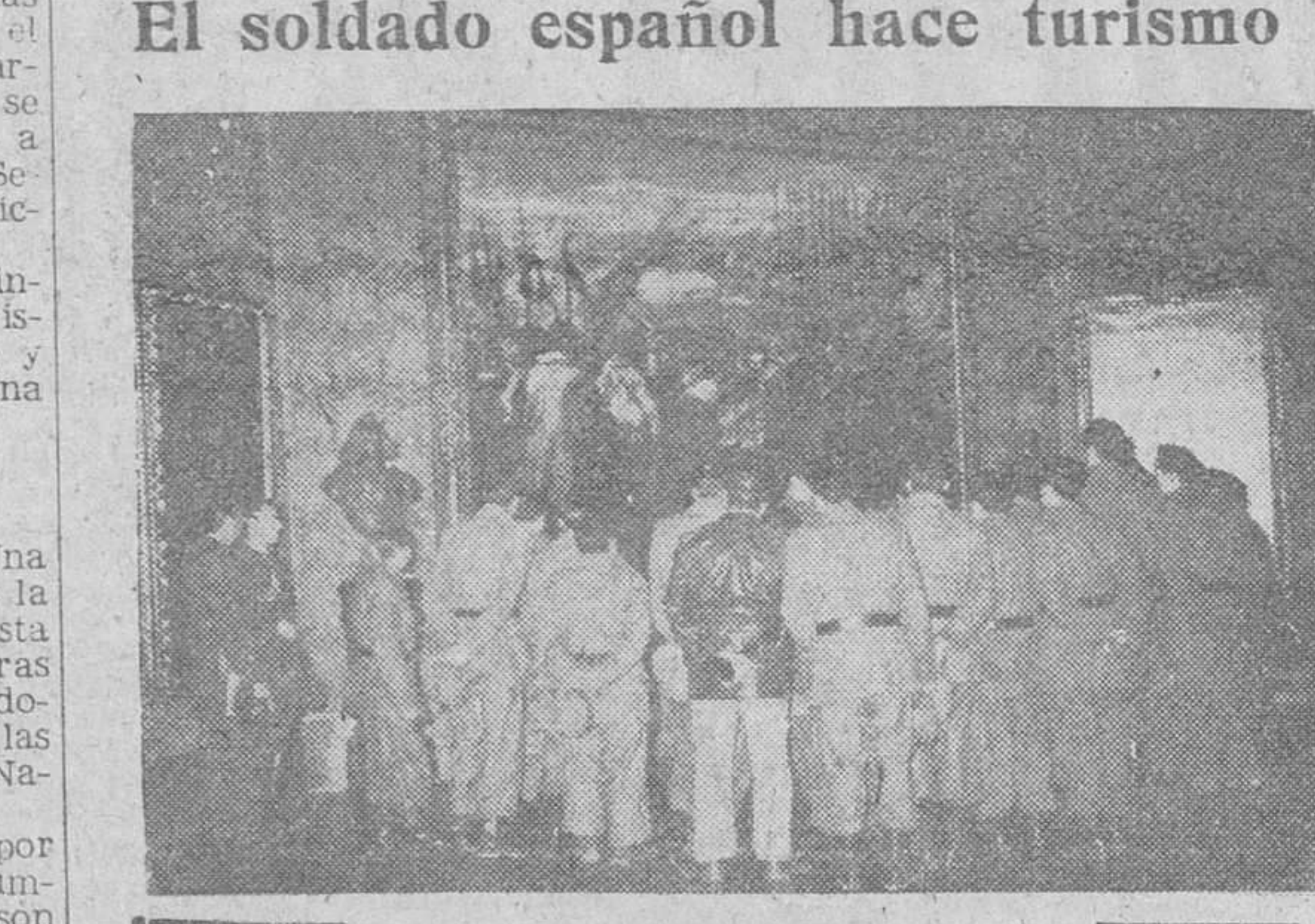
Madrid. — Grupo de soldados de distintas guarniciones de la I Región visitan la capital de España con objeto de conocer los distintos museos, fábricas, centros de trabajo, espectáculos, etc. Dichas visitas forman parte de las llamadas "Semanas Turísticas del Soldado" que, organizadas por dicha región militar constituyen una de las actividades del recreo educativo del soldado y contribuyen así a su mejor formación ciudadana. En la foto, ante el cuadro de "Las Lanzas", de Velázquez, durante su visita al Museo del Prado.

Londres. — Por primera vez, desde 1953, el duque de Windsor ha tomado té con la Reina Isabel en el palacio de Buckingham. Círculos allegados a la Corte, aseguran que la visita del duque tiene ningún fin determinado. No obstante, se supone que en esta visita se trata sobre el "exilio" del Duque y su vuelta a la Corte.