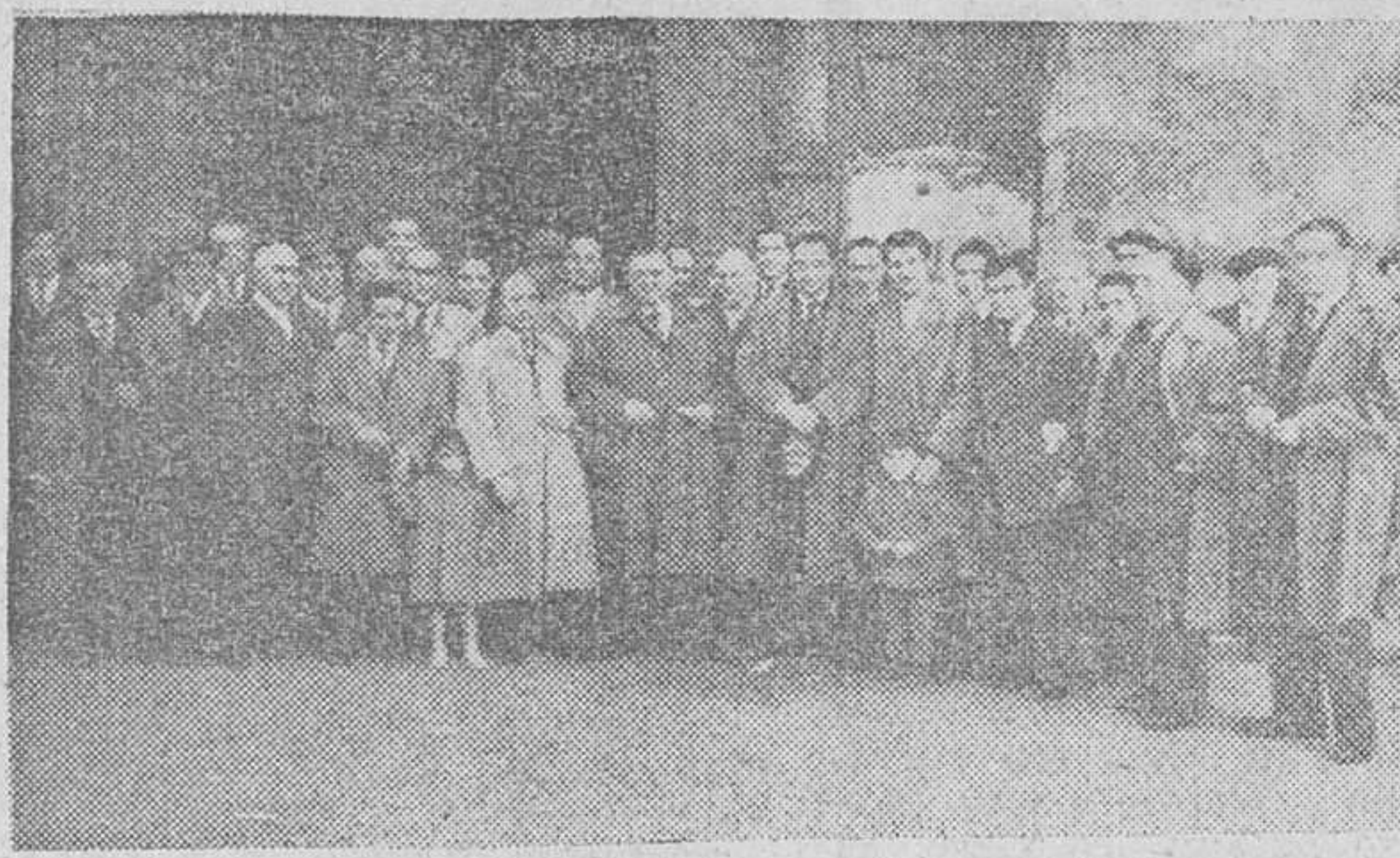
Grupo de concurrentes a la ceremonia conmemorativa del XVI aniversario de la fundación de la Peña Recreativa Castellana

Los actos, celebrados el domingo, fueron presididos por el alcalde, quien prometió como procurador en Cortes defender los intereses de las entidades recreativas