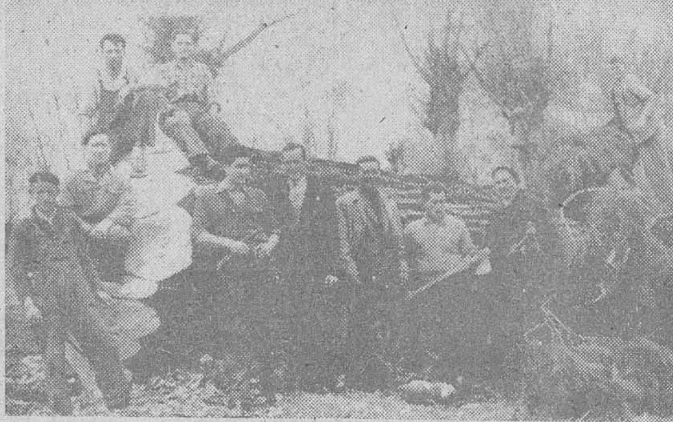
Des momentos de las operaciones de derribo del excepcional pino gigante, abatido días pasados en una huerta de "El Capiscol". En la parte superior, varcos de los obreros que participaron en el pique previo del árbol, antes de proceder a su aserrado manual. En el grabado inferior, una fotografía proporcional del tamaño del tronco, una vez derribado, junto al cual se han fotografiado los que le han abatido.