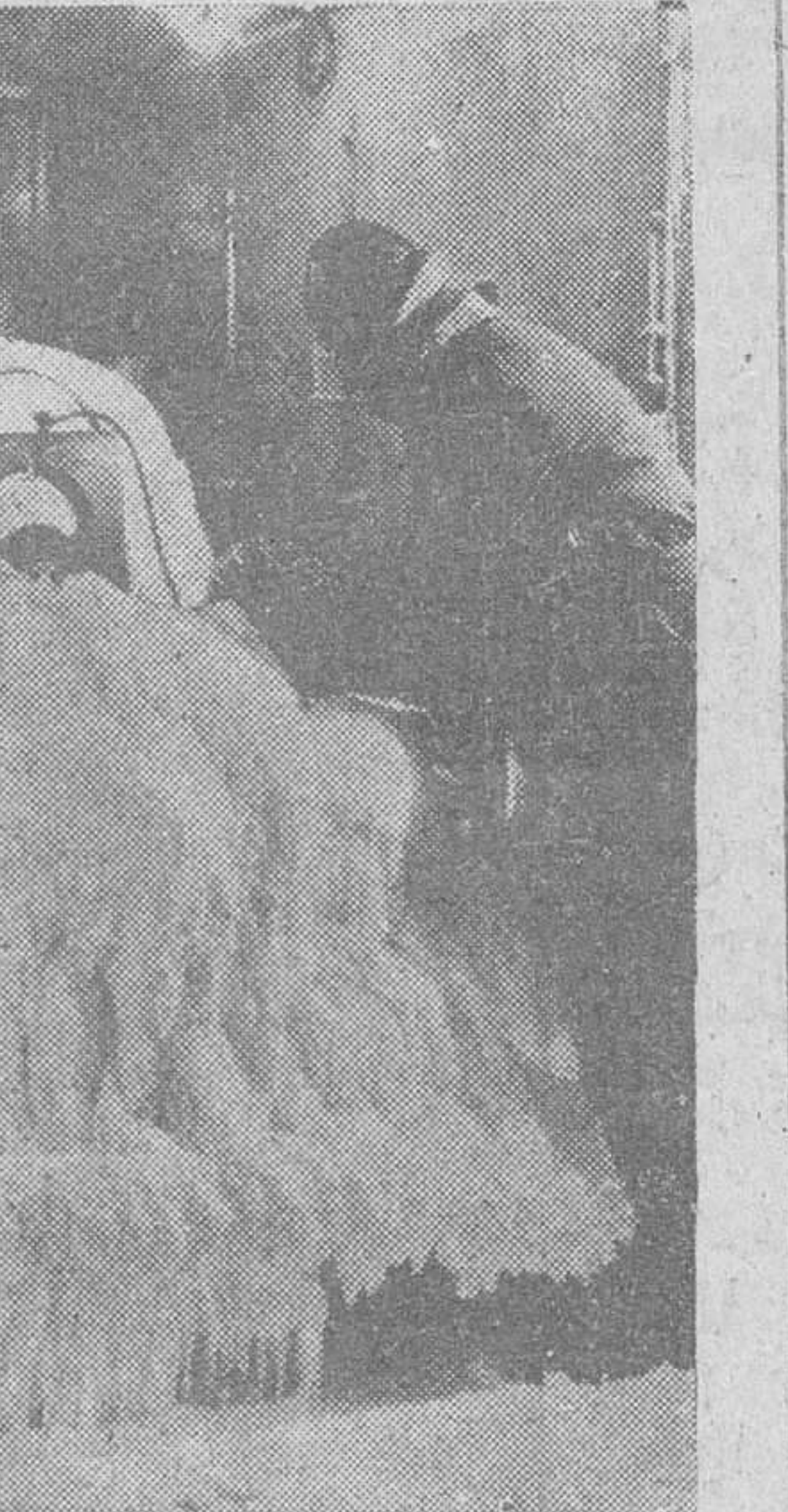
En una factoría de automóviles de Inglaterra, uno de sus últimos modelos es sometido a la "prueba del frío" durante la cual permanece durante tres días cubierto de hielo, en una cámara frigorífica apropiada.

les y cónales. Hizo un maravilloso día, de los que incitan a dejar los abrigos en casa. El cielo, limpio. La temperatura, maravillosa. Y casi picaba el sol. Baste decir que a las diez de la noche las terrazas de los pubs llamados cafes estaban atestadas. Este San Martín nos ha obsequiado con un veranazo, más que veranillo.