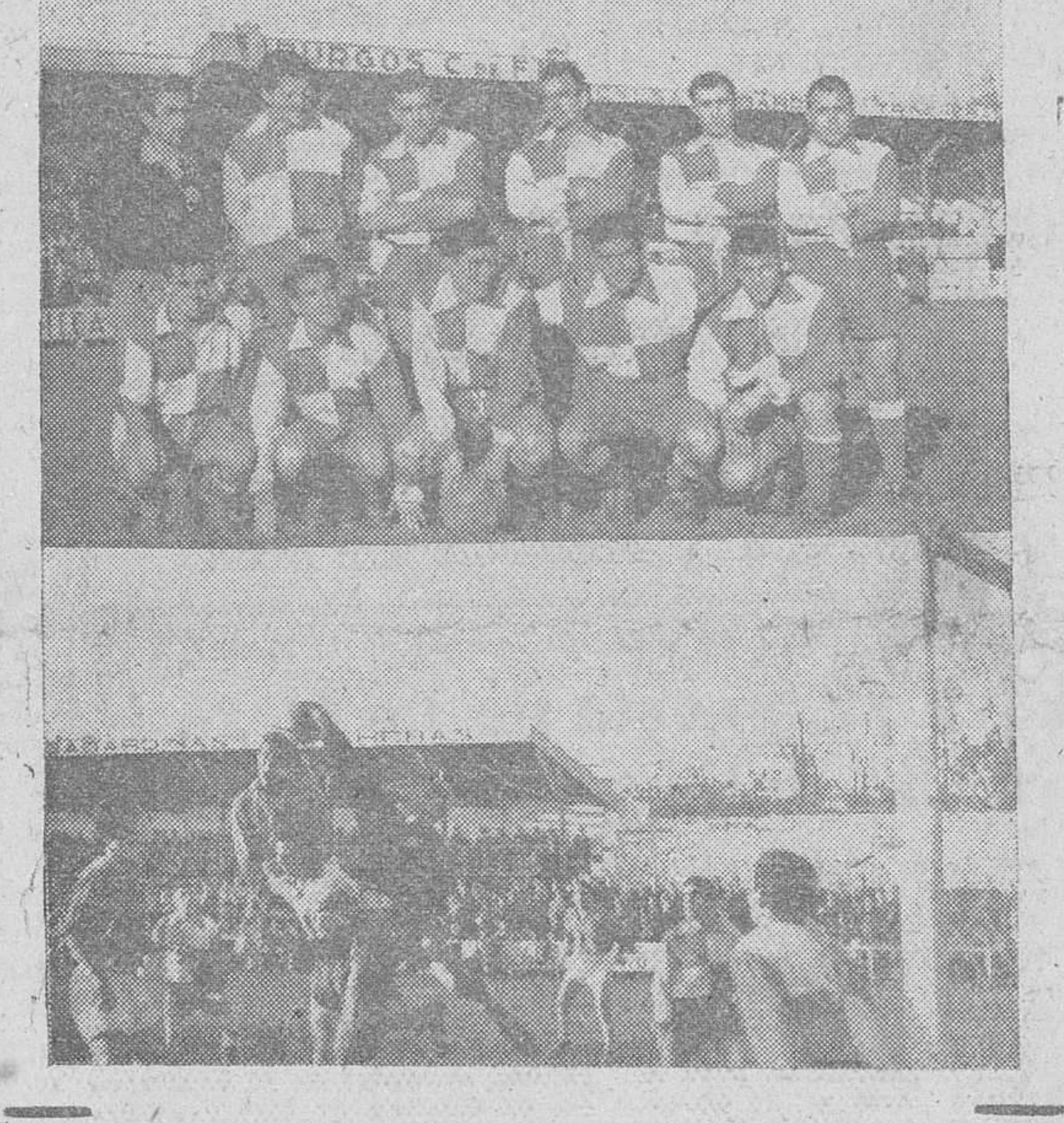
Equipo forastero. — (Foto FEDE) grabado uno de los múltiples e ineficaces acosos de la puerta del del Juventud, sacó un punto, el domingo último, de Zatorre. Al pie del El Júpiter vallisoletano, que, aprovechándose de la bajísima actuación

Teniendo en cuenta cómo se desarrolló el juego del pasado domingo, hay que considerar como bueno el resultado logrado por el Juventud frente al Júpiter vallisoletano, pese a que dicho resultado significó ceder un punto precisamente ante el colista del grupo. Quiere esto decir que los locales actuaron mal, sin paliativos y muy por debajo de sus verdaderas posibilidades, precisamente en una tarde en que se esperaba su reacción. Si el partido no le perdieron, han de agradecerlo a la poca profundidad rematadora de los visitantes y al afortunado remate de Casiano, a la salida de uno de los innumerables corners lanzados contra el marco de los visitantes.