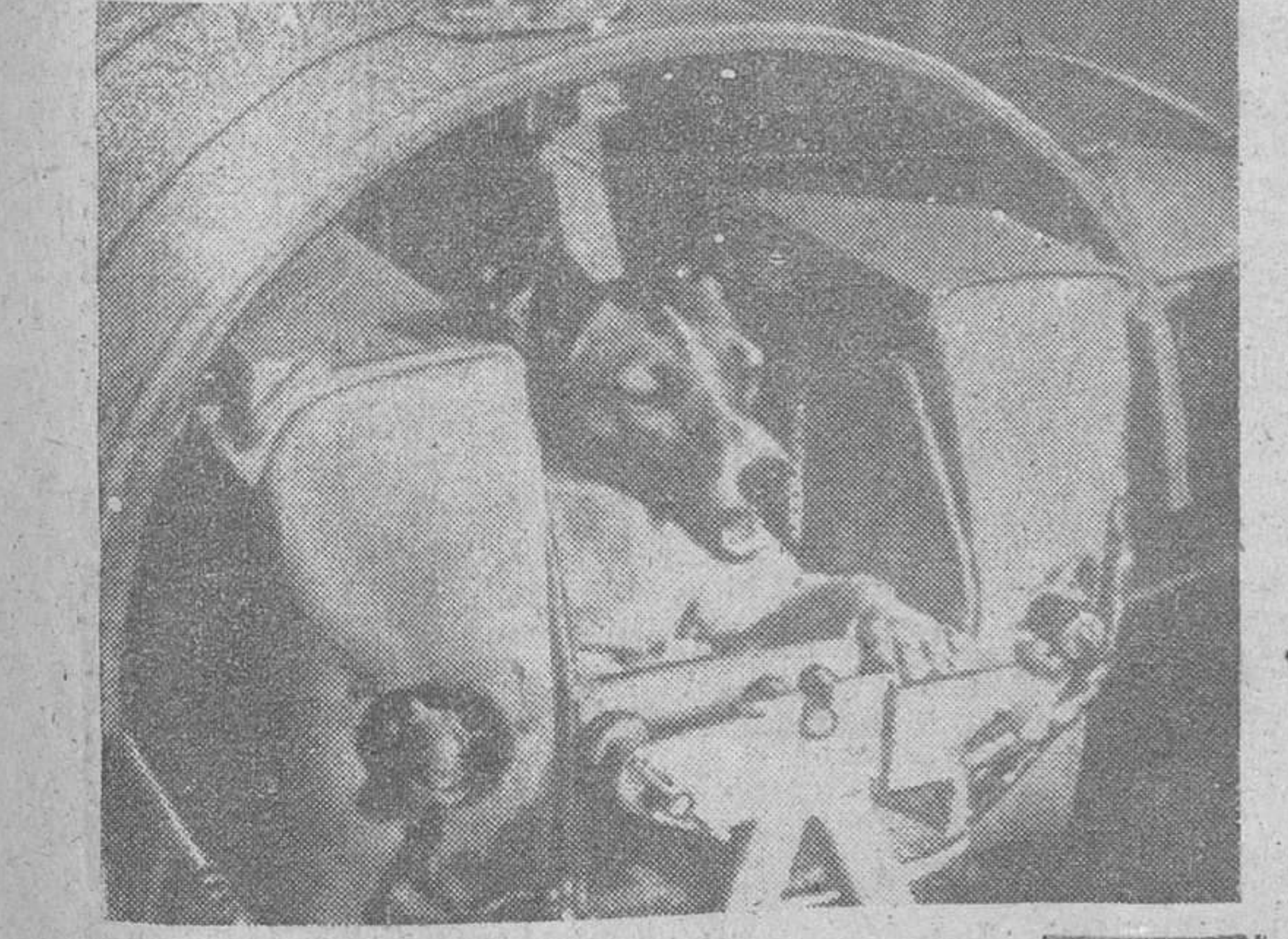
Moscú. — «Laika», la perra a bordo del «Sputnik II» que se cree haya muerto a bordo de dicho satélite artificial, fotografiada en la cabina con instalación de aire acondicionado del mismo, antes de ser lanzado al espacio.