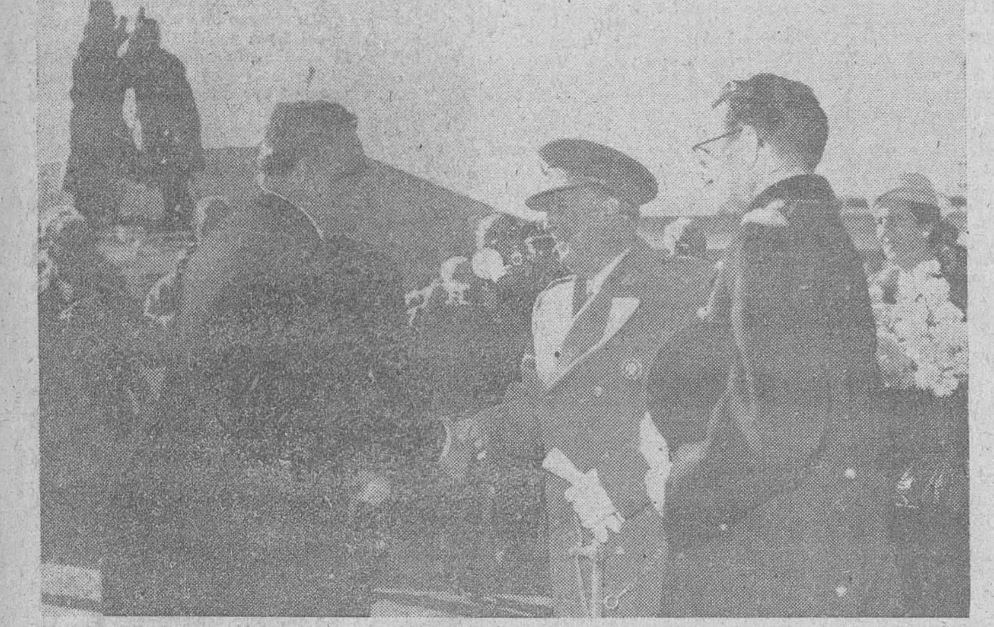
Toledo. — A las once y diez de la mañana llegaron a esta capital Su Excelencia el Jefe del Estado Generalísimo Franco y el presidente de la república islámica del Pakistán, Su Excelencia Iskander Mirza, con sus respectivas esposas.

Por la tarde, los ilustres visitantes recorrieron las calles de Madrid