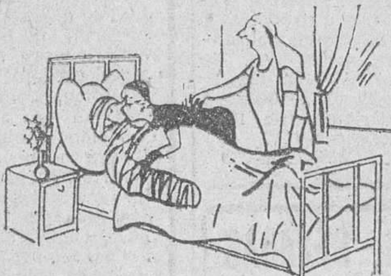
— Señora, a su marido le hemos trasladado esta mañana a la habitación de al lado.