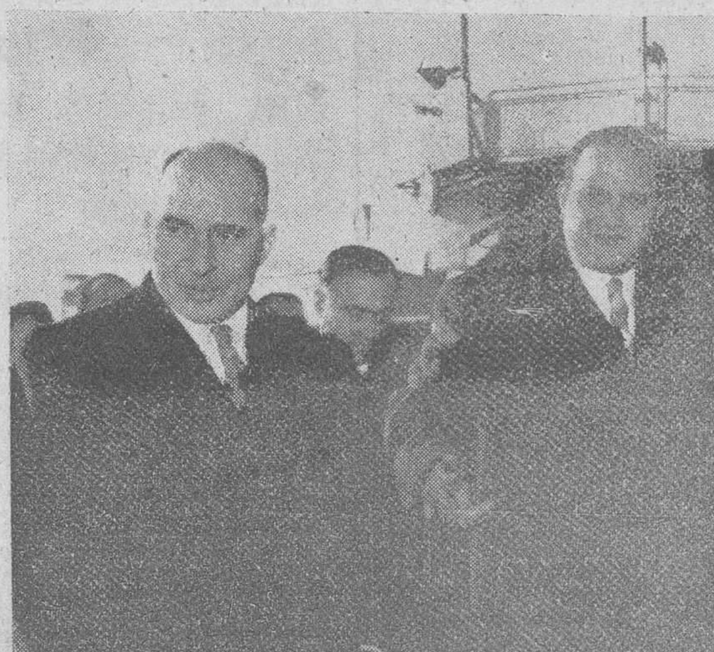
Aeropuerto de Barajas.—A su llegada a Madrid acompañado de su esposa, el ministro egipcio de Asuntos Exteriores, señor Mahmud Fazzl, fue recibido por su colega español, señor Castiella, con el que aparece en la fotografía.