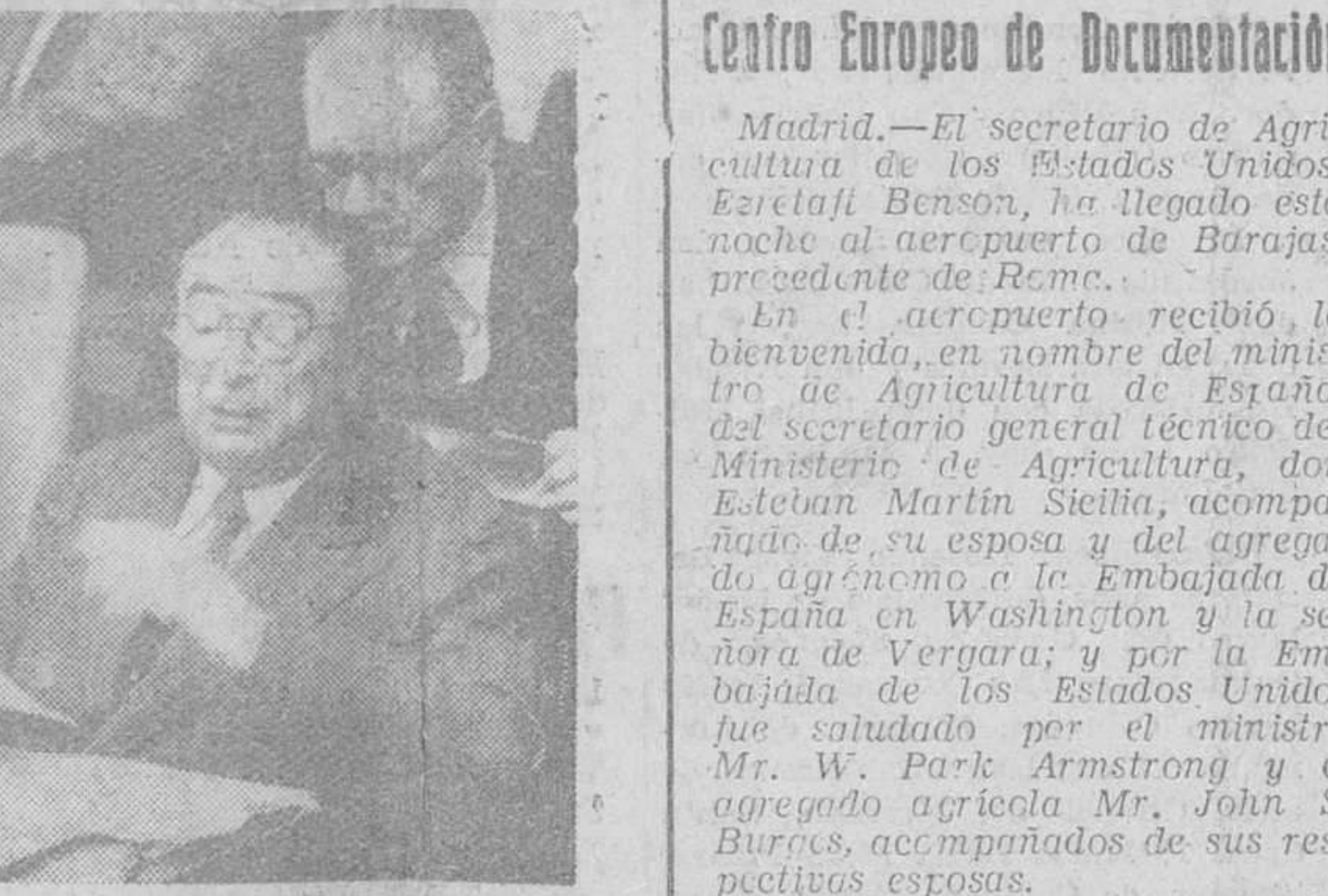
Nueva York. — El embajador de España en la ONU, don José Félix de Lequerica, durante su discurso sobre el desarme en el debate que celebró la Comisión Política principal de la Asamblea General de la ONU el pasado día 5.

Debate sobre el desarme en la comisión política principal de la Asamblea de la ONU