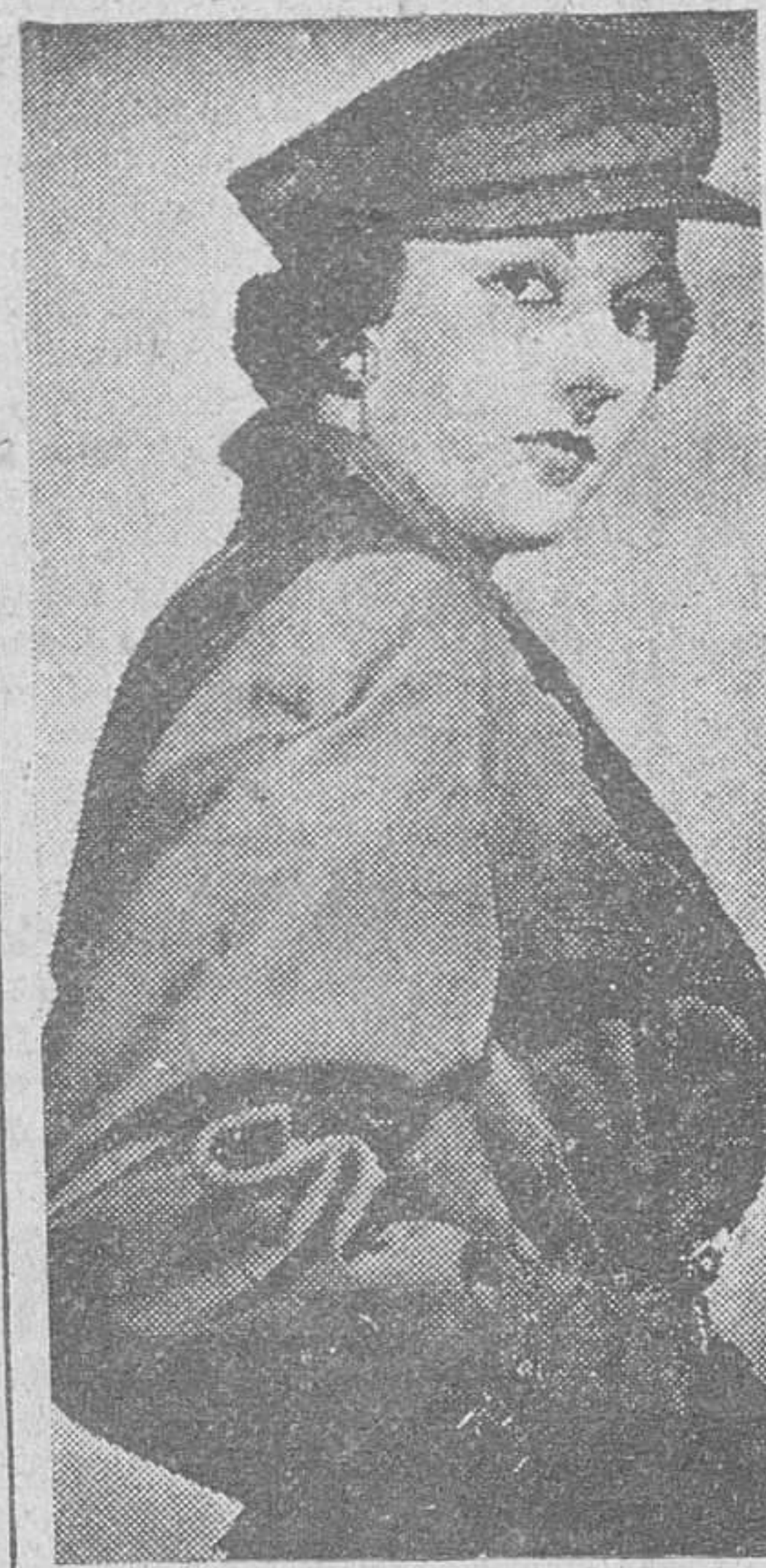
En un desfile de modelos celebrado en Londres se presentó el impermeable que vemos en la fotografía y que está hecho al estilo de los del Ejército británico. Una gorra de la misma tela que el impermeable hace juego. Su precio es reducido