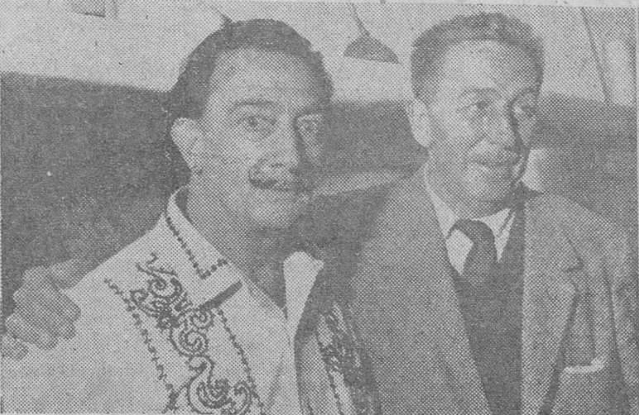
En viaje por Europa, ha estado en Barcelona el famoso dibujante americano Walt Disney, quien fue hasta Cadaqués para reunirse con Salvador Dalí y planear la producción de una película.