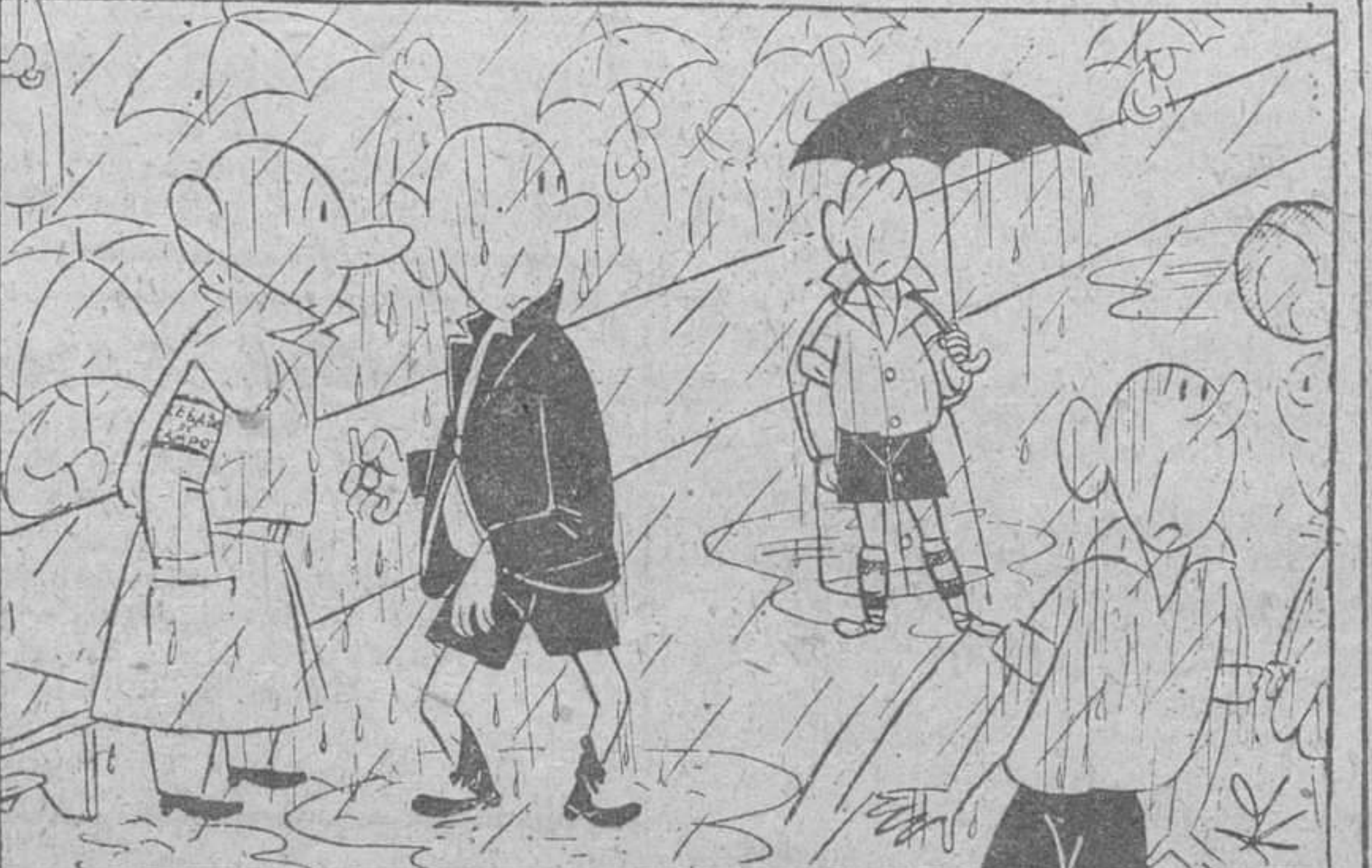
—Es para que no se constipe ¿sabe? Su flechazo nos cuesta demasiado caro.

EN algunos países de Hispanoamérica, pongamos a Cuba por ejemplo, los habitantes llamados de color forman más de la tercera parte de su conjunto demográfico. Personas de color son, además de los negros, los mulatos, hijos de blanco y negro y muy insistentemente los de blanca y negro. El problema de la discriminación de razas, que ahora aflige a los Estados Unidos, no existe en Cuba en su aspecto político y en el familiar se resuelve por sí mismo, porque los grupos raciales no se hostilizan y cuando se entizan en matrimonio no producen el asombro ni las protestas de nadie. En las guerras por su separación de España, los cubanos admitieron a los negros y uno de sus caudillos, el más popular y legendario de todos, fue Antonio Maceo, mestizo, que tiene, al igual que José Martí, su estatua en La Habana.