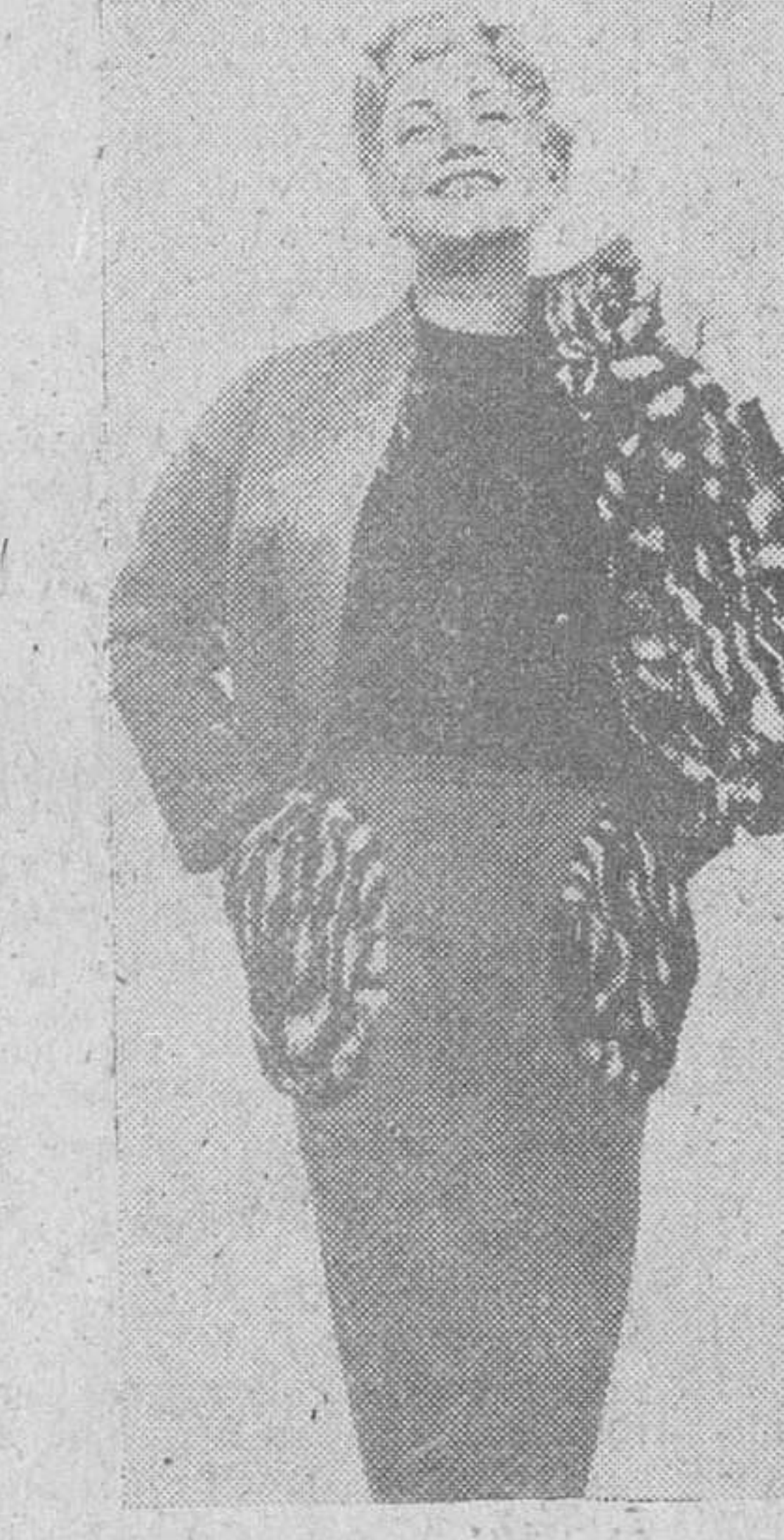
Un conjunto para invierno, a la vez práctico y elegante. La chaqueta y la falda, de lana encarnada, llevan adornos de piel. Jersey negro. Lo firma Jacques Fath.