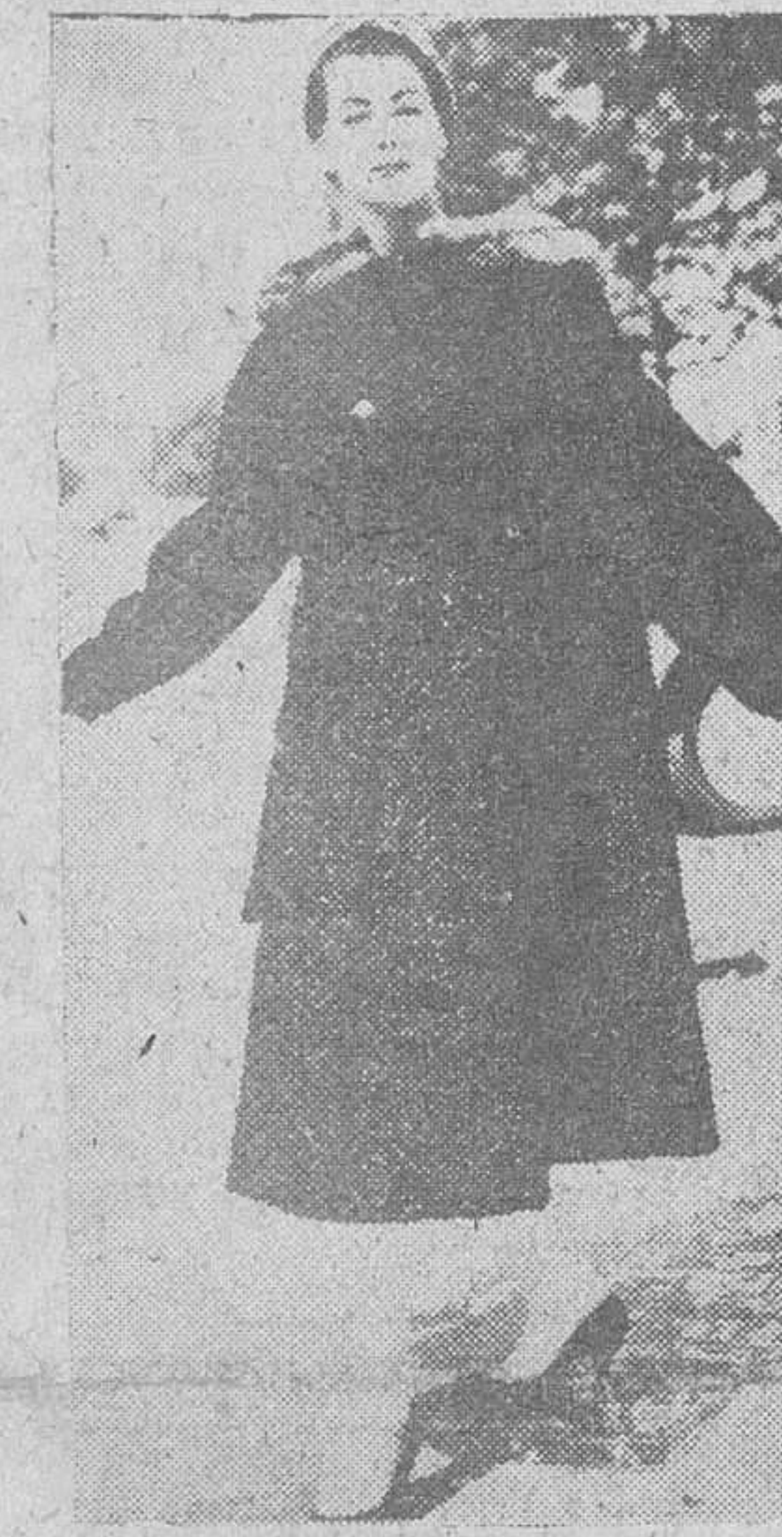
He aquí un lindo abrigo en astrakan, de la nueva colección de alta costura para el invierno 57-58, que acaba de presentar Jean Dessès, en París. Forma un pliegue a cada lado, recogidos por un cinturón, mientras que la espalda flota libremente. Una banda de visón señala el cuello.

Hay que conquistar al marido para que vaya aprobando el presupuesto, de la nueva temporada, que como protigio, en pieles lo será también en facturas un poco subidas.