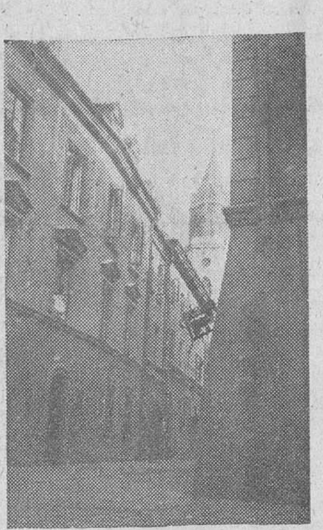
Una calle típica de la ciudad vieja de Lublín.

La visita al campo de concentración de Lublín produce una impresión desagradable y nauseabunda. No quedan ganas de visitar más y, aunque hubiéramos podido ver el de Krakow, no tuvimos ánimo suficiente para hacerlo. Sin embargo, visitar un campo de concentración es necesario para sentir odio feroz a la guerra y a todo aquello que sugiera violencia. Estos campos de concentración son, a pesar de su crudeza y de su ambiente ma-