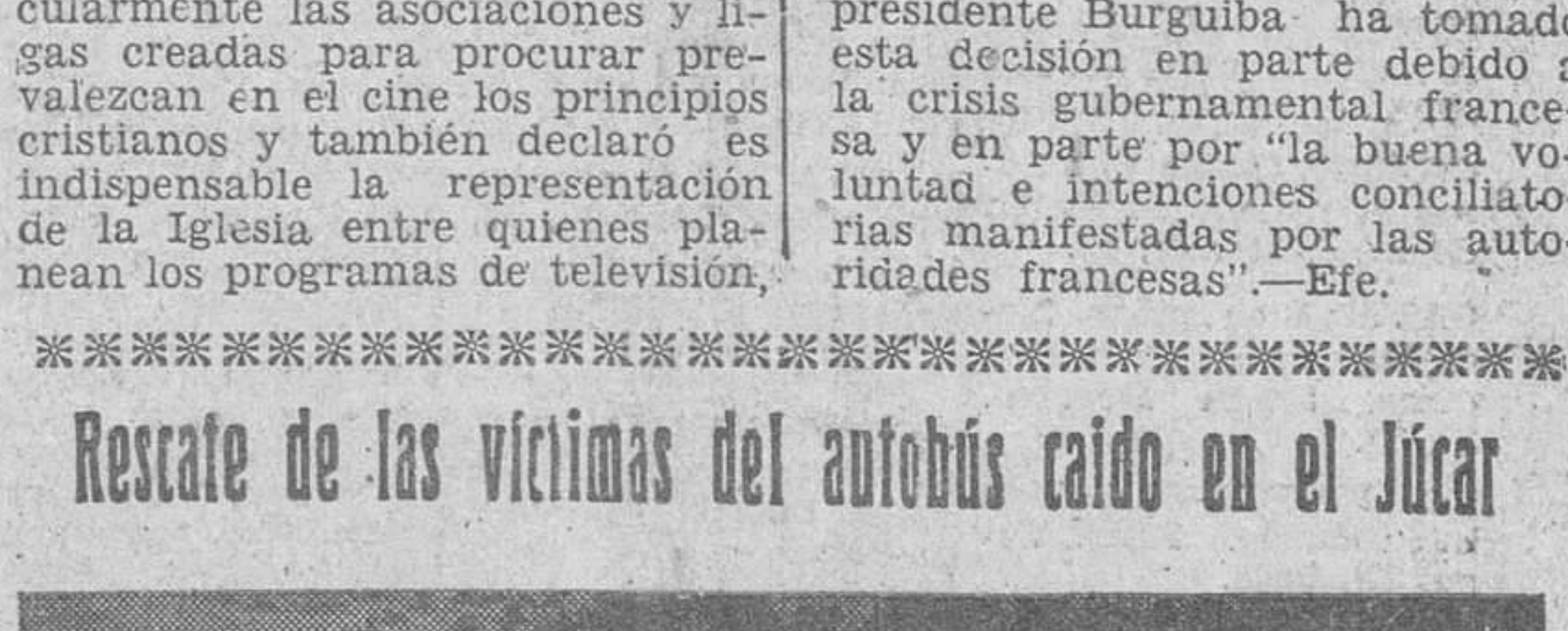
Cuenca. — Un momento del traslado de los féretros con las víctimas del coche de línea que se precipitó en el río Júcar. A la derecha el autobús ya casi fuera del agua.