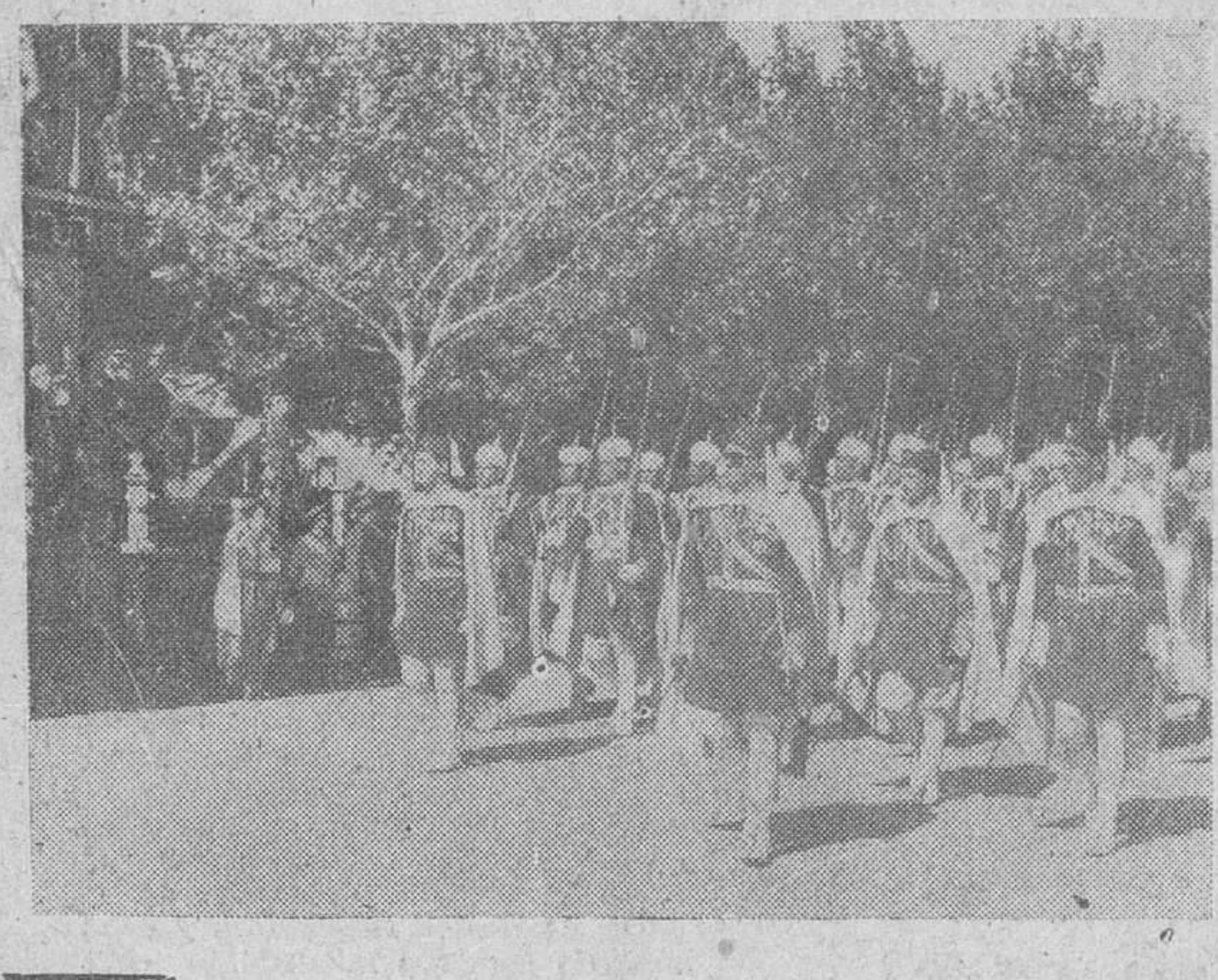
Madrid. — S. E. el Jefe del Estado, acompañado de su esposa, de los miembros del Gobierno y otras personalidades, durante el desfile de las fuerzas de la Casa Militar celebrado en el recinto del palacio de El Pardo con motivo de la fiesta onomástica del Caudillo.