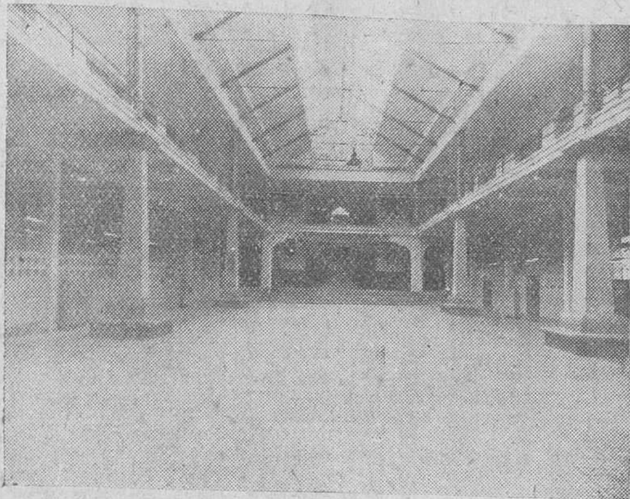
Soberbia perspectiva que ofrece la primera planta de la Escuela de Maestría Industrial

Acaba de comenzar el mes de Octubre, en que se reanuda las actividades en todos y cada uno de los Centros docentes burgaleses. Día a día, va sucediéndose la referencia de actos o solemnidades inaugurales de curso, que con mayor o menor relieve se celebran al efecto. Mas una de las instituciones que con mayor sencillez abren el nuevo ciclo de sus tareas es la Escuela de Maestría Industrial (antes de Trabajo) donde, todos los años, unos centenares de muchachos burgaleses llenan talleres y aulas para recibir una serie cada vez más amplia de conocimientos, a fin de obtener una completa formación profesional que les abra un glorioso porvenir en el desempeño de funciones laborales en fábricas, industrias, comercios u oficinas, en las cuales cada vez es más solicitada la colaboración de alumnos allí preparados. Como contrapartida de esa propia sencillez a que aludimos, nosotros hemos querido subrayar, ante el comienzo del nuevo curso, la importancia, peculiaridades y funcionamiento de esta veterana y fecunda institución docente burgalesa, dependiente del Ministerio de Educación Nacional. Y, a tal efecto, solicitamos una entrevista, sobre tan sugestivo tema, del director de la Escuela de Maestría Industrial, D. Julián Lizondo Gascuña, que en el Centro viene desarrollando una intensa labor pedagógica hace ya virtualmente treinta años, es decir, desde su fundación.