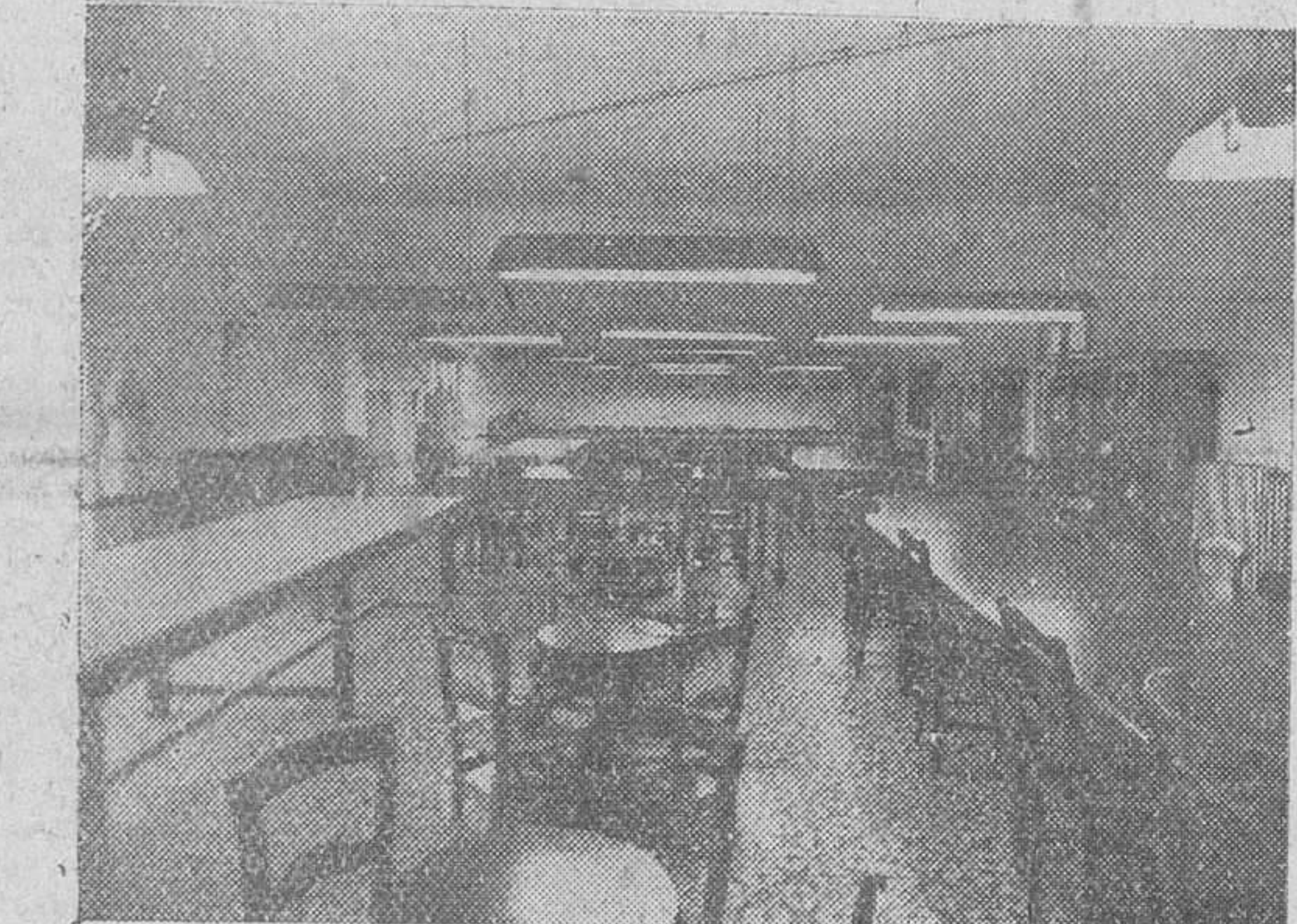
La clase destinada a labores femeninas