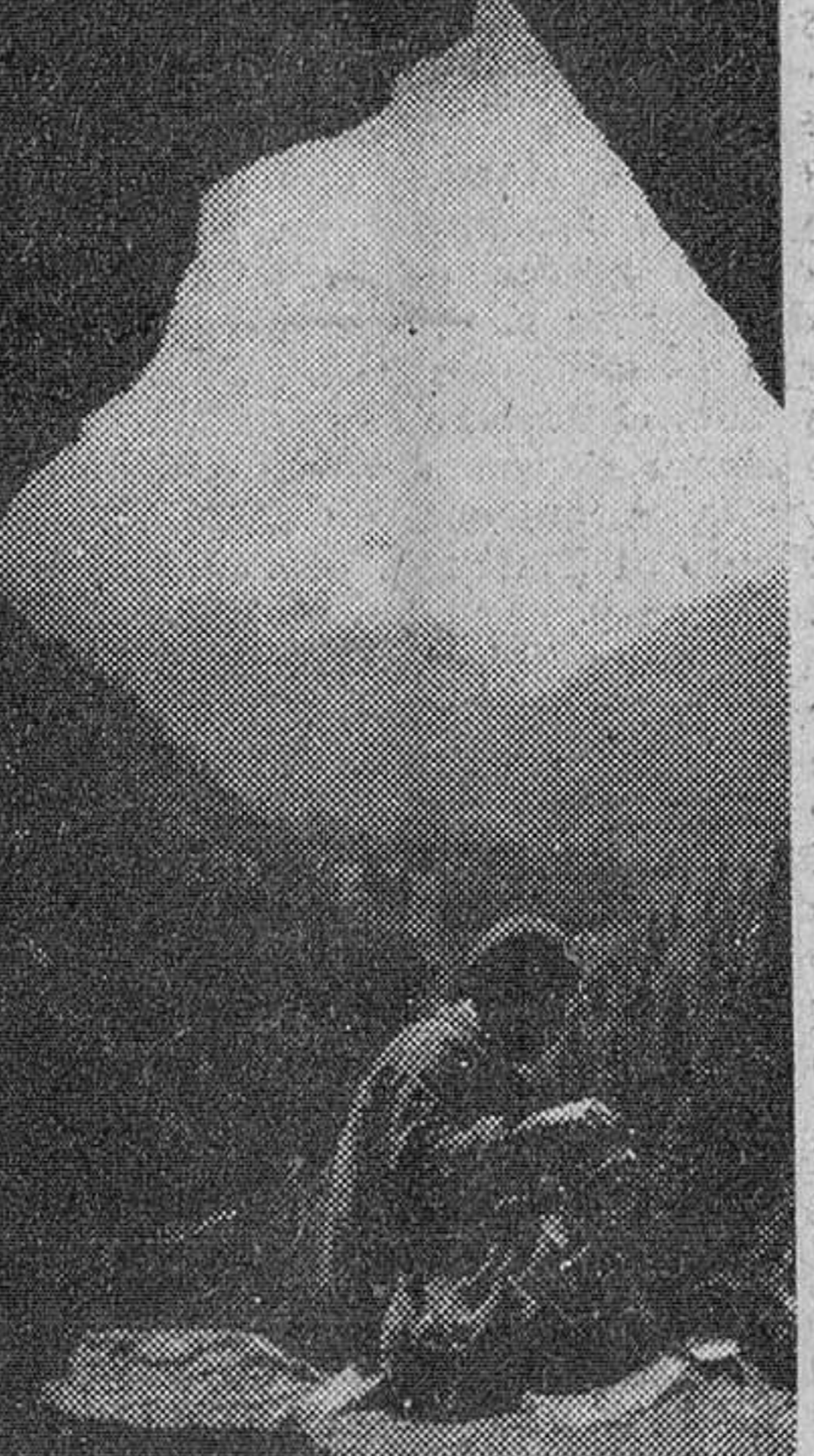
Un espeleólogo austriaco, a la entrada de la cueva Zimna.

Allí, abajo, algunas ovejas se juntan, buscándose protección. De la boca de la gruta salen bocanadas de vapor cargadas de liones. Los cabellos se ponen de punta a cau-