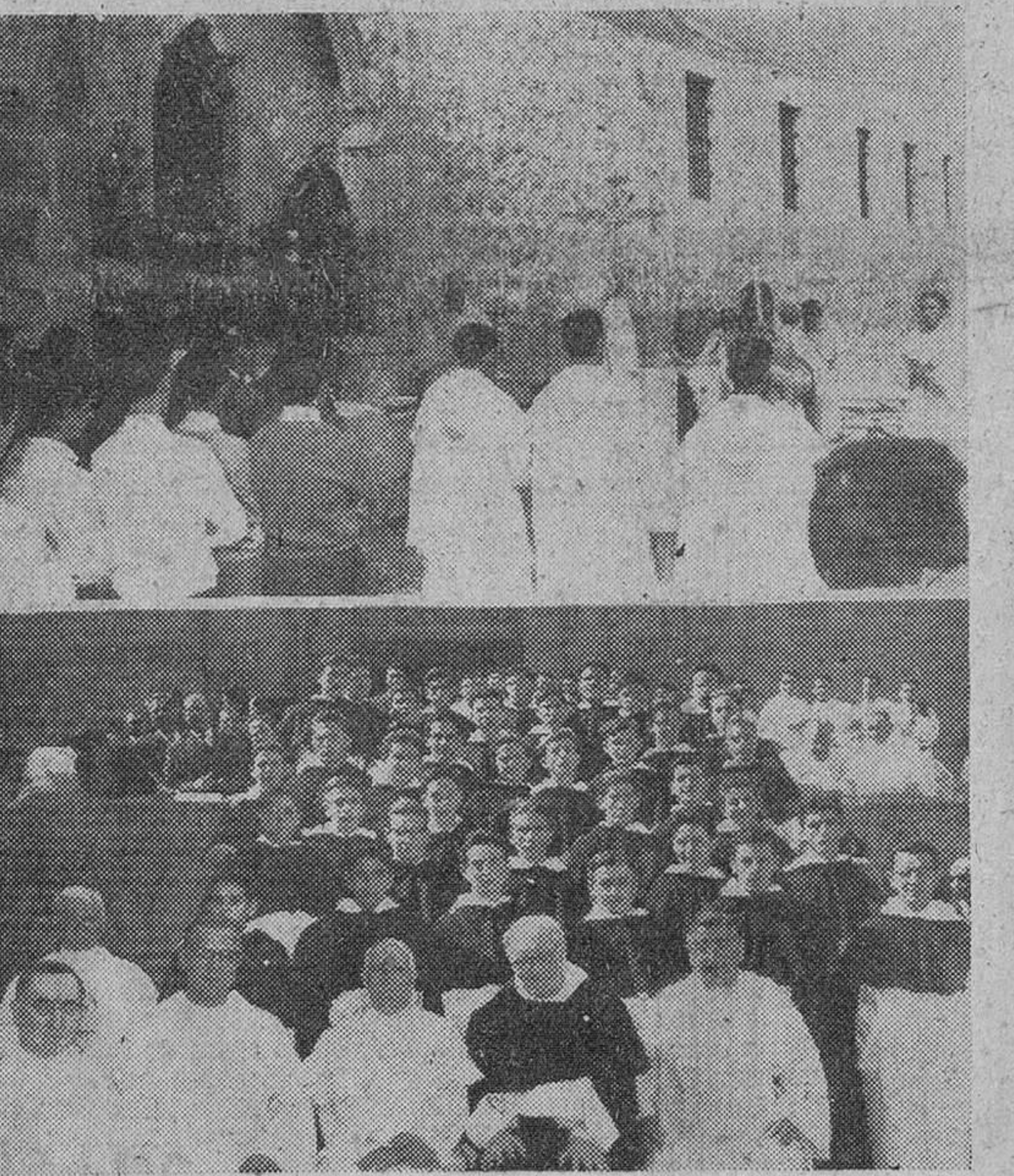
Dos momentos de los solemnes actos celebrados ayer en Caleruega. En la parte superior, el Padre Maestro General de la Orden de Predicadores, oficiando en la solemne misa. En el grabado inferior, el P. Brown, acompañado de varios provinciales, con el grupo de novicios que recibieron el hábito.