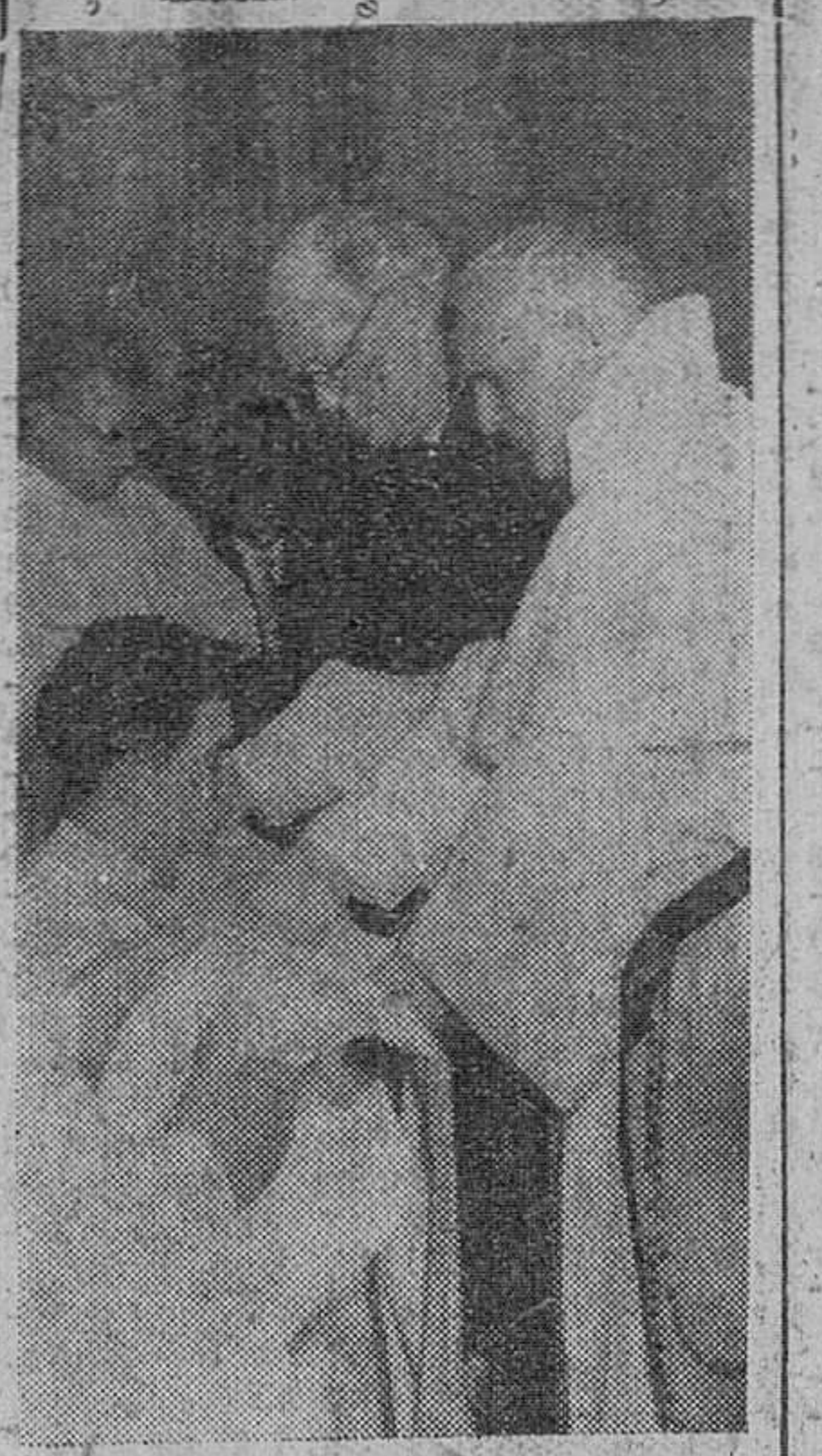
Momento de la imposición de hábito a uno de los novicios.

Las autoridades e invitados fueron delicadamente obsequiados con un almuerzo, que fue presidido por el Rvdo. P. Maestro General, quien tenía a su derecha al Arzobispo de Burgos y al Sr. Puigdollers y a su izquierda a los señores gobernador civil y obispo del Burgo de Osma. A los postres, el provincial de España pronunció unas palabras de agradecimiento y señaló la importancia de la obra, que tiene la finalidad de formar a los novicios que ingresen aquí según el espíritu de Santo Domingo para ser heraldos de la verdadera paz por el Mundo.