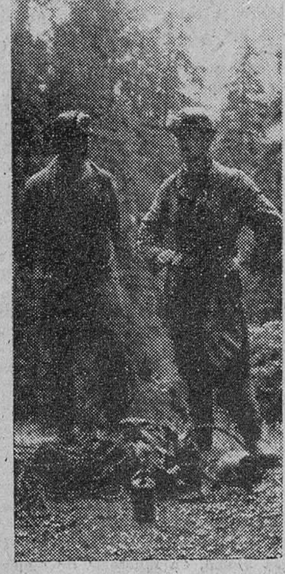
Dos exploradores comentan las incidencias de los trabajos, en un breve descanso.

Desde Morskie Oko nos trasladamos a Dolina Kotliciska, valle parecido como una gota de agua a otra a los de nuestros Pirineos. Afortunadamente, existe