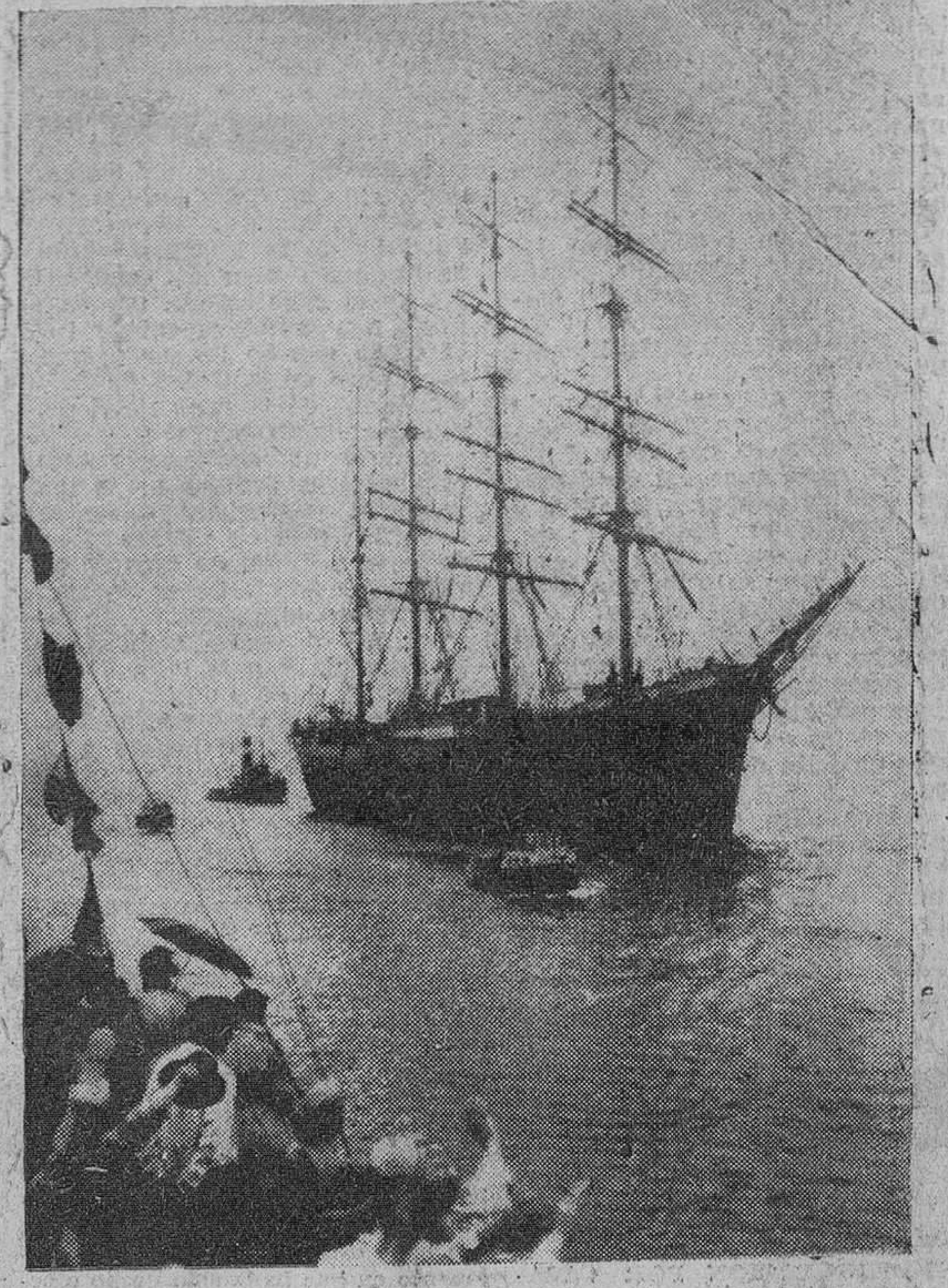
He aquí el "Pamir", velero de la Marina Mercante alemana, que prestaba servicio como buque-escuela, desaparecido al Oeste de las Azores, a causa de un terrible huracán. Últimas noticias, y después de desconocerse la suerte de su tripulación, informan que han sido salvados varios tripulantes, que navegaban en dos botes salvavidas al ser rescatados por el mercante norteamericano "Saxon".