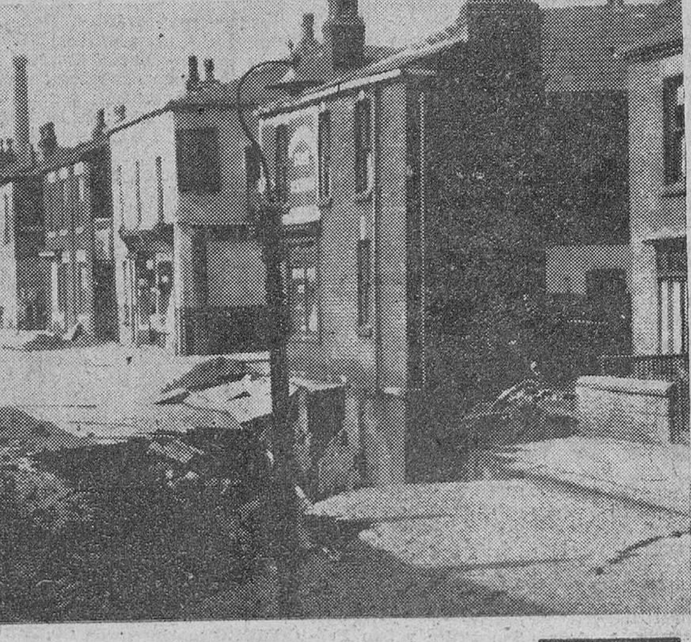
Farnworth (Lancashire). — Vista del enorme socavón producido por las inundaciones habidas en días pasados a causa de las torrenciales lluvias caídas, que provocaron el hundimiento de 17 casas. Ciento dieciocho viviendas hubieron de ser desalojadas y cerca de 500 personas han quedado sin hogar.