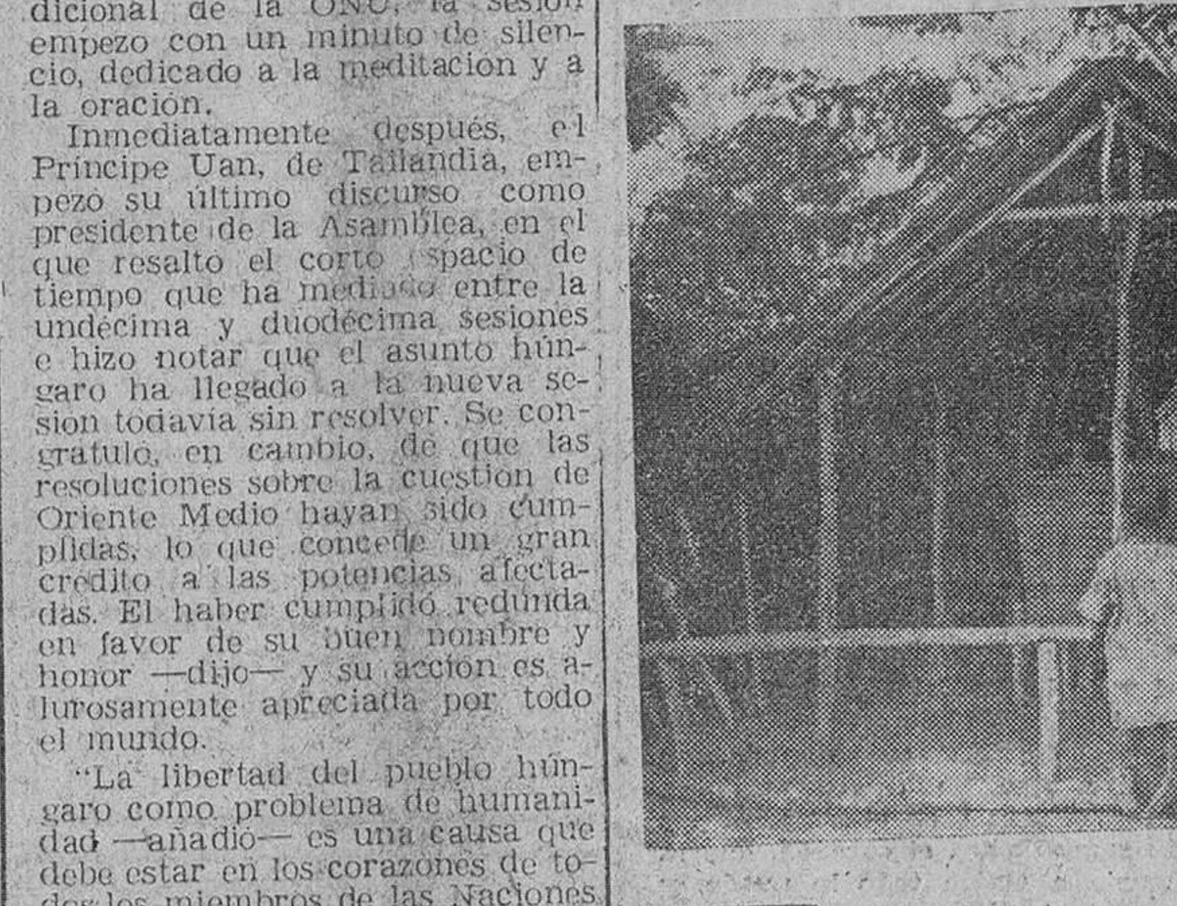
En Bankana (Congo Belga) existe desde hace muchos años, una capilla dedicada a Nuestra Señora. Fue construida con motivo de una terrible epidemia de la enfermedad que transmiten las moscas Tse Tse, más conocida por la enfermedad del sueño.