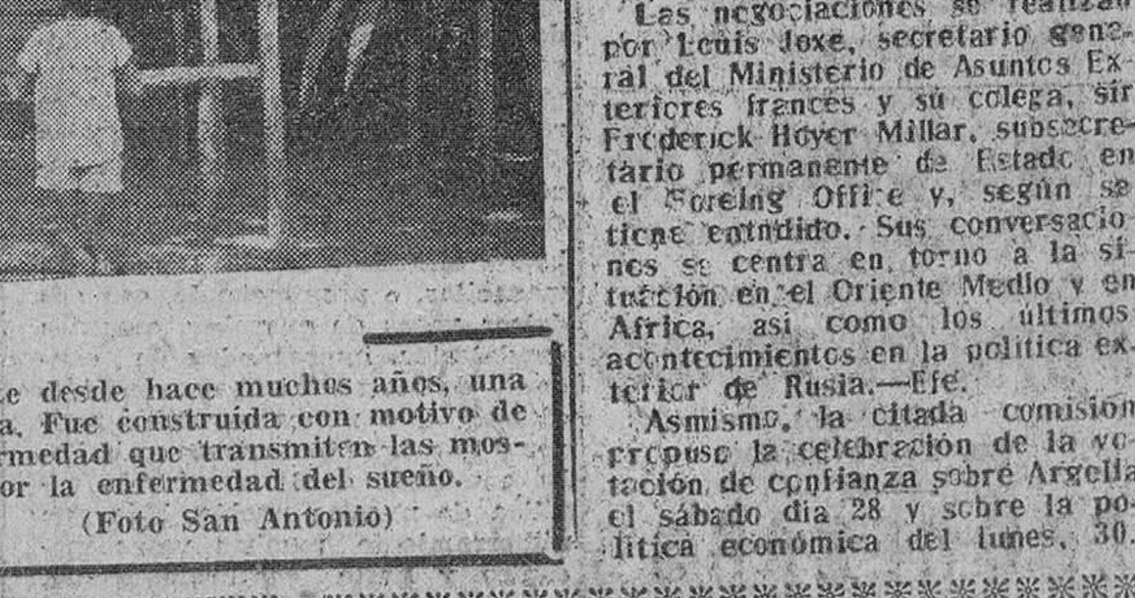
En Bankana (Congo Belga) existe desde hace muchos años, una capilla dedicada a Nuestra Señora. Fue construida con motivo de una terrible epidemia de la enfermedad que transmiten las moscas Tse Tse, más conocida por la enfermedad del sueño.

Londres. — Inglaterra y Francia han iniciado conversaciones en torno a los problemas de interés mutuo, según se anuncia oficialmente. Las negociaciones se realizan por Louis Joxe, secretario general del Ministerio de Asuntos Exteriores francés y su colega, sir Frederick Hoyer Millar, subsecretario permanente de Estado en el Foreign Office y, según se tiene entendido, sus conversaciones se centra en torno a la situación en el Oriente Medio y en África, así como los últimos acontecimientos en la política exterior de Rusia.—Efe. Asimismo, la citada comisión propondrá la celebración de la votación de coplanificación sobre Argelia el sábado día 28 y sobre la política económica del lunes, 30.