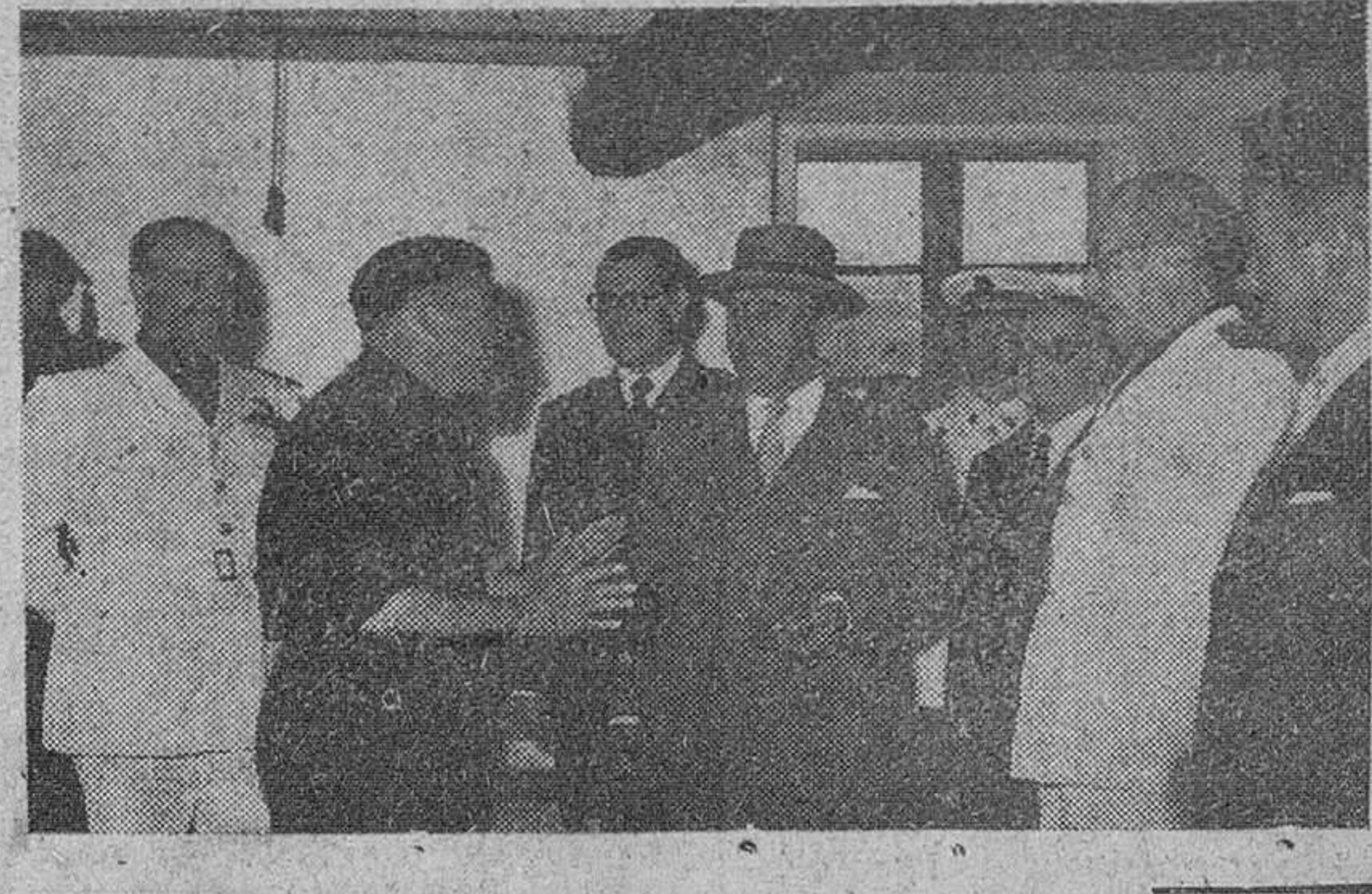
La Coruña. — S. E. el Jefe del Estado acompañado de las personalidades de su séquito, durante su visita a una de las fincas de explotaciones agrarias familiares protegidas, que han sido montadas bajo los auspicios del Ministerio de Agricultura o por la Organización Sindical.