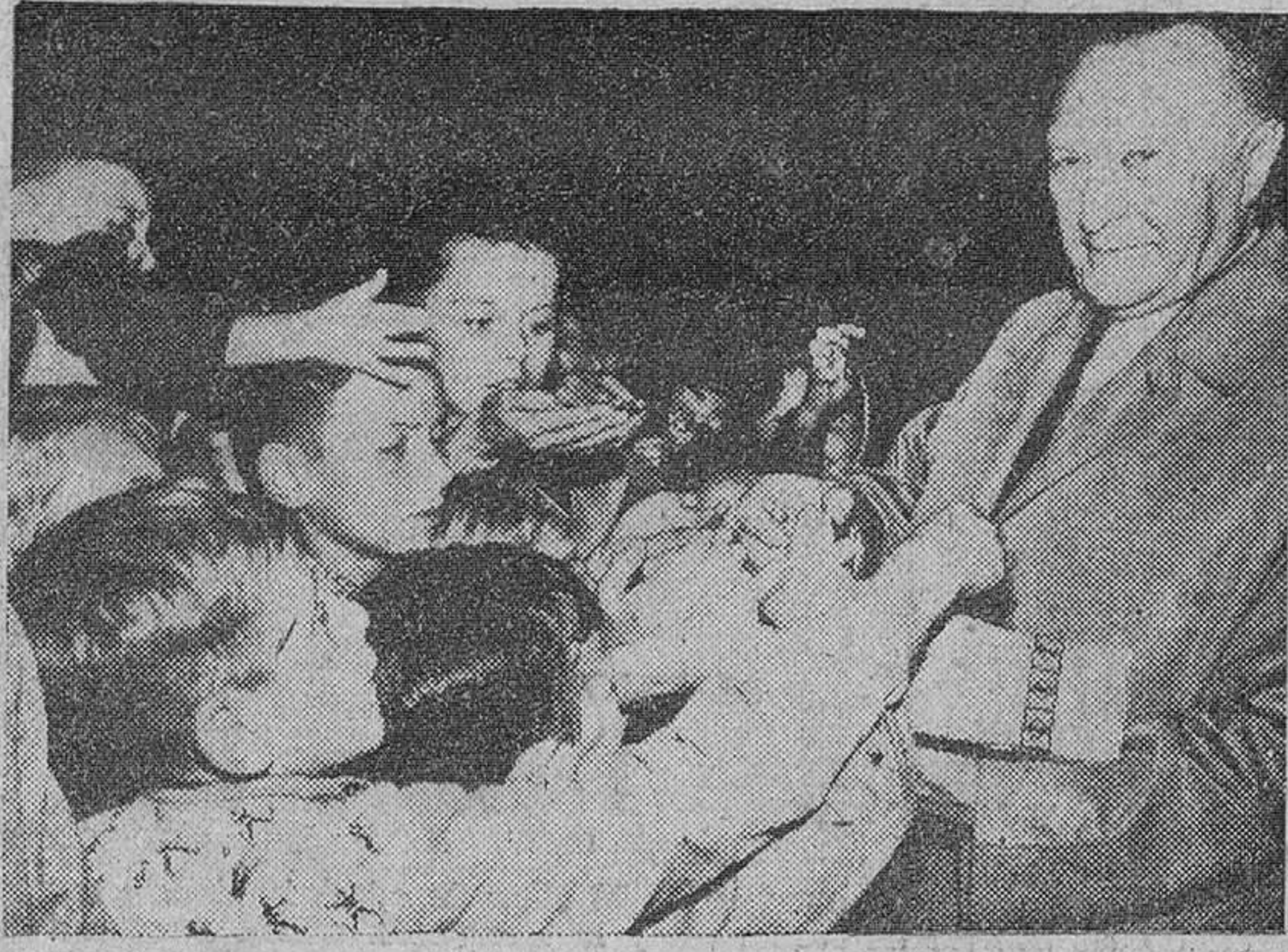
Frankfurt.— El octogenario canciller alemán y como fin de su campaña electoral por toda la Alemania occidental, obsequia a un grupo de niños con chocolatinas.

Para el día 15 de Octubre ha sido convocado el Parlamento