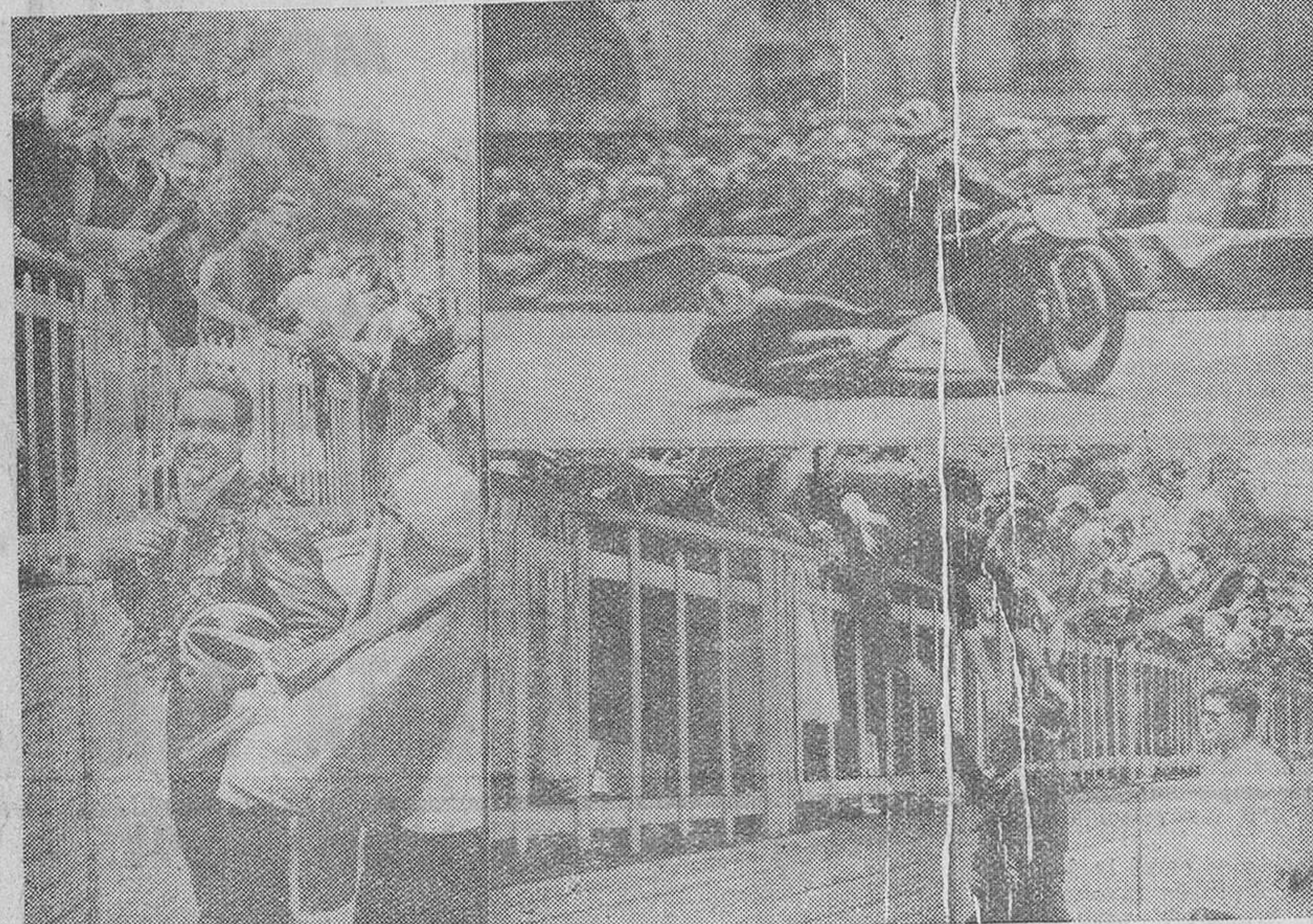
Millares de personas presenciaron la gran prueba motorista celebrada el domingo último, en circuito urbano. En nuestras "fotos", un momento de la carrera y dos corredores recibiendo los premios conseguidos.