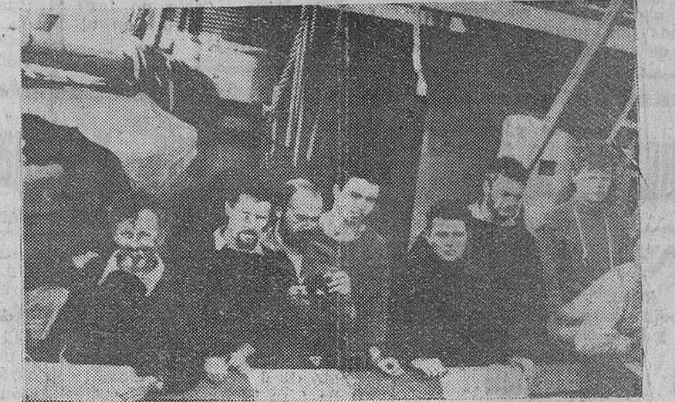
En el Atlántico.— Miembros de la tripulación del velero "Mayflower" fotografiados en pleno Atlántico, en la víspera de su feliz arribo al puerto de Plymouth (Norteamérica) y procedentes del Plymouth inglés, de donde salieron el pasado día 20 de Abril.

La Organización Sindical concederá 22.608 becas en el curso 1957-58