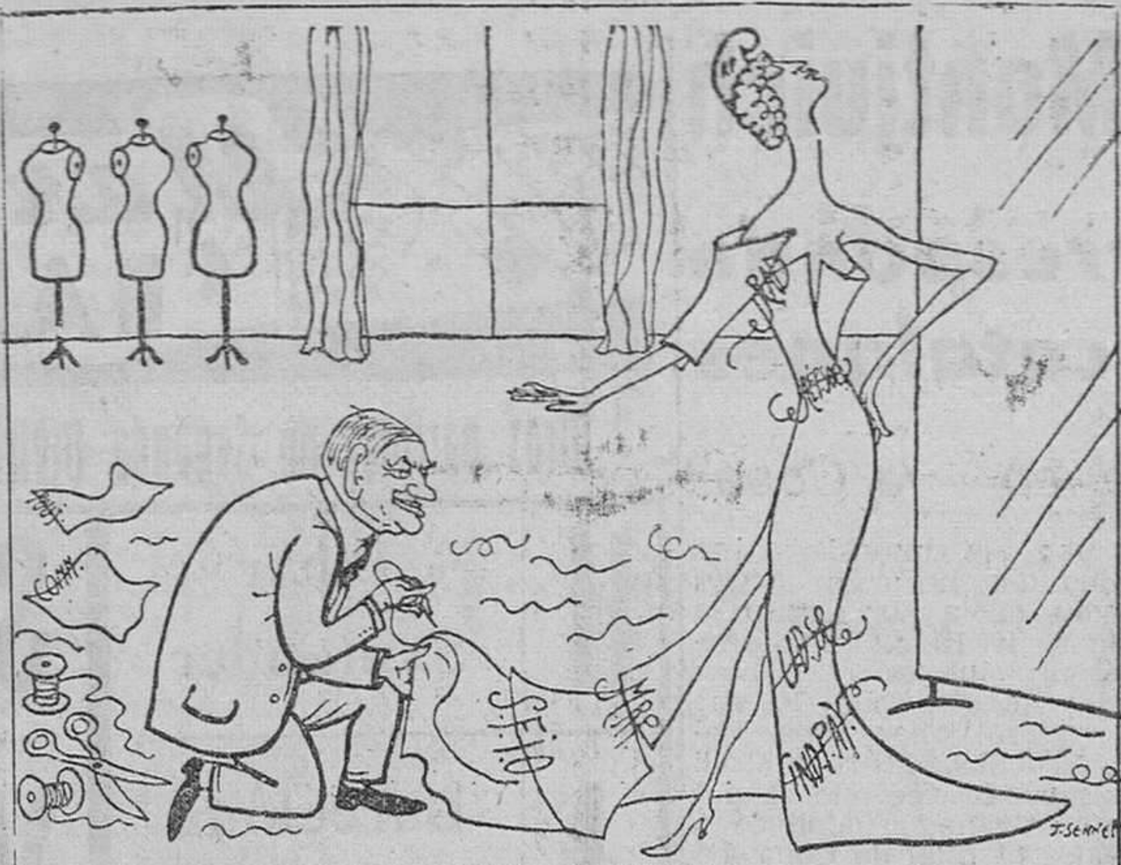
HAUTE COUTURE Dépôt: Nouvelles Nouveautés 40 rue de Valenciennes pour la présentation de notre collection d'été

Las temperaturas extremas han correspondido a Córdoba con 33 grados y a Soria, con 6.—Cifra.