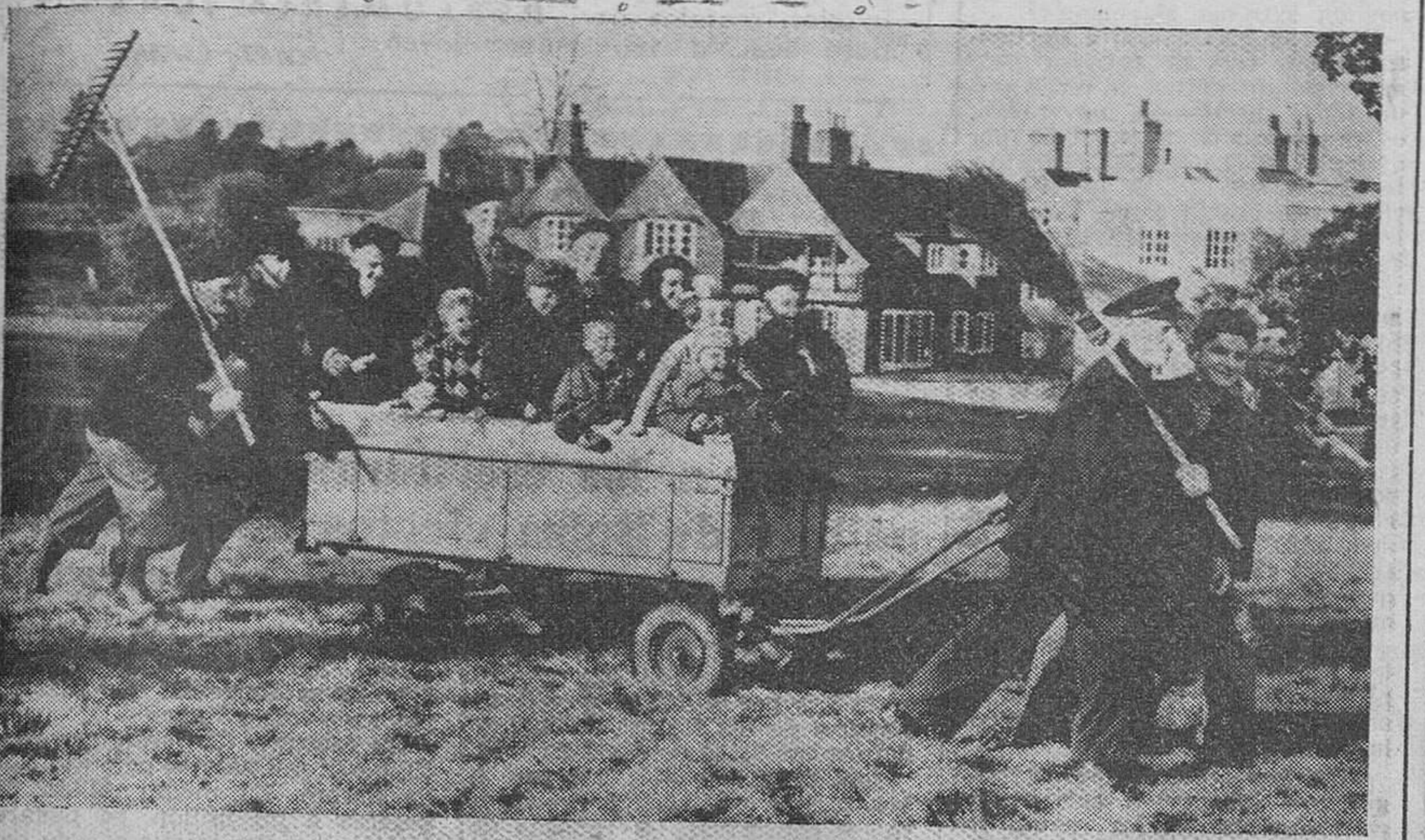
Hamburgo.—(Crónica del corresponsal de la Agencia MIROSPA para DIARIO DE BURGOS).

Al ritmo de 200 diarios regresan a Hungría procedentes de los más diversos países del mundo libre