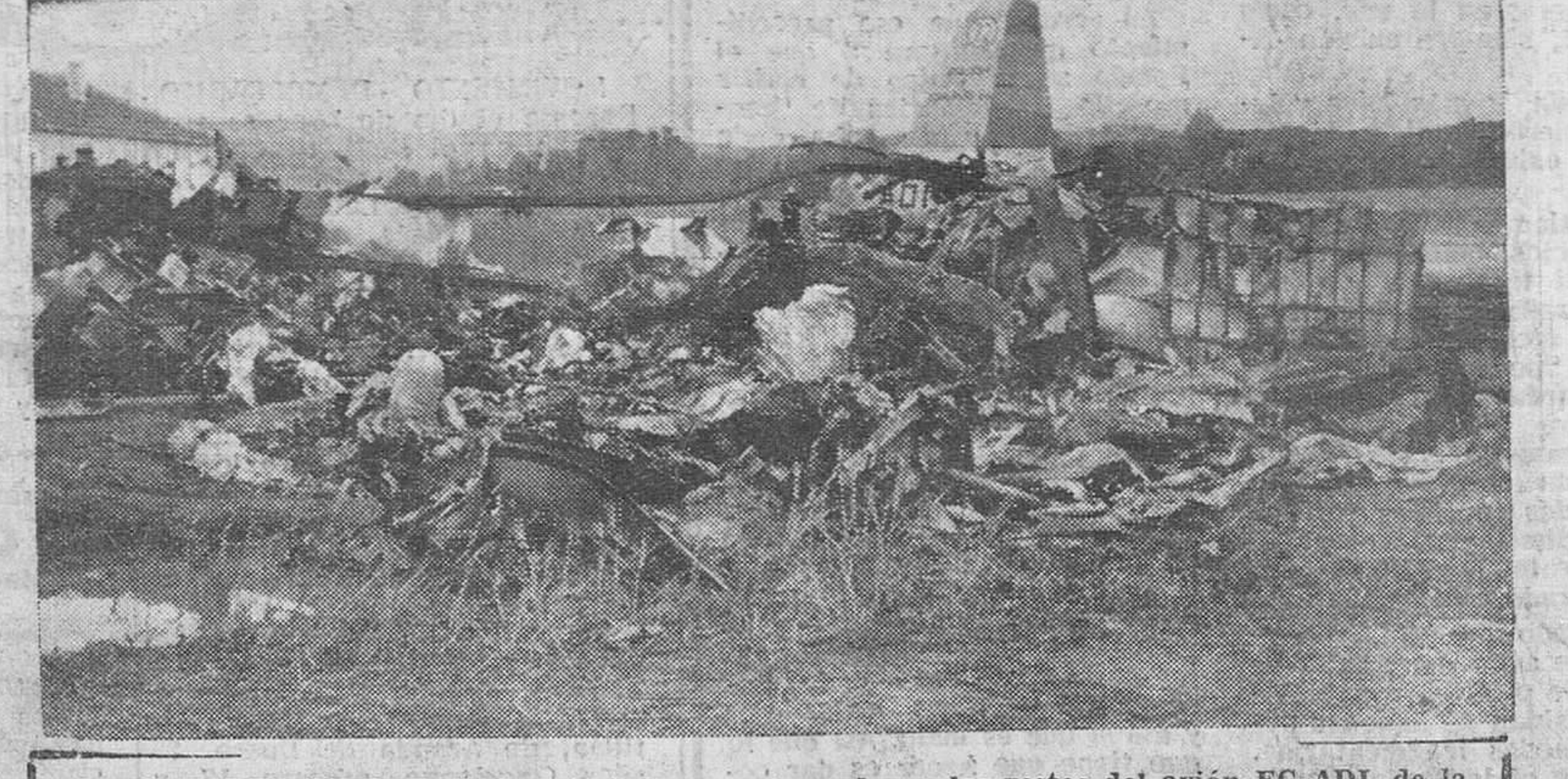
AEROPUERTO DE BARAJAS. — Estado en que quedaron los restos del avión EC-ADI, de la línea de Santiago de Compostela, que se estrelló cuando intentaba tomar tierra y en el que perecieron sus treinta y dos pasajeros y cinco tripulantes. — (Foto Cifra)