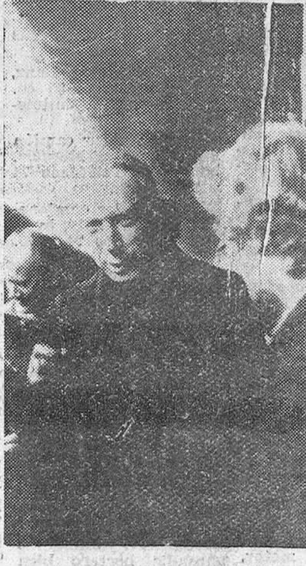
Venecia. — El Primado de Polonia, Cardenal Wysinsky, a su llegada a esta ciudad camino de Roma.