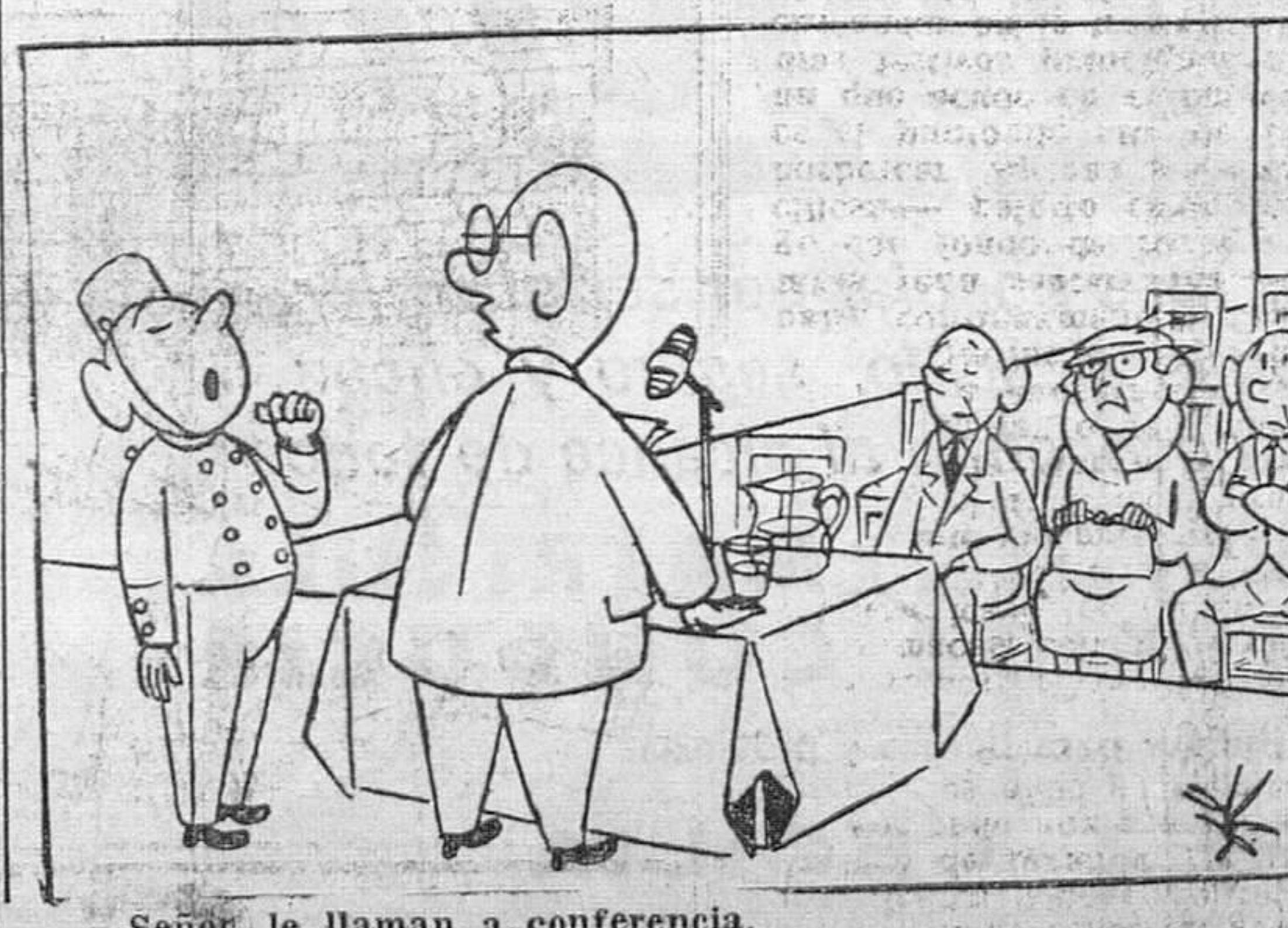
— Señor, le llaman a conferencia.