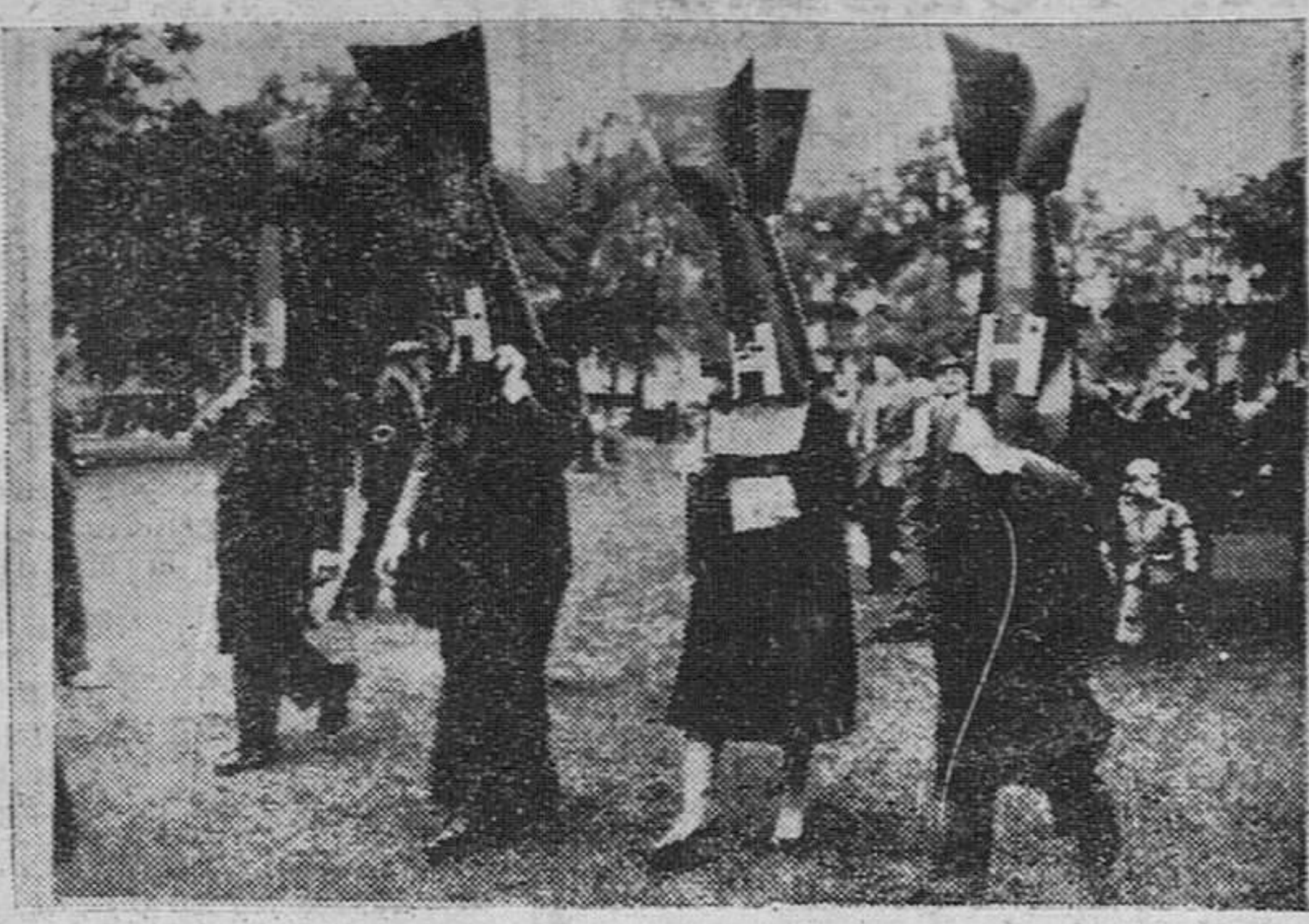
Londres. — Estas cuatro personas cubriendo sus cabezas con capiretes en forma de bomba, marchan a través de Hyde Park durante una reunión política y como protesta contra el empleo de las bombas de hidrógeno.