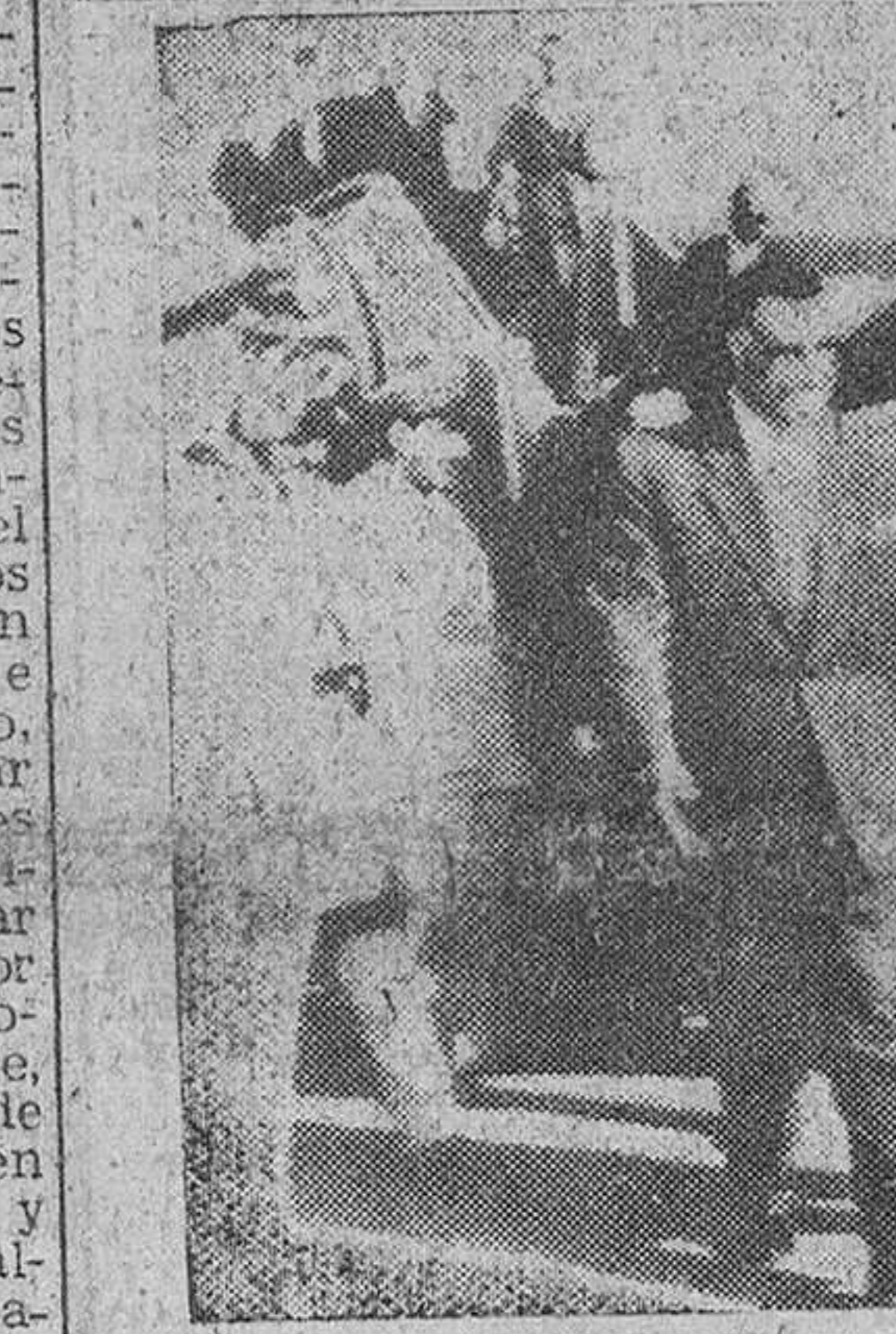
El Cairo. — El presidente Nasser (a la izquierda) y el de Siria, Shukri al Kautly, de la mano, a la llegada de este último a esta capital, al frente de una misión oficial siria y otra egipcia que procedía de la Arabia Saudí, donde conferenciaron con el Rey Saud sobre la crisis de Jordania.