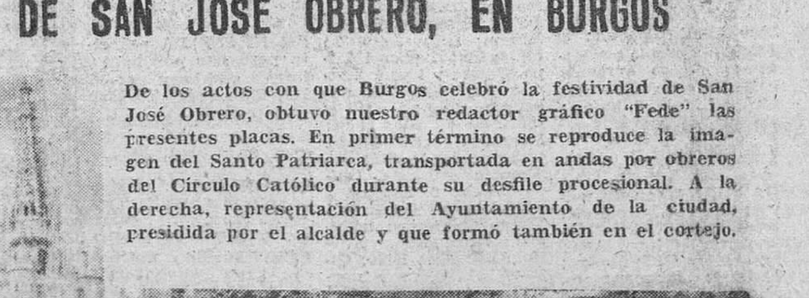
De los actos con que Burgos celebró la festividad de San José Obrero, obtuvo nuestro redactor gráfico "Fede" las presentes placas. En primer término se reproduce la imagen del Santo Patriarca, transportada en andas por obreros del Círculo Católico durante su desfile procesional. A la derecha, representación del Ayuntamiento de la ciudad, presidida por el alcalde y que formó también en el cortejo.