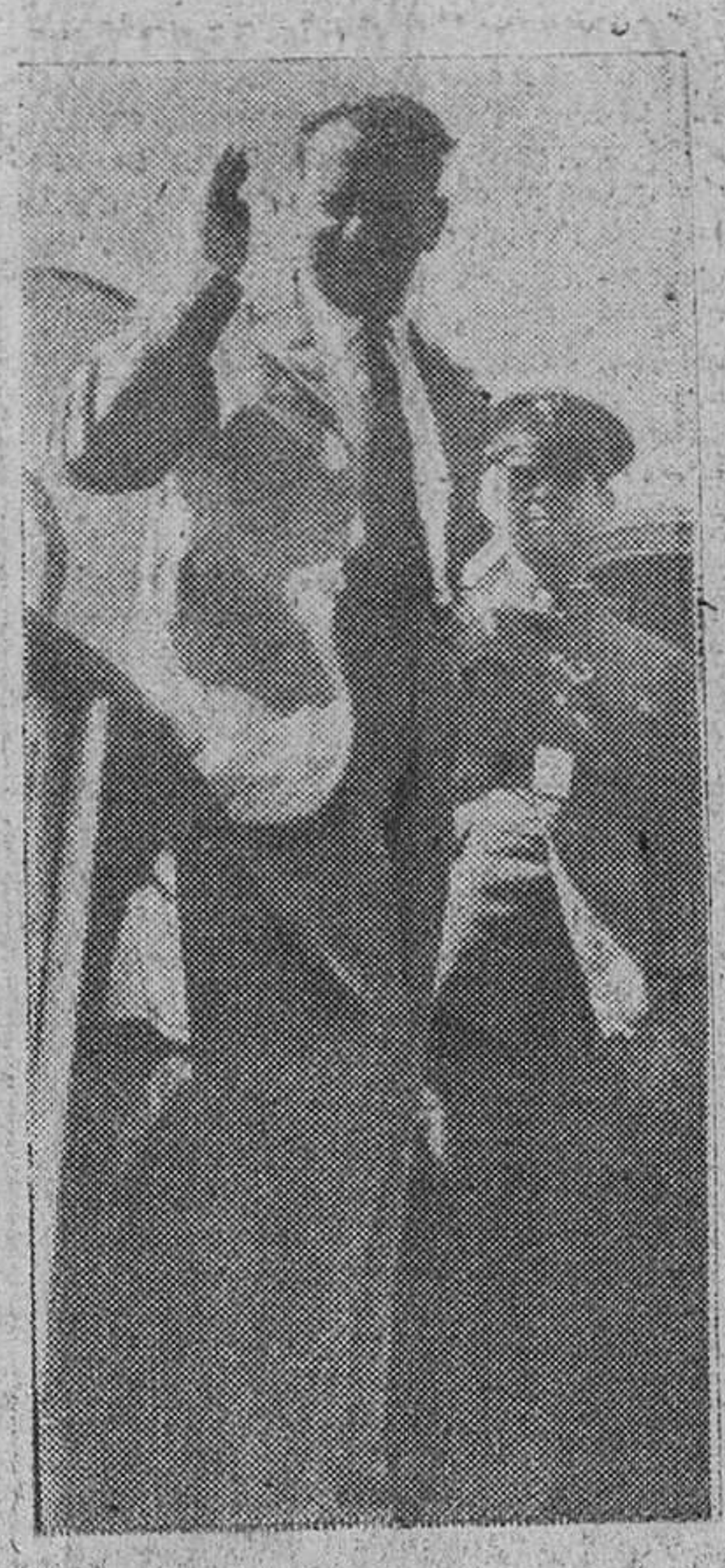
Barcelona. — De paso para Roma ha permanecido unos momentos en el aeropuerto barcelonés, el secretario general de las Naciones Unidas, Mr. "H", a quien vemos en la foto saludando desde lo alto de la escalera del avión mientras un guardia civil le saluda marcialmente.