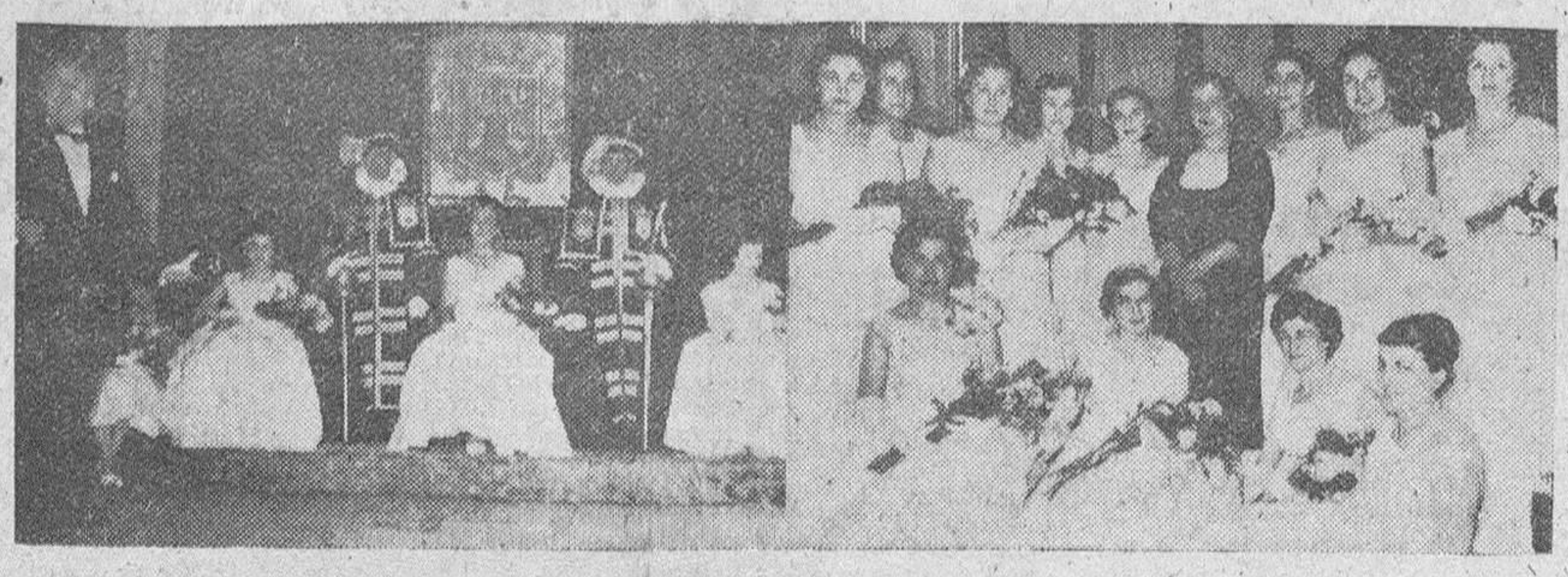
He aquí dos "fotos" obtenidas por "Fede" durante la celebración, en el "Casino" de la brillante "Fiesta de la Poesía" organizada por el "Rincón de los Poetas" del Círculo de la Unión.