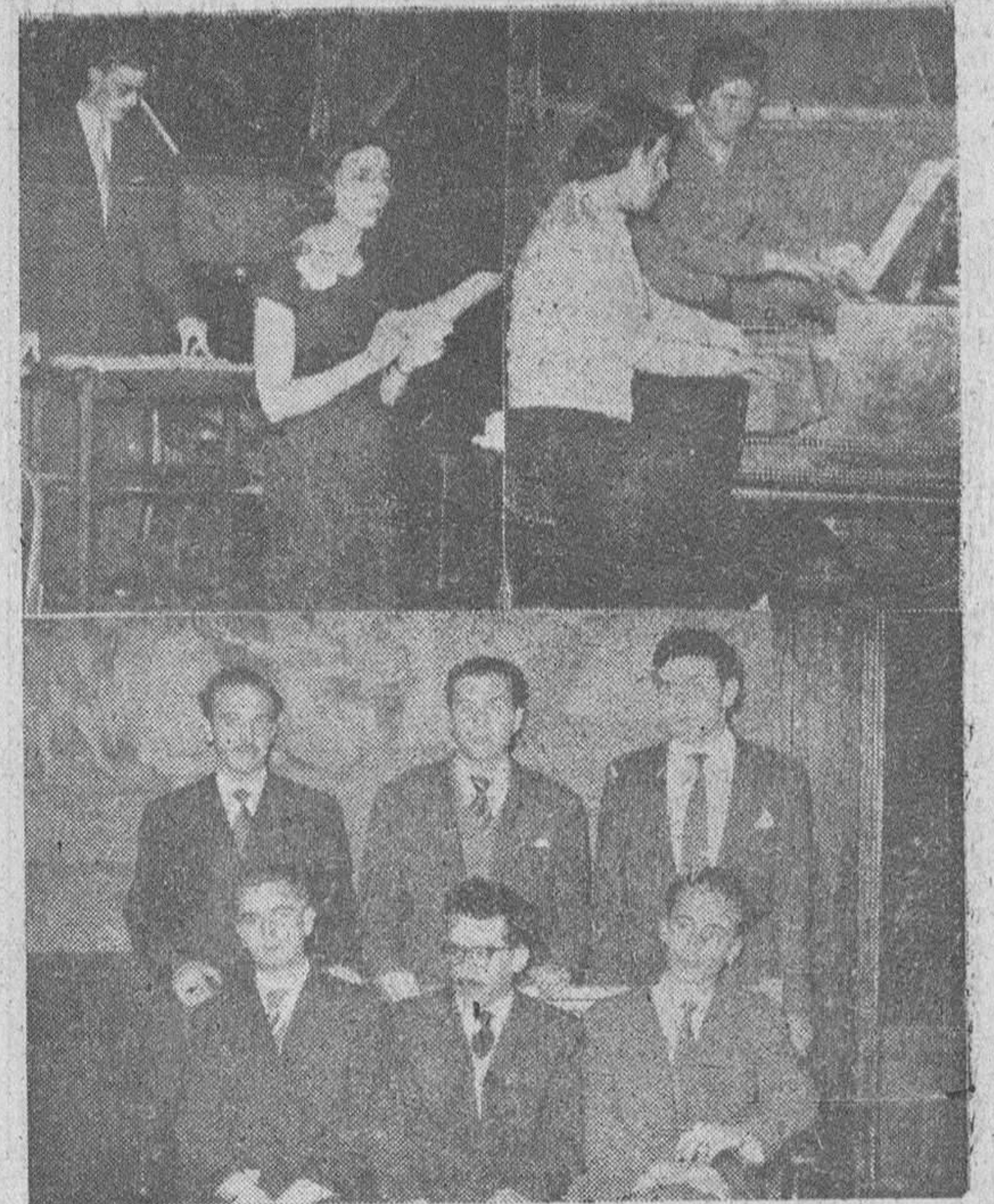
Los poetas burgaleses, para conmemorar la "Fiesta de la Poesía", en el advenimiento de la Primavera, prepararon dos actos, a desarrollarse uno a la vez, organizado por la Asociación Cultural Ibero-Americana y el grupo "Audaux", en el Salón de Recreo y el otro mañana, en el Casino, a cargo del "Rincón de los Poetas" del Círculo de la Unión y que constituirá un homenaje de exaltación poética de la provincia de Burgos. "Fede" obtuvo anoche las precedentes "fotos" de la brillante velada celebrada en el "Salón".