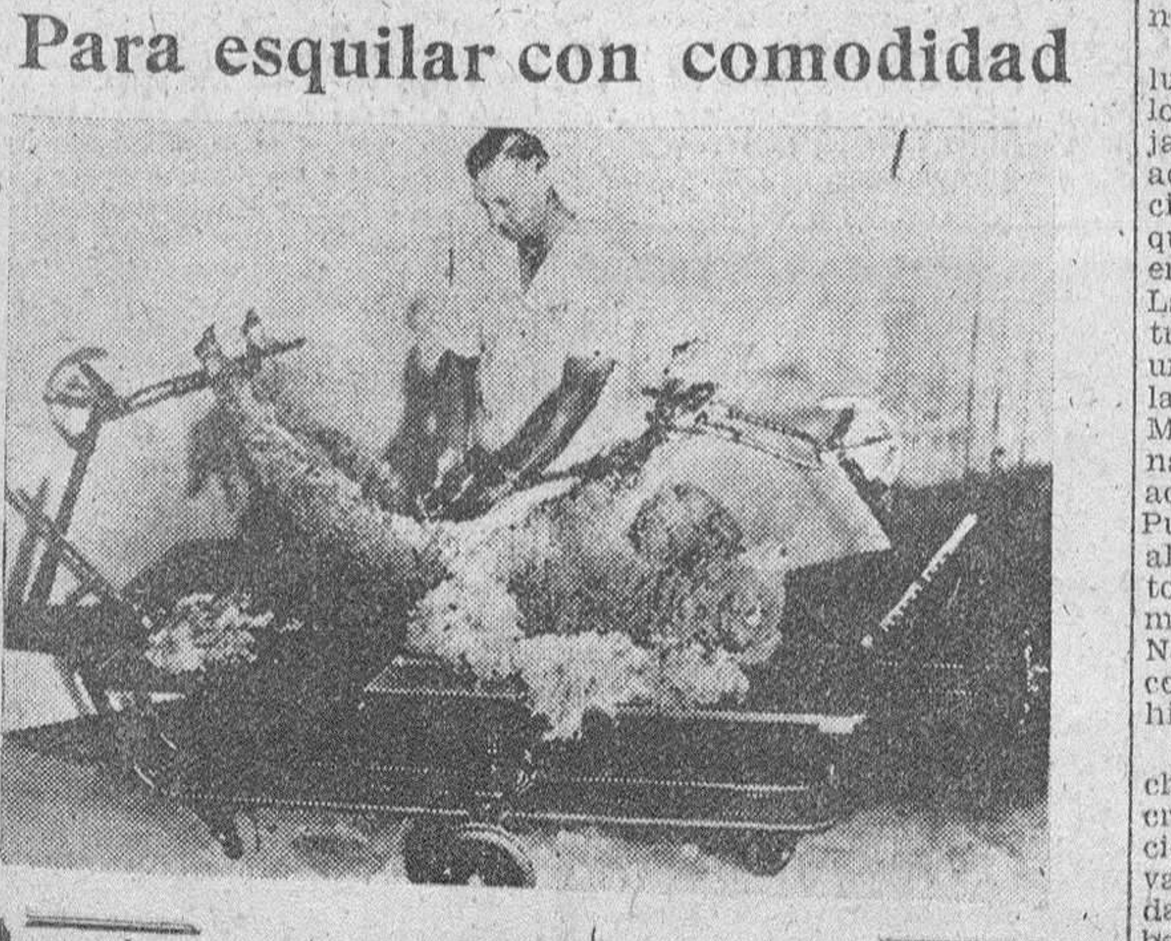
En Inglaterra se está ensayando este aparato semiautomático para esquilan el ganado lanar. La oveja queda sujeta por las cuatro patas a una plataforma que puede girar de modo que el operario no necesita moverse.

Ahora, el tribunal de Massachussets, a los 285 años de aquel crimen, lanza una sentencia diciendo que aquello fue una salvajada y que las seis desgraciadas, eran honorables mujeres de la colonia. Pero como los Estados Unidos eran colonia inglesa, es Inglaterra quien debe pagar los perjuicios.