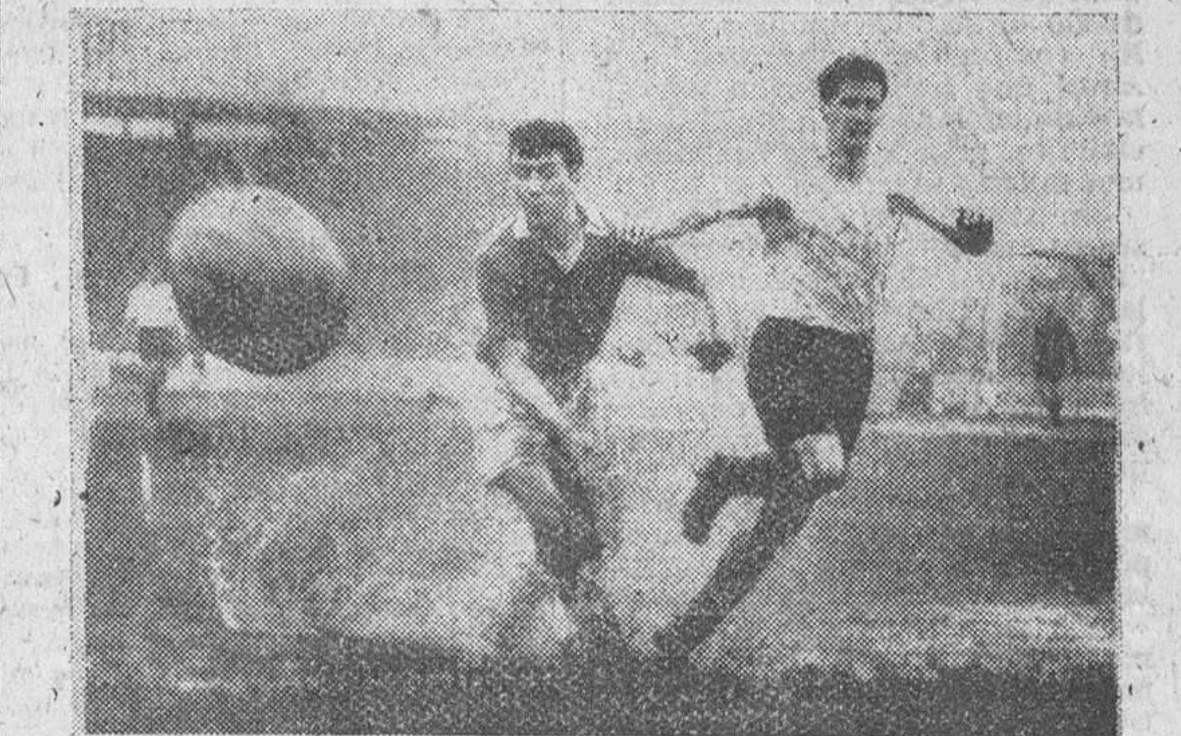
Stamford Bridge (Londres). — Una cortina de agua y barro levantan delante de sí estos jugadores del Chelsea y el Bolton a la disputa de un balón durante el partido de Primera División jugado el pasado sábado. Como sospechará el lector, el campo estaba completamente encharcado a causa de la lluvia caída. — (Foto Cifra)