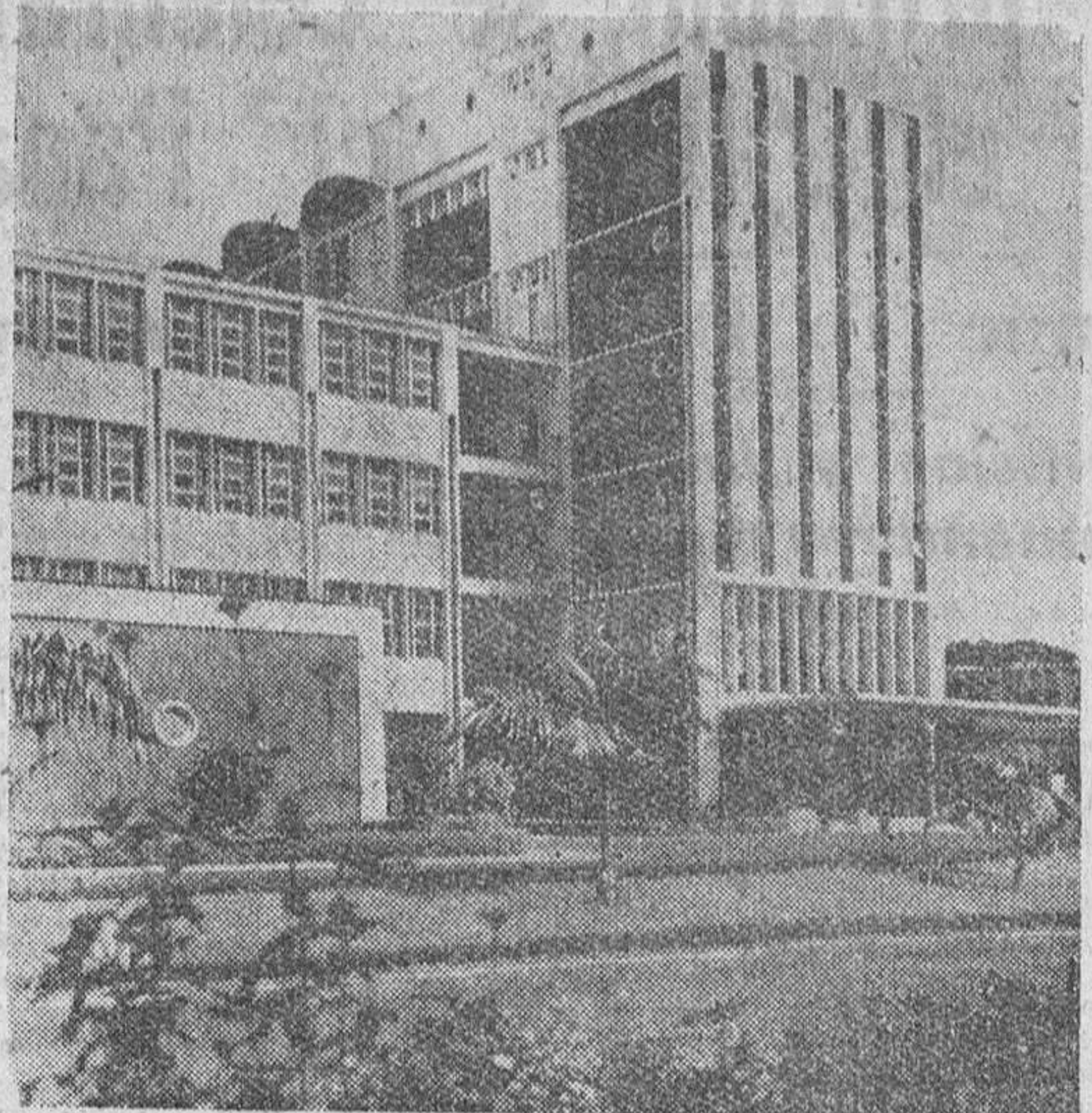
COLEGIO TECNOLÓGICO DE KUMASI (COSTA DE ORO)