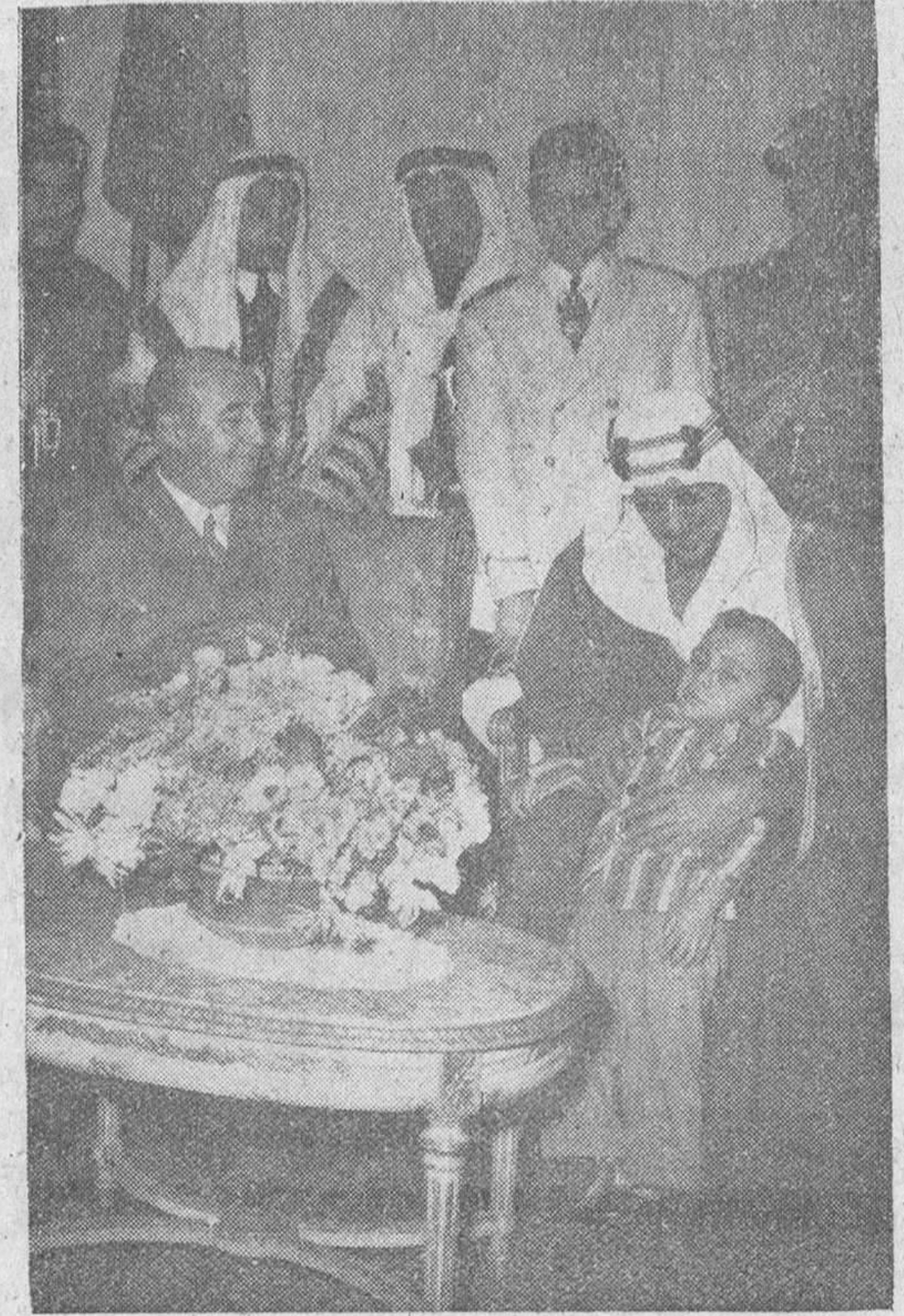
Madrid. — Su Excelencia el Jefe del Estado español, Generalísimo Franco, conversando con S. M. el Rey Saud, que tiene junto a sí a su hijo, el príncipe Manshur, momentos antes de la comida celebrada en la Embajada de Arabia Saudí en la capital de España.