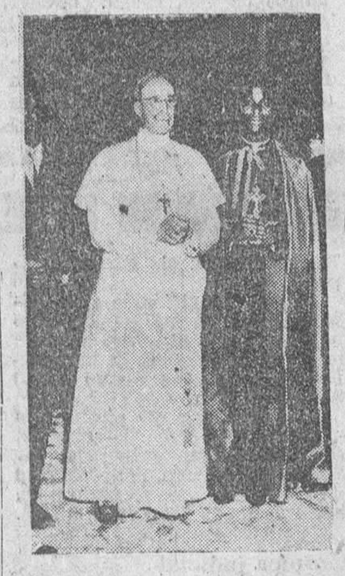
Ciudad del Vaticano. — El nuevo Obispo de Tipasa en Mauritania, Monsignor Bernardino Gantin, es un joven negro de 35 años. Aquí le vemos junto al Santo Padre que le recibió después de su consagración acompañado de sus hermanos.

El nuevo Obispo de Tipasa recibido por el Santo Padre