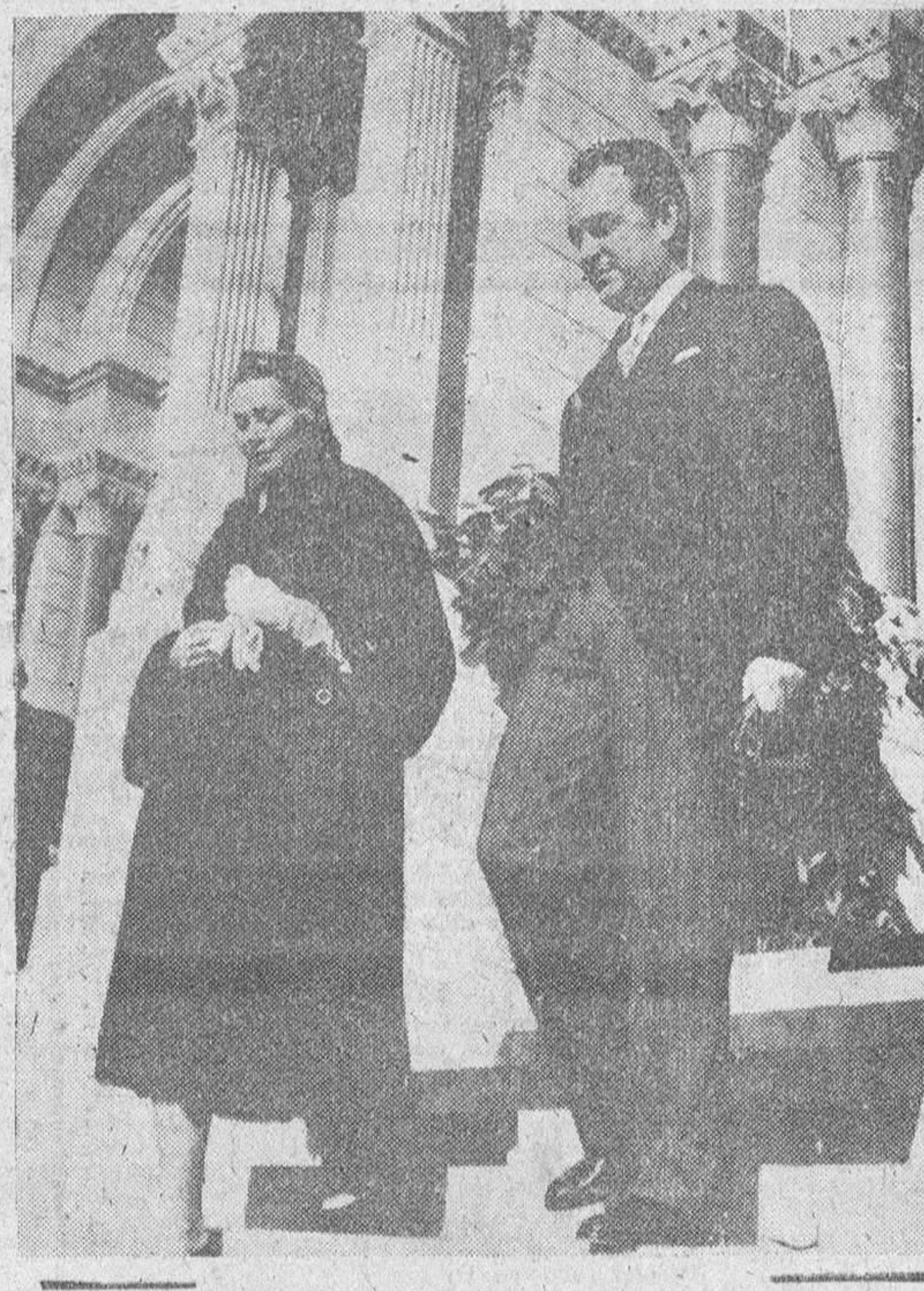
Mónaco. — La Princesa Grace, acompañada de su esposo, el Príncipe Rainier, hace su primera aparición en público después del nacimiento de su hija, la princesa Carolina y se dirige a la Catedral para asistir a una misa en acción de gracias.