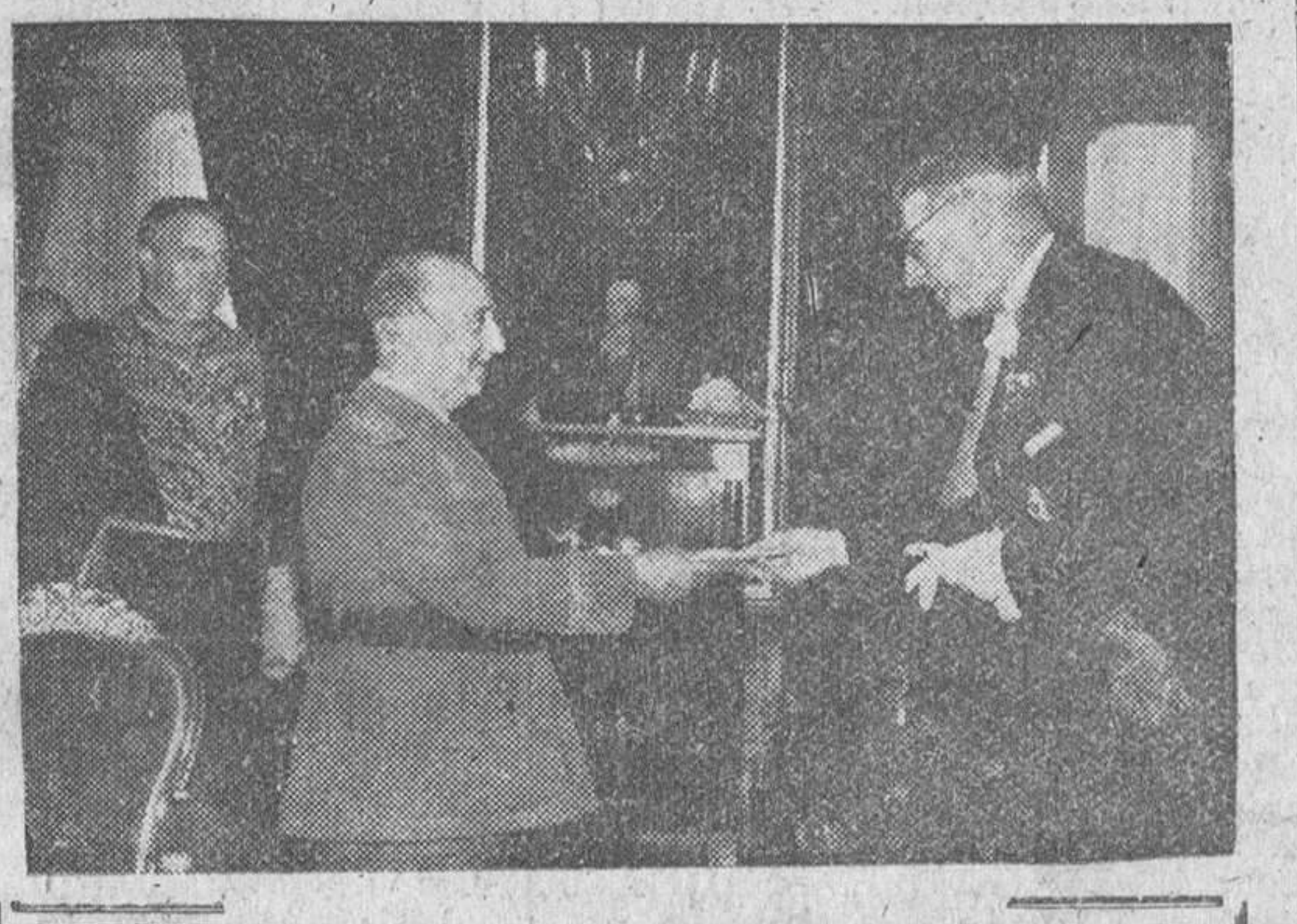
Madrid.— Un momento de la presentación de sus cartas credenciales a Su Excelencia el Jefe del Estado por el nuevo ministro plenipotenciario de Islandia, Sr. Astnar Kj. Jonsson.