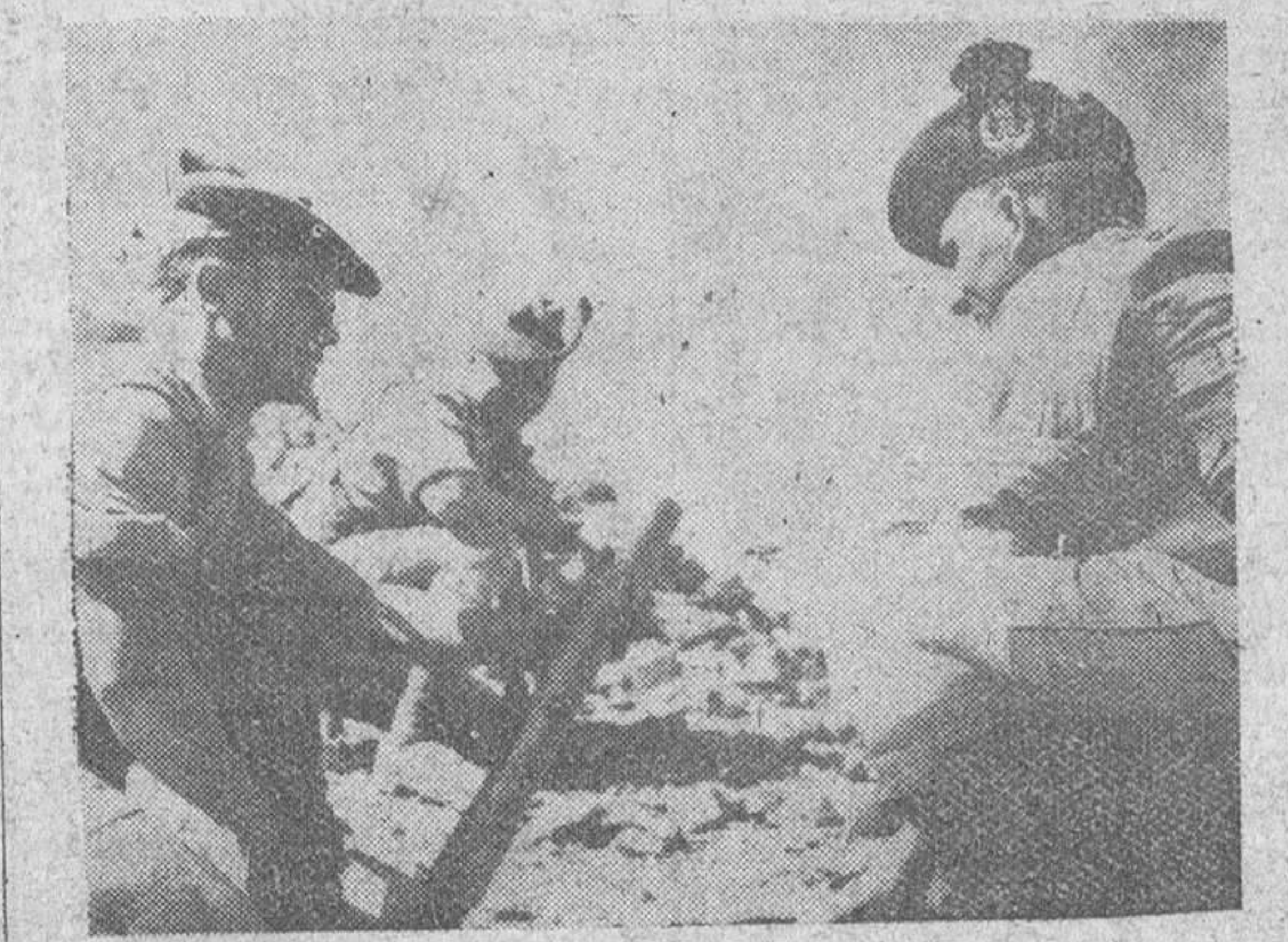
Protectorado de Aden.—Servidores de un mortero del primer batallón del Regimiento de escoceses de la Reina durante una de las operaciones de reconocimiento realizadas en la frontera de este protectorado con el Yemen y con motivo de la actitud hostil de fuerzas armadas yemenitas. Estos disturbios, como se sabe, dieron comienzo en Septiembre pasado, a raíz del asesinato del Emir de Aden por los miembros de una delegación del Yemen.