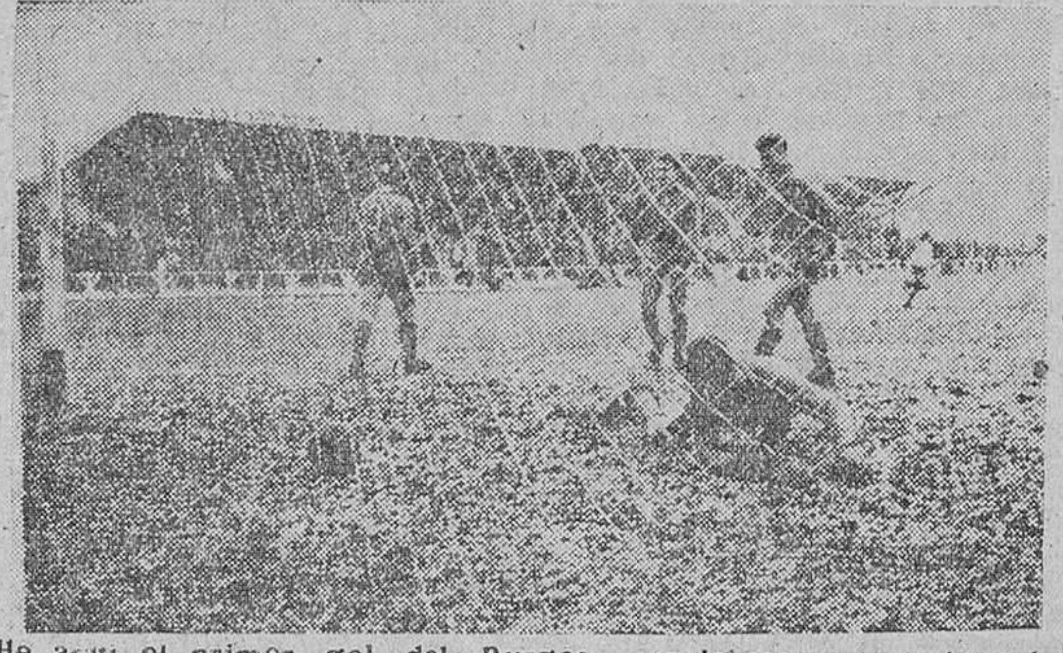
En el primer gol del Burgos, caprichosamente adornado por la nieve, que en aquellos momentos caía con toda intensidad.

En la segunda parte bajó el tono del juego y durante ese período no se marcó ningún tanto