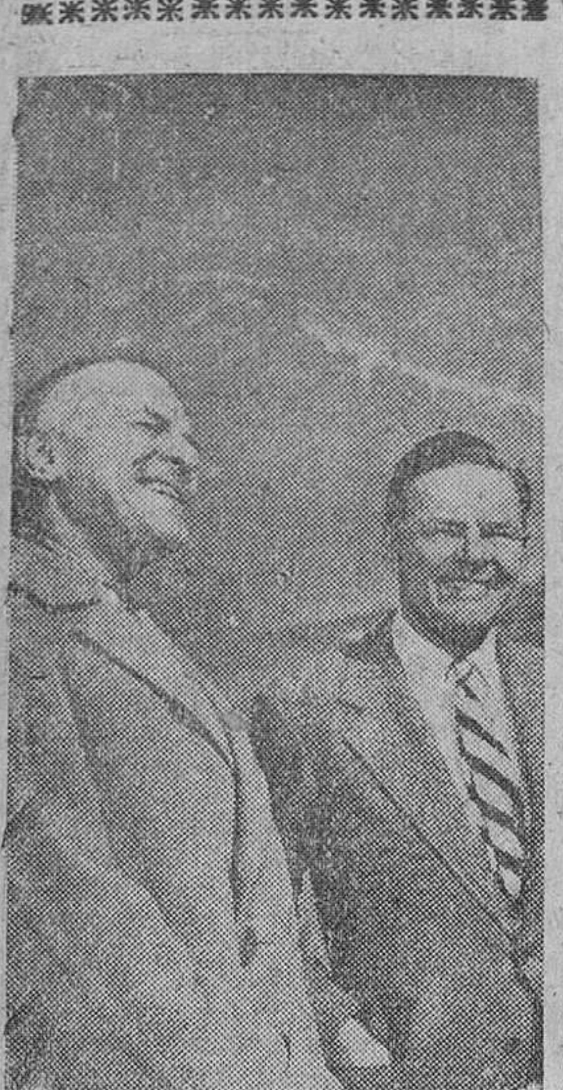
El delegado permanente de los EE. UU. en la ONU llega a Madrid