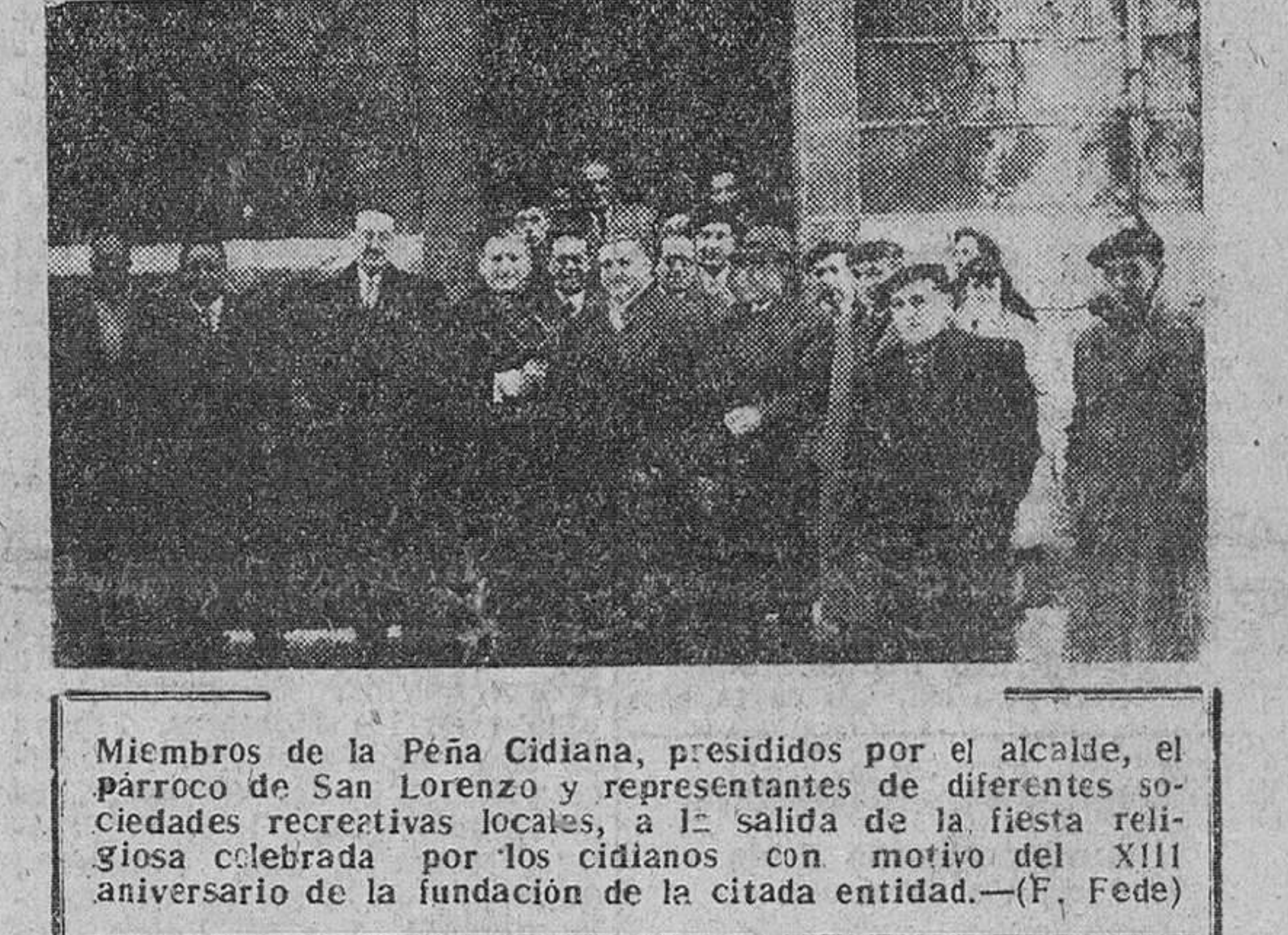
Miembros de la Peña Cidiana, presididos por el alcalde, el párroco de San Lorenzo y representantes de diferentes sociedades recreativas locales, a la salida de la fiesta religiosa celebrada por los cidianos con motivo del XIII aniversario de la fundación de la citada entidad.