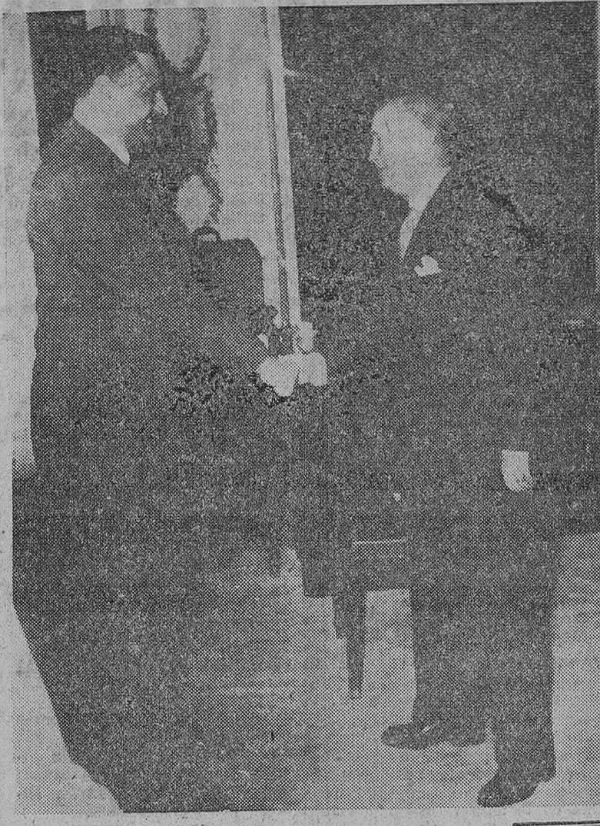
El Cairo. — El embajador de España en esta capital, don José del Castaño, estrecha la mano del presidente de Egipto, Gamal Abdel Nasser, con motivo de la entrevista celebrada en su despacho presidencial y en la que se trató de la visita de éste a España.