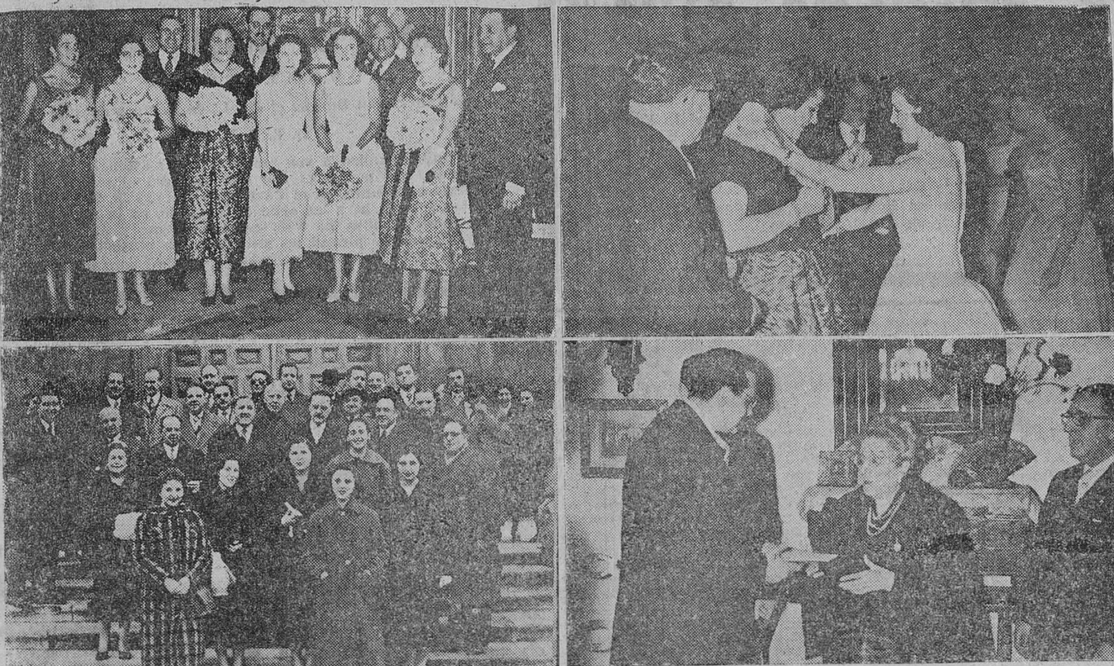
Cuatro documentos gráficos de los solemnes actos organizados por la Asociación de la Prensa de Burgos, con motivo de la festividad del Patrono de los periodistas católicos, San Francisco de Sales. De arriba a abajo y de izquierda a derecha, la "Reina de la Prensa" y las damas de su corte de honor, con la "Reina" del año 1955 y las primeras autoridades burgalesas, fotografiadas con motivo de la brillante fiesta de proclamación celebrada en la Residencia Militar, en la noche del sábado; el momento de la imposición de la banda distintiva a la nueva "Reina" por su antecesora en el cargo; los periodistas "Reinas" y damas, en unión de las autoridades, que asistieron a la Misa celebrada en la capilla del Santísimo Cristo de Burgos, a mediodía del domingo y por último, el alcalde de la ciudad, en su calidad de presidente de honor de la entidad periodística burgalesa, entregando el título de socio de honor de la Asociación, a la ilustre escritora burgalesa doña María Cruz Ebro, que este año cumple sus bodas de oro con el periodismo.—(Reportaje gráfico de Fede)