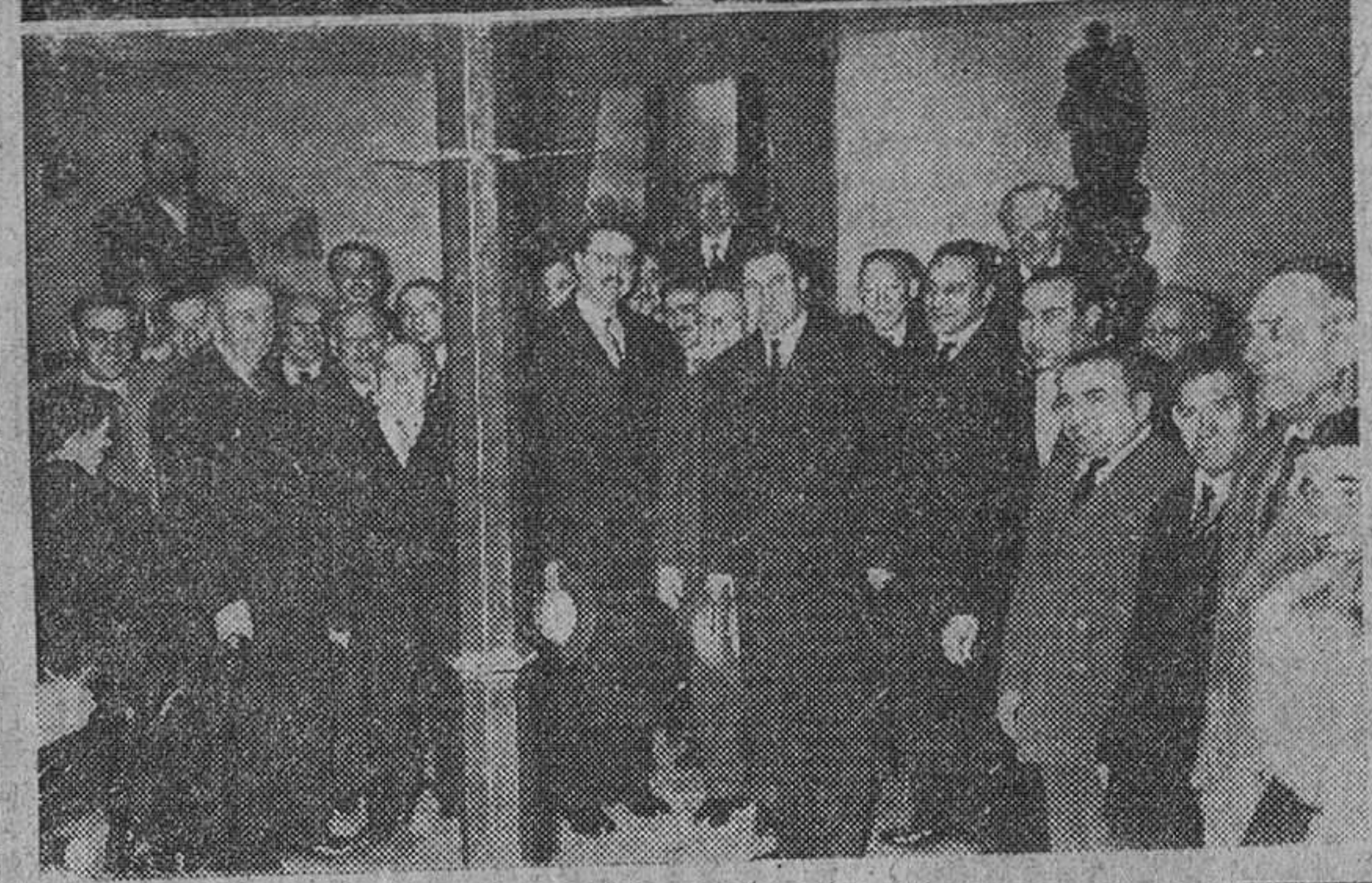
En la fotografía superior, el alcalde de la ciudad, adorando la sagrada reliquia del Santo Patrón de Burgos, San Lesmes Apad, que le es presentada por el Excmo. y Rvdmo. Arzobispo de la diócesis, en la solemne función religiosa celebrada ayer en la iglesia titular. En la parte inferior, el gobernador civil, alcalde y presidente de la Diputación rodeados de los socios de la burgalesísima "Unión Artesana", que celebraron brillantemente su fiesta anual. (Información, en sexta página)