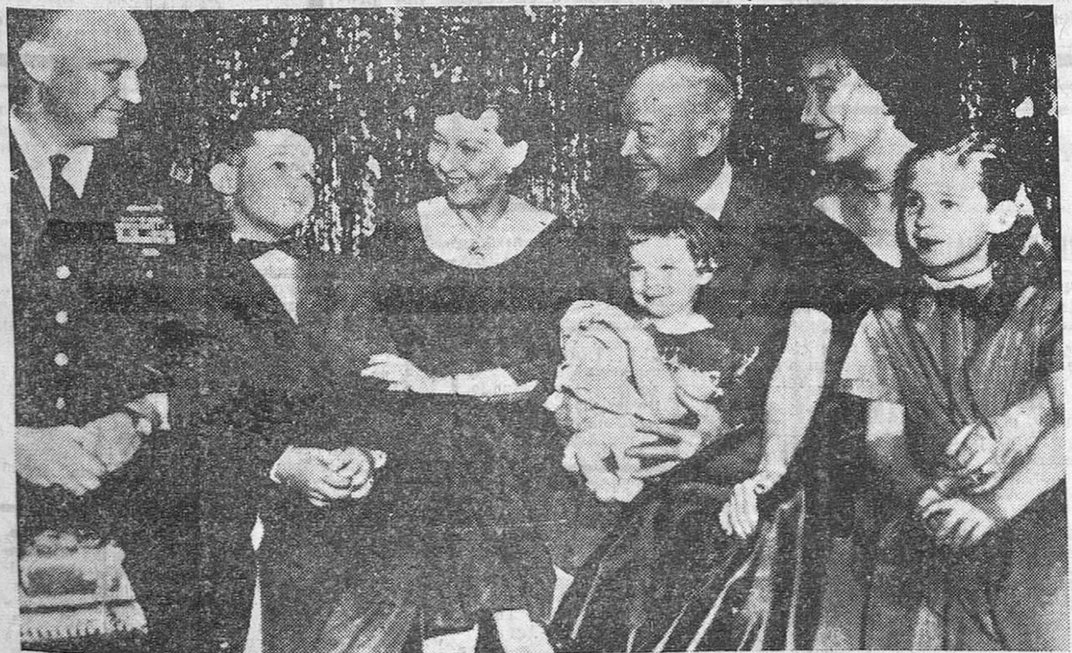
Washington. — El presidente Eisenhower y su esposa acompañados de sus hijos y tres de sus cuatro nietos fotografiados durante la celebración de las presentes fiestas navideñas en la Casa Blanca. En el grupo familiar falta la recién nacida Mary Jean, hija del Mayor Eisenhower.