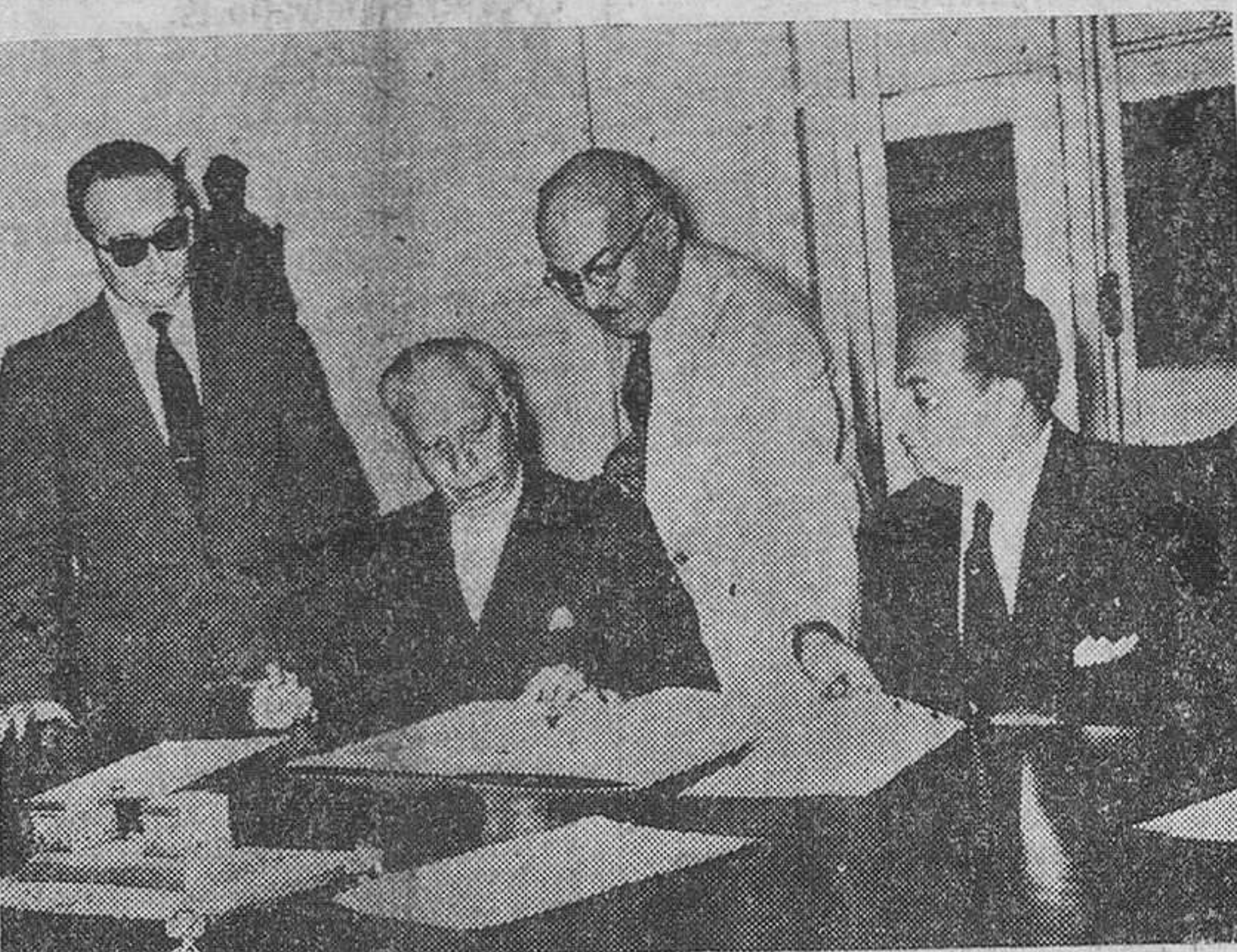
Lima. — El embajador de España, don Antonio Gullón, y el ministro de Relaciones Exteriores, don Fernando Gamio Palacio, en el acto de la firma de la ratificación del acuerdo entre España y el Perú.