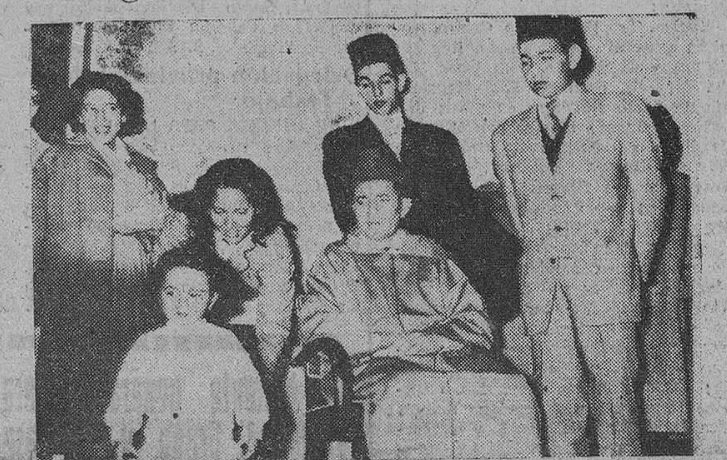
Niza.—Acompañado de su familia, llegó en avión a Niza el Sultán de Marruecos, Sidi Mohamed Ben Yusef. La "foto" está tomada en el aeropuerto y nos muestra al Sultán, rodeado de sus hijos. En primer término, la pequeña Amina, nacida en Madagascar, y detrás, sus hijos Lalla Aicha y Lalla Milka, y sus hijos, el príncipe Abdella y el príncipe heredero, Muley Hassan.