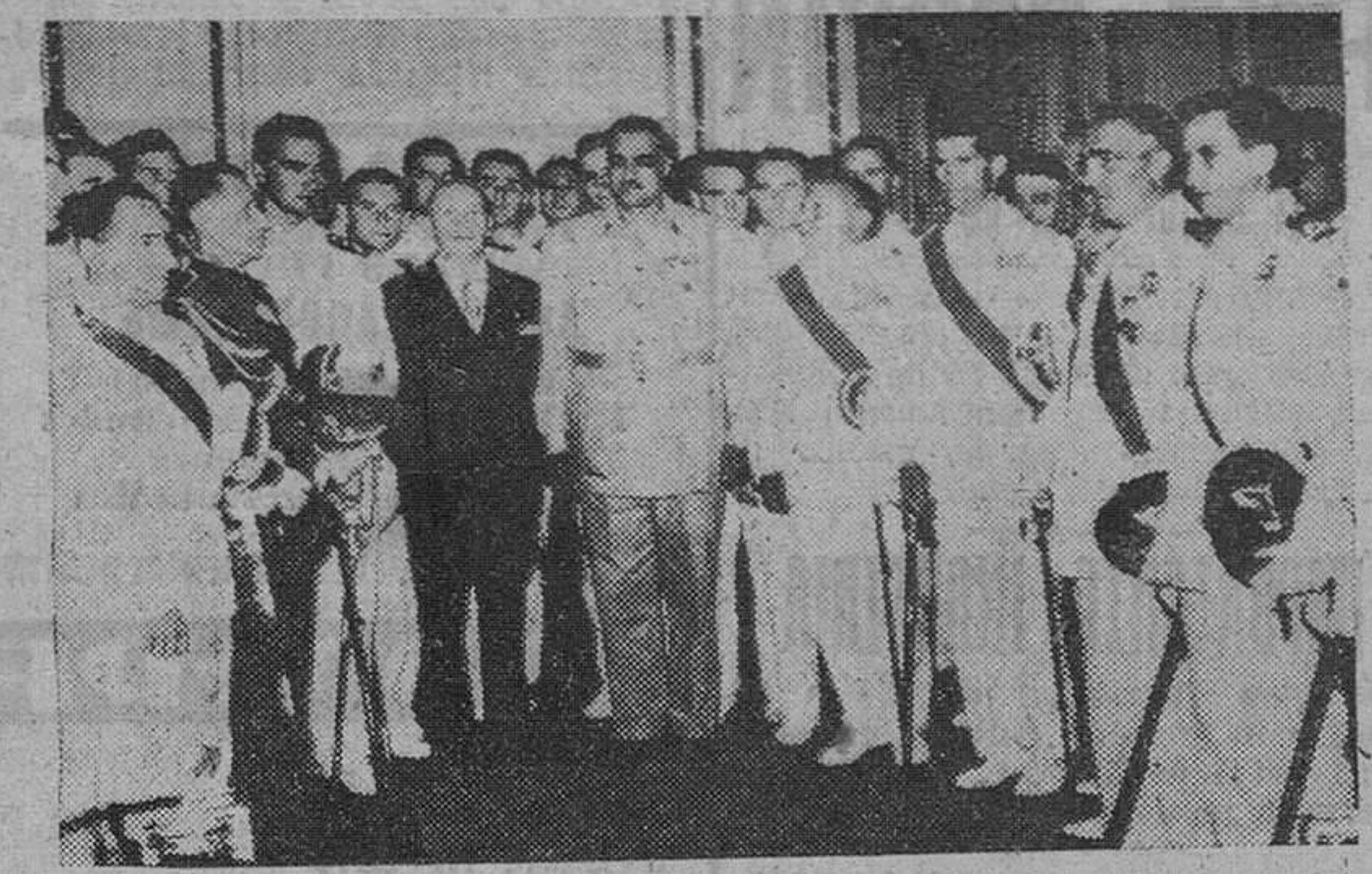
El Cairo.—El primer ministro egipcio, Gamal Abdel Nasser, rodeado de los oficiales y guardiamarinas del minador español "Neptuno", quienes acompañados del embajador de España en El Cairo, le hicieron una visita de cumplimiento, con motivo de la estancia de dicho buque en Alejandría durante cinco días.