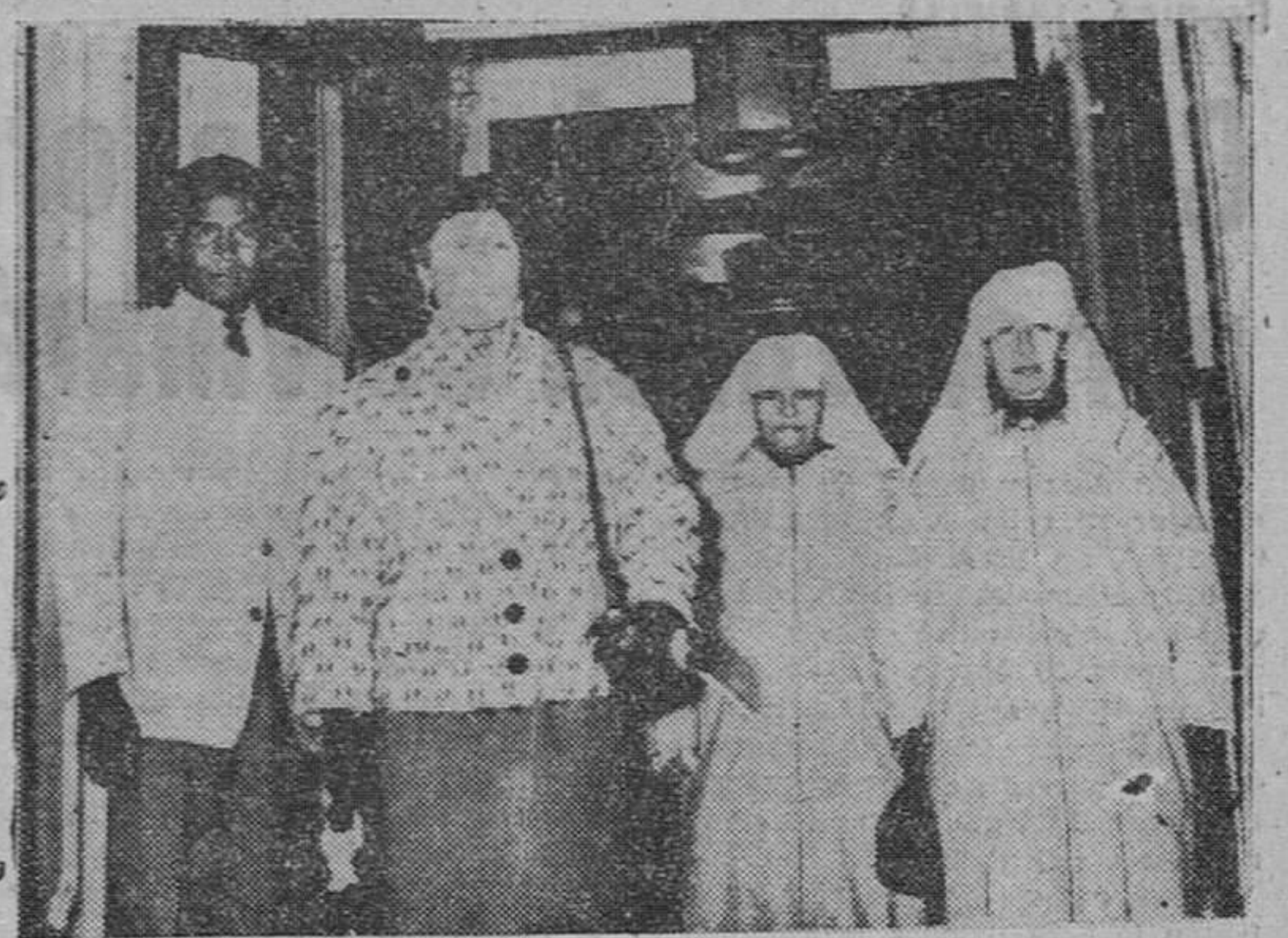
Niza. — Entre las numerosas personalidades marroquíes que acudieron a esta ciudad para recibir al Sultán de Marruecos, figura la hermana de Ben Yussef, que aparece en segundo lugar, de izquierda a derecha, saliendo del hotel donde ha estado alojada.