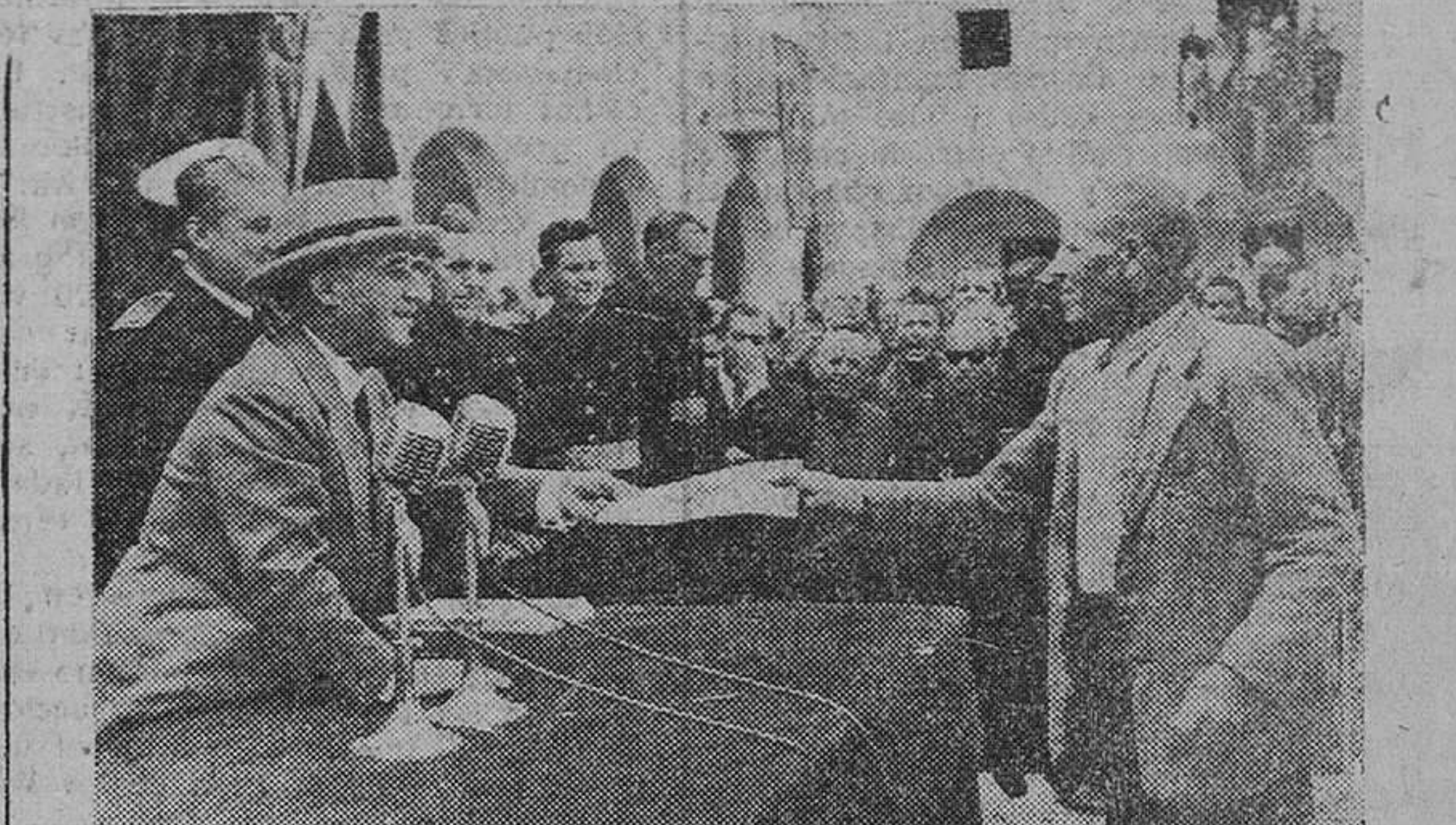
S. E. el Jefe del Estado hace entrega de los títulos de propiedad a los colonos de uno de los pueblos de reciente constitución.

La acción social en la Agricultura es una obra que impugna con vivo interés el Ministerio del ramo, con el fin de lograr un aumento en la producción que proporcione un mejor nivel de vida a los agricultores; de conseguir en el medio agrario la reducción del natural paro estacional y el var al obrero agrícola a la condición de propietario y evitar el abetimiento, creando trabajo y riqueza, así como viviendas cómodas y gratas en los medios rurales.