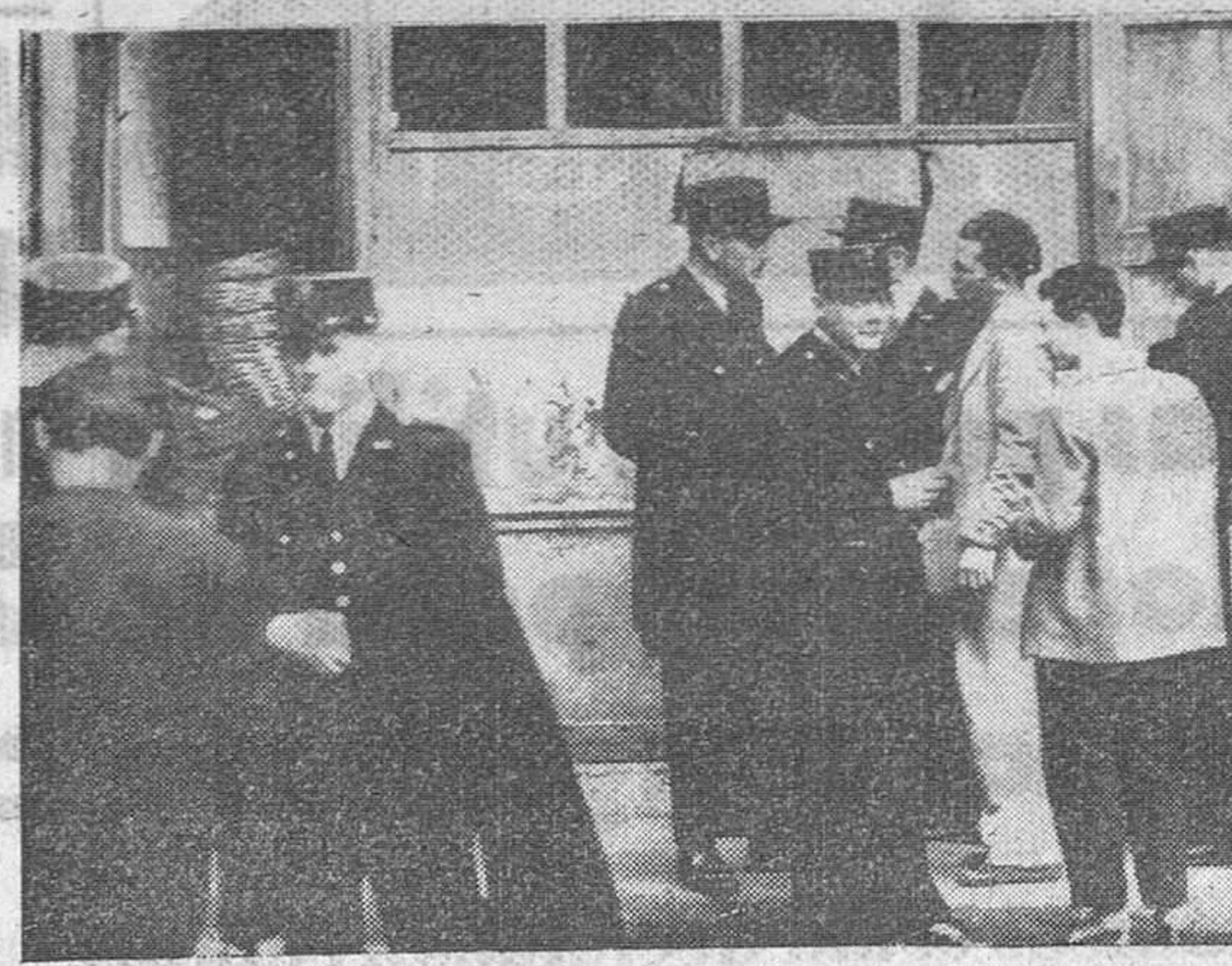
Paris.—Policías de París acordonan las entradas al barrio Costa de Oro, residencia de gran parte de norteafricanos, para impedir los disturbios registrados últimamente.