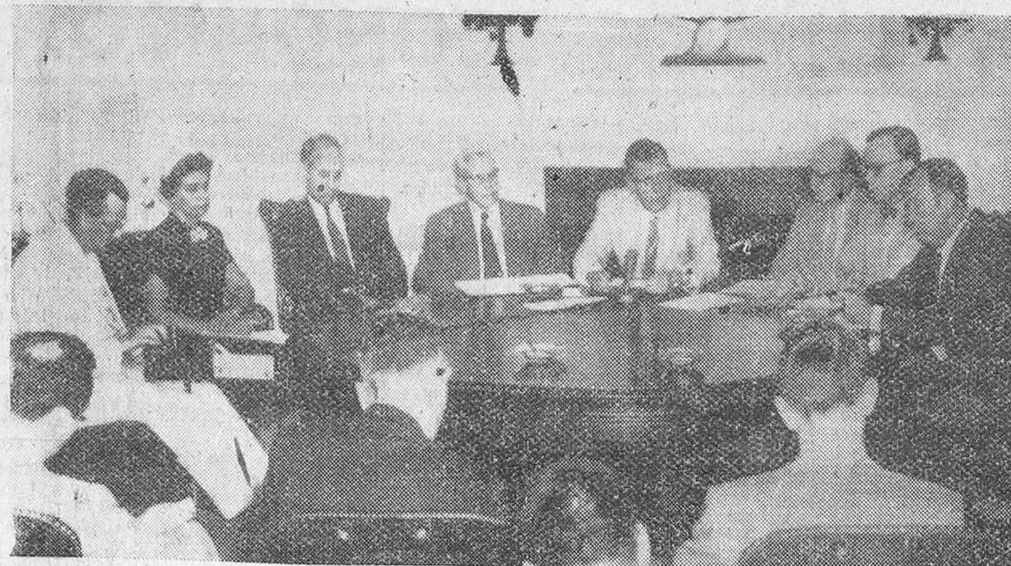
Washington. He aquí la famosa conferencia de la Casa Blanca, en la que el secretario de Prensa del presidente Eisenhower, en su nombre, hizo la sensacional declaración del próximo lanzamiento al espacio interplanetario del primer satélite artificial de la Tierra