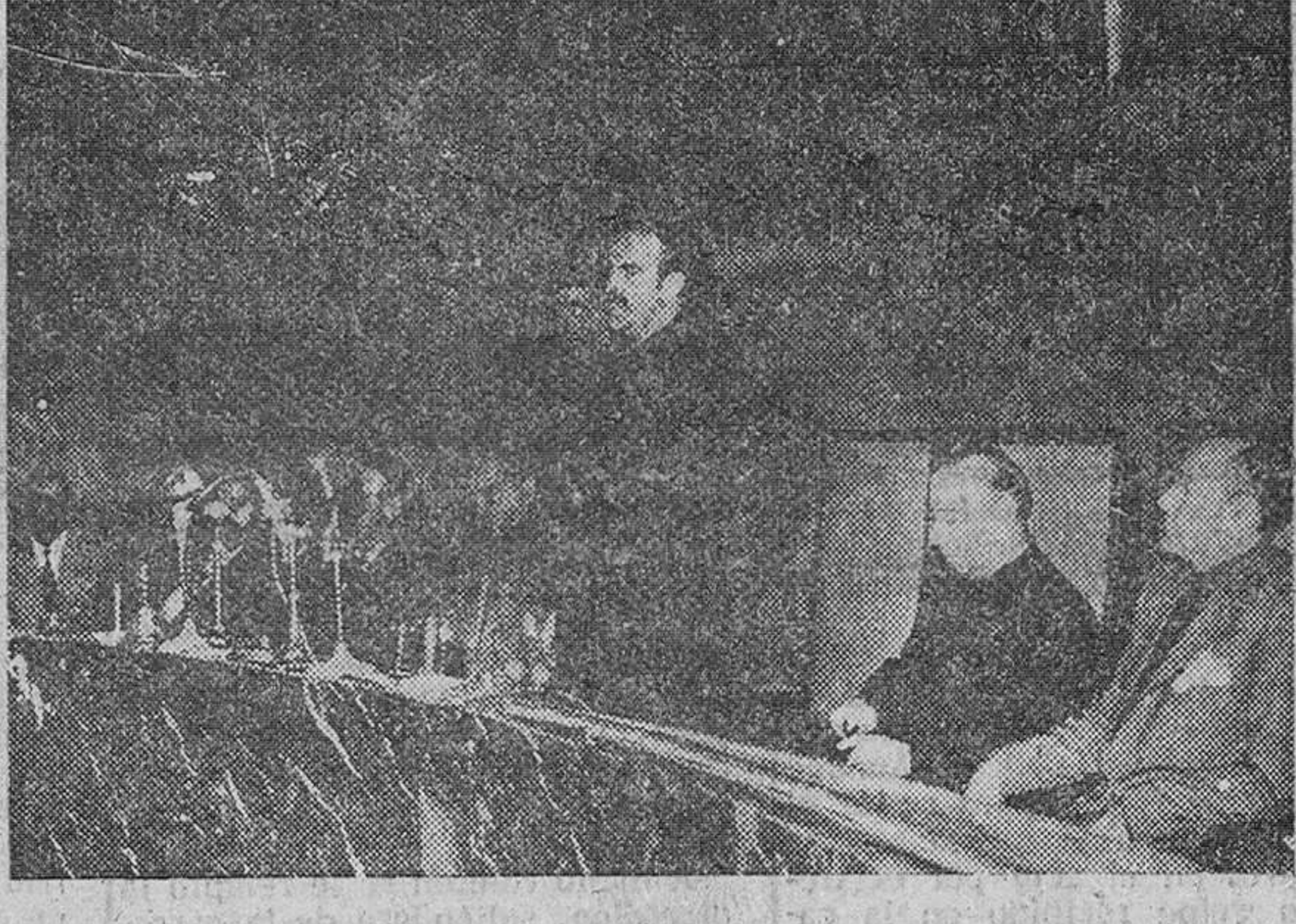
Madrid. — El ministro de Trabajo, don José Antonio Girón, durante su discurso pronunciado en la Casa Sindical, con motivo de la inauguración del III Congreso Nacional de Trabajadores