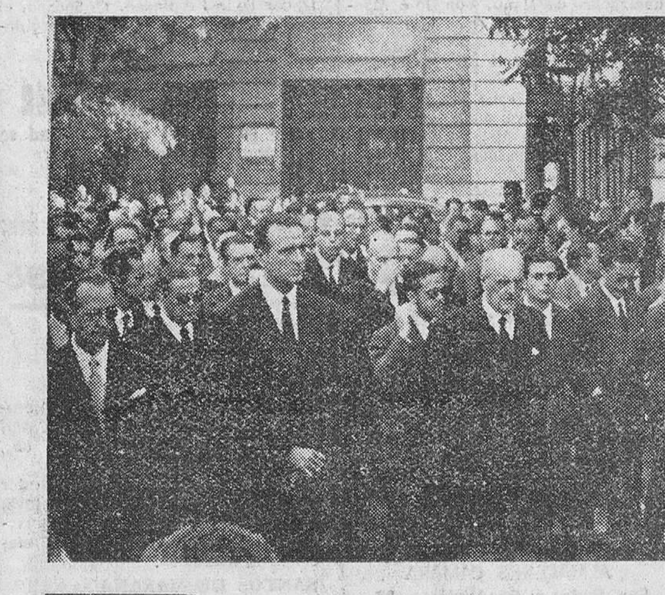
Madrid. — La presidencia del duelo, en la que figuraban los ministros de Información, Educación Nacional, Secretario General del Movimiento, Presidente de las Cortes y otras personalidades. Detrás aparecen los hijos y otros familiares de la finada.