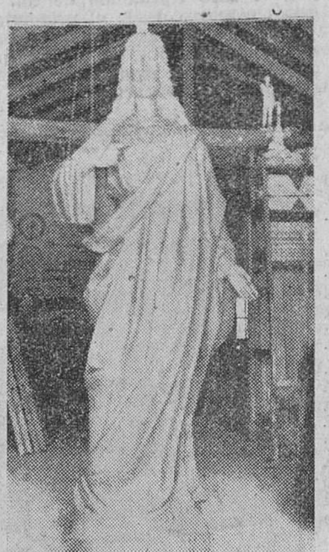
Baños de Valdearados, 1955.